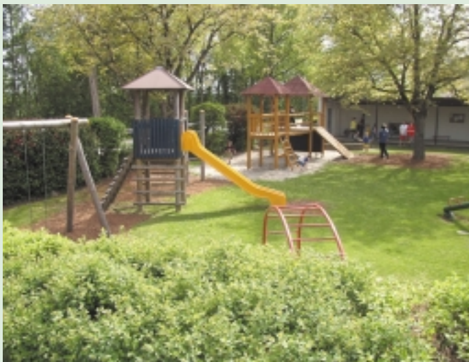
Kindergarten Ritzing „St. Martin“