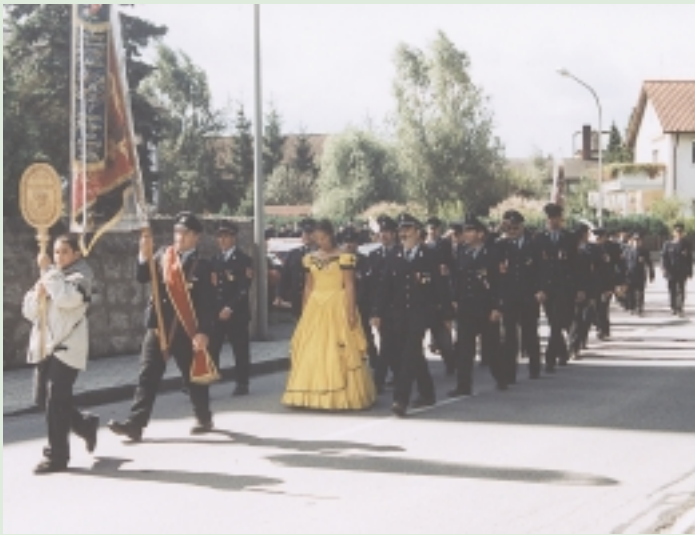
Freiwillige Feuerwehr Kirchdorf a. Inn