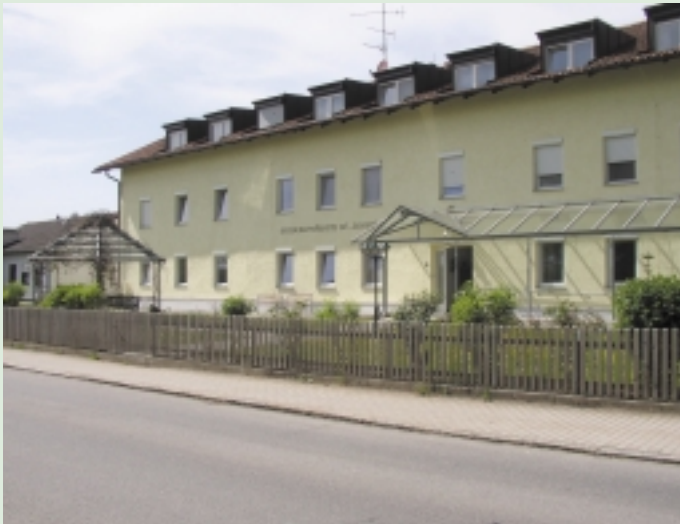
Altenheim St. Josef in Ritzing