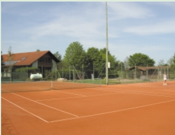
Tennisanlage auf dem Sportgelände i. d. Au

Auskünfte erteilt auch der Zweckverband Freizeit und Erholung Unterer Inn, Innstraße 14, 84357 Simbach a. Inn Tel. 08571/606-0