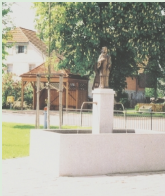
Brunnen Hl. Nepomuk