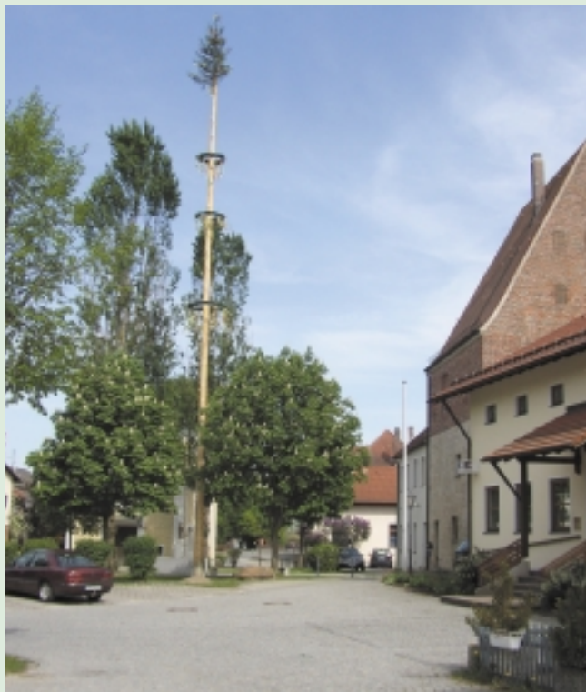
Maibaum Dorfplatz Ritzing