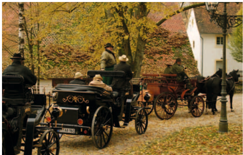
„Luxus der Langsamkeit“ – ein Schlagwort, das uns im hektischen Alltag berührt und hier im Wittelsbacher Land oder den Stauden mit den „Aaglander“ Realität und erlebbar wird