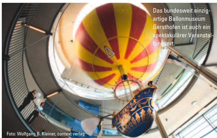
Das bundesweit einzigartige Ballonmuseum Gersthofen ist auch ein spektakulärer Veranstaltungsort.