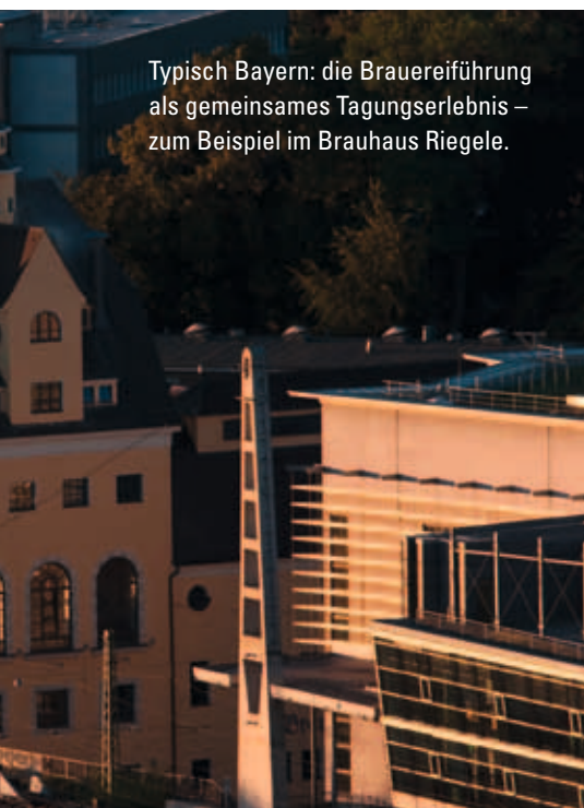
Typisch Bayern: die Brauereiführung als gemeinsames Tagungserlebnis – zum Beispiel im Brauhaus Riegele.

Die große Geschichte Augsburgs und die damit verbundenen Erlebnisse zwischen Fuggerei und Maximilianstraße spielen bei der Entscheidung