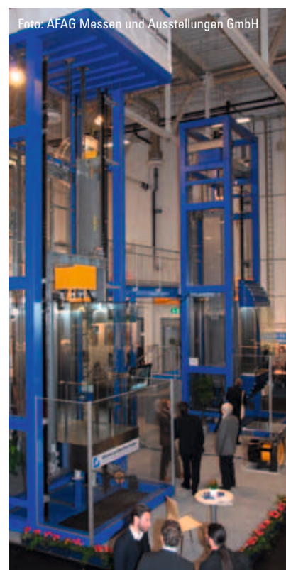
Auf der Interlift 2009 waren über 18.000 Besucher aus über 60 Ländern zu Gast in Augsburg

Die Messe Augsburg bietet ideale Voraussetzungen für Fachmessen, die neben dem Ausstellerraum Platz zum Tagen lassen. Das Tagungszentrum der Messe Augsburg bietet daher auf zwei Ebenen ein Foyer, einen Panoramaraum mit Blick auf das Messegelände sowie Konferenz- und Büroräume und ist ideal geeignet für Fachtagungen. In der variablen multifunktionalen Schwabenhalle können auf insgesamt 6.300 m 2 für