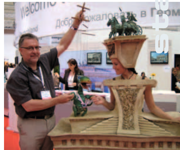
A meets B – Klaus Müller von eest! lässt die Puppen tanzen wenn es um „seine“ Premium destination A geht, wie auf der MICE Messe IMEX 2009

Eest! bietet integrierte Marketing-services. Informationen unter www.eest.de