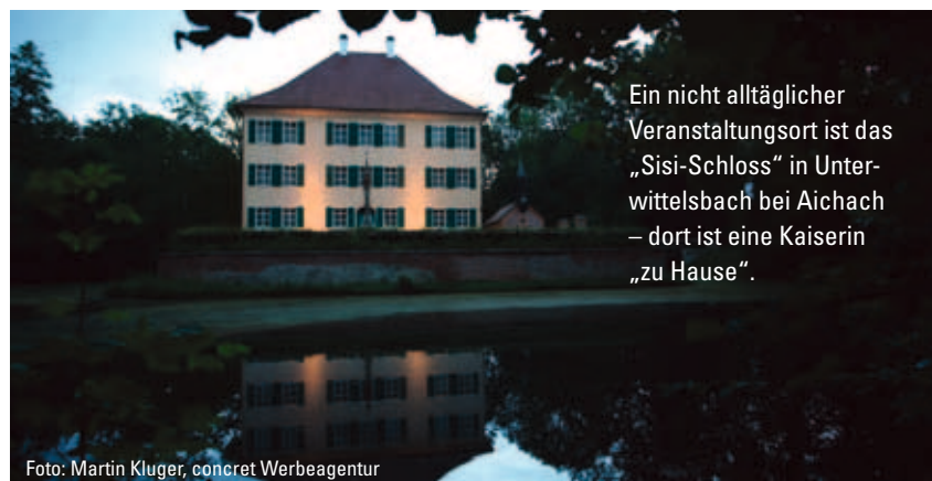
Ein nicht alltäglicher Veranstaltungsort ist das „Sisi-Schloss“ in Unterwittelsbach bei Aichach – dort ist eine Kaiserin „zu Hause“.

Auch der lichtdurchflutete Gewölbesaal im früheren Pferdestall des nahen Klosters Holzen steht für Veranstaltungen zur Verfügung. Der Klostersgasthof Holzen in Allmannshofen bietet Gästezimmer mit 3-Sterne-Komfort, einen Biergarten sowie einen Tagungsraum mit modernster Konferenztechnik.