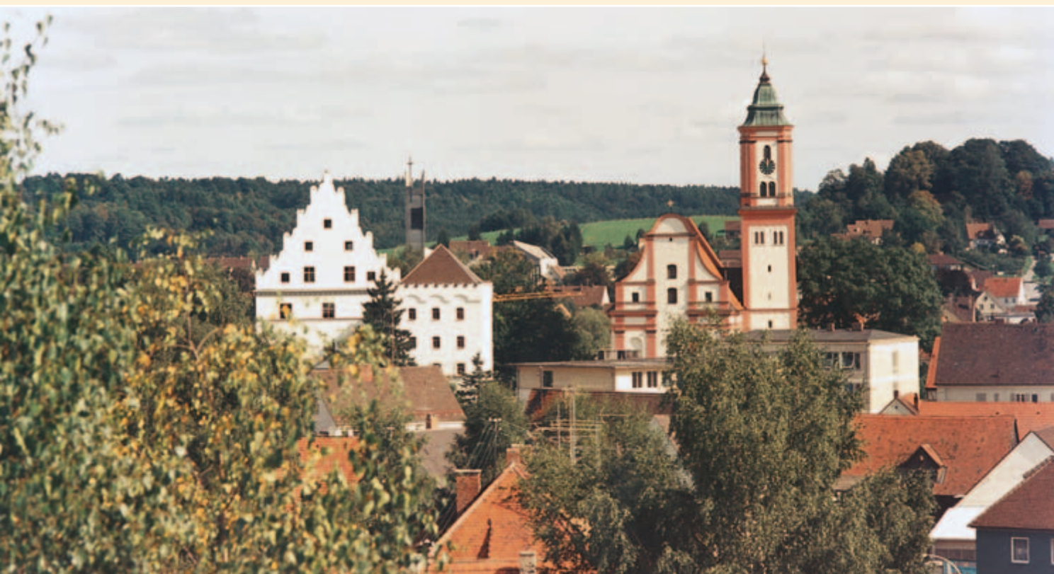
Blick auf die Stadt von Westen mit Lichtensteinschloss und Stadtpfarrkirche

Berta Schmid Pfarrer-Völk-Straße 13, 89331 Burgau-Limbach CSU 0 82 22/13 40