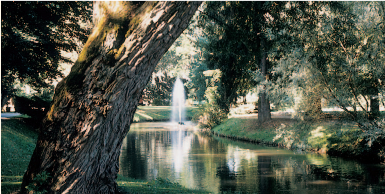
Blick in den weitläufigen Stadtgarten