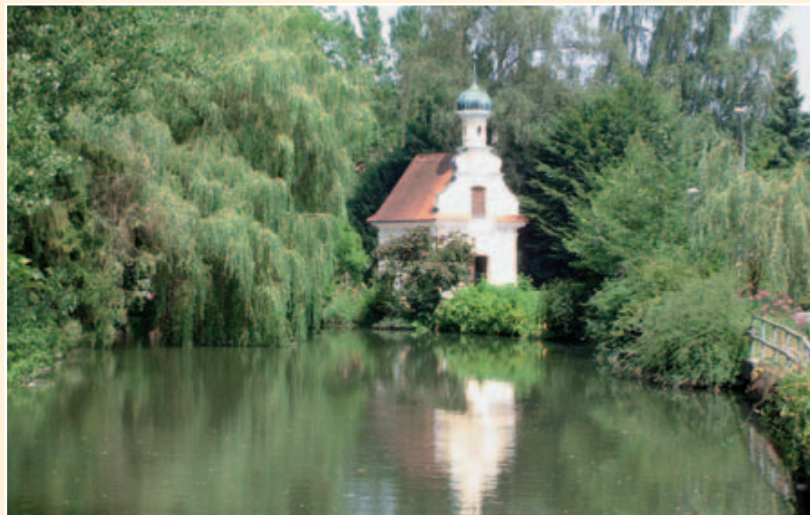
Mühlkapelle an der Kammel