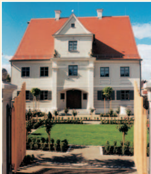
Landauer-Haus, Trachtenberatungsstelle des Bezirks Schwaben