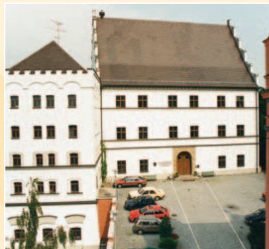
Ehemaliges Lichtensteinschloss, jetzt Sitz der Fachakademie für Sozialpädagogik