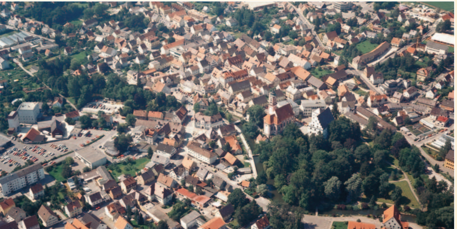
Blick auf die Stadt Krumbach (Schwaben)

kunstgeschmiedete Beschläge und Nahrungsmittel) zeugen von einem gesunden Arbeits- und Wirtschaftsleben innerhalb eines funktionierenden Gemeindewesens. Die Stadt Krumbach – in Klammern jeweils der Zeitpunkt der Eingemeindung – setzt sich zusammen aus der Kernstadt Krumbach und den Stadtteilen Hohenraunau (01.01.1972), Billenhausen (01.07.1972), Edenhausen (01.01.1973), Attenhausen (01.01.1977) und Niederraunau (01.05.1978).