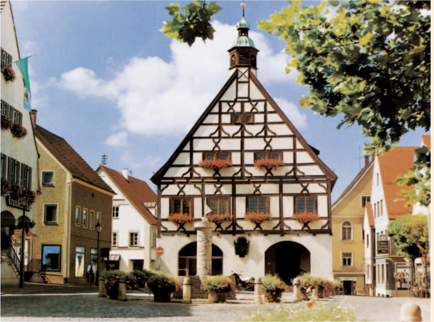
Der Krumbacher Marktplatz mit dem historischen Rathaus von 1679