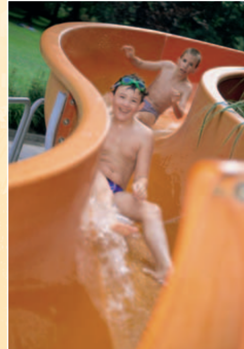
Erlebnisrutsche im Freibad