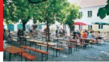
Biergarten in Blumenthal