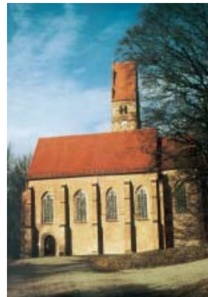
Burgkirche in Oberwittelsbach

Oberwittelsbach: 1115 schrieb man Witolinespah, 1138 Witlinespah, 1327 obern Wittelspach, später Oberwittelsbach. Der Ortsname bedeutet „Hügel oder Anhöhe des Wittelino“ oder kurz: „Kleine, bewaldete Anhöhe“. Die frühesten Anfänge dieses Burgortes sind