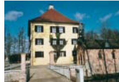
Sisi-Schloss in Unterrittelsbach

Schulstraße 8, Telefon 59 69 Montag 16 bis 19.30 Uhr, Mittwoch 9 bis 13 Uhr, Donnerstag 9 bis 12 Uhr, Freitag 14 bis 17.30 Uhr