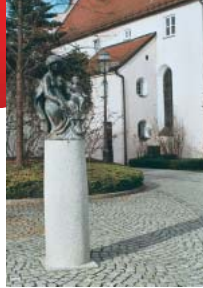
Bürgermadonna im Spitalgarten

Griesbeckerzell: Der Ortsname ist eine Verschmelzung zweier Namen: „Grizpach“ und „Cell“. Ursprünglich scheint der Ort nur „Cell“ geheißen zu haben. Später wurde er nach den neuen Inhabern „Grießpach“ genannt. Erst 1359 taucht urkundlich ein Ulrich von Griezpeck auf. 1371 schrieb man Griespeckerzell. Nach dem Aussterben der „Griesbecke“ im 14. Jahrhundert trat ein Geschlecht von Fischach in den Besitz des Ortes und der Hofmark. Später erschienen die Zelter, dann von 1500 bis 1827 die Herren von Burgau. Das 1698 erbaute Barockschloss in der Mitte des Dorfes kam 1854 zum Abbruch. 1818 wurde Griesbeckerzell mit Hiesling, Hofgarten, Neuhausen und Knottenried eine selbstständige Gemeinde. 1762 zählte das Dorf 295 Einwohner. 1970 waren es 964 Einwohner. 1978 wurde Griesbeckerzell mit 1198 Einwohnern auf 938 ha Gebietsfläche in die Stadt Aichach eingemeindet.