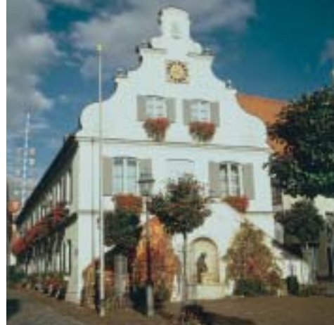
Rathaus der Stadt Aichach

Geschäftszeiten: Montag bis Freitag 8.00–12.30 Uhr Montag bis Mittwoch 13.30–16.00 Uhr Donnerstag 13.30–18.00 Uhr