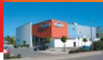
Das neue Hollyworld-Movieplex-Kino in Aichach