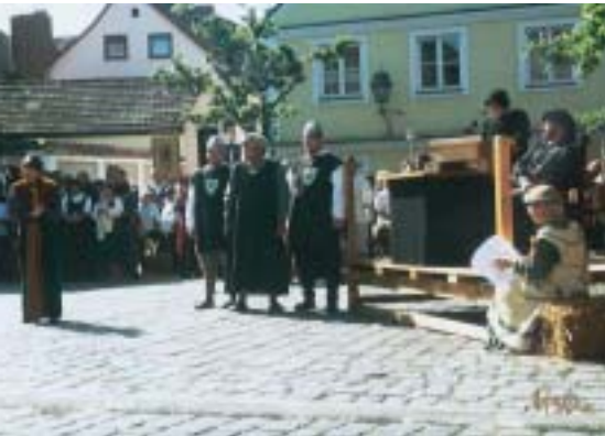
Mittelalterliche Markttage – Gerichtstag

Aichach kann auf eine 1000-jährige Geschichte zurückblicken.