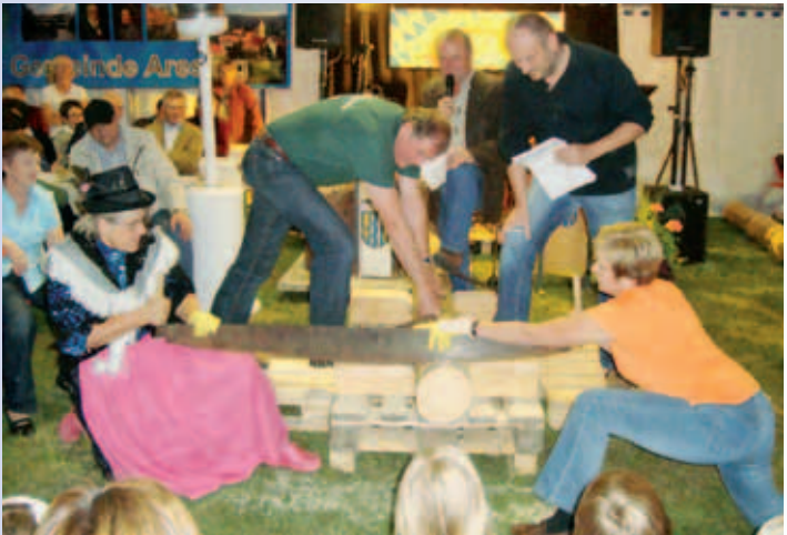
Bürger- und Pfarrfest im September 2009