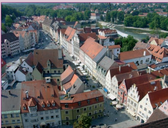
Altstadt mit Lechwehr

Am Anfang war in Landsberg der Fluss – der Lech. Am Karolinenwehr unweit des Hauptplatzes stürzt er über vier Stufen in die Tiefe. Er umarmt die historische Altstadt – inmitten der Stadt ein fast ungebändigter Wildfluss, von dessen Uferwegen aus Sie herrliche Ausblicke auf die Altstadt mit ihren Türmen, Dächern und Fassaden haben. Die Stadtkulisse baut sich am Lechsteilhang auf, Schlossberg, Leitenberg und Krachenberg sind die drei Hügel im Stadtwappen.