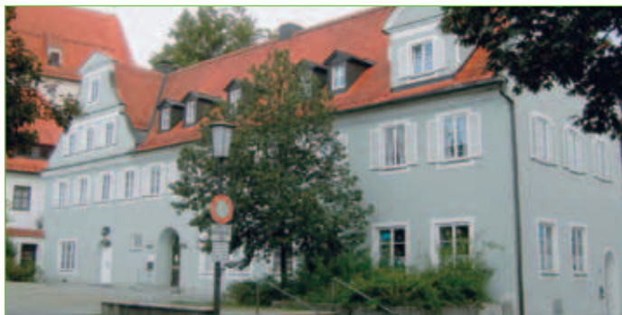
Kindergarten St. Mang-Kirche