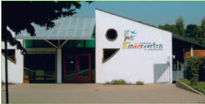
Integrativer Kindergarten Schwalbennest