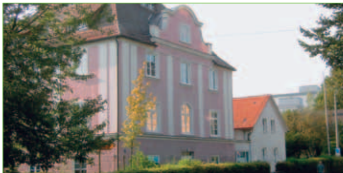
Kindertagesstätte St. Nikolaus