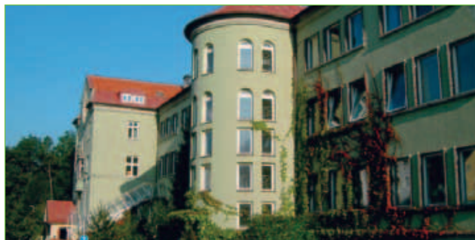
Kindergarten der Aktiven Schule Allgäu

Name: Kindergarten der Aktiven Schule Allgäu Adresse: Reichlinstraße 23 87439 Kempten (Allgäu) Telefon: 0831/5122112 Fax: 0831/5122114 E-Mail: info@aktiveschule.de Internet: www.aktiveschule.de Träger/in: Förderverein Aktive Schule Allgäu e.V. Öffnungszeiten: Mo., Mi. und Fr. 07.30 – 13.00 Uhr Di. und Do. 07.30 – 15.00 Uhr