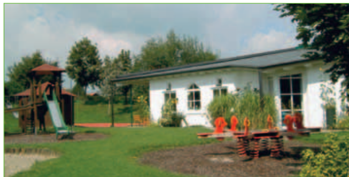
Integrativer Kindergarten Miteinander