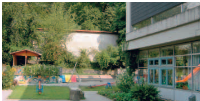
Kindergarten Christi Himmelfahrt

Name: Kindergarten Christi Himmelfahrt Adresse: Freudental 12 87435 Kempten (Allgäu) Telefon: 0831/26378 Fax: 0831/5122119 E-Mail: info@kindergarten-christi-himmelfahrt.de Internet: www.kindergarten-christi-himmelfahrt.de Träger/in: Kath. Kirchenstiftung Christi Himmelfahrt Öffnungszeiten: Mo. – Do. 07.00 – 17.00 Uhr Fr. 07.00 – 16.00 Uhr