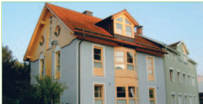
Hort der Freien Waldorfschule