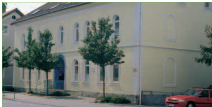
Städt. Kindertagesstätte „Kotterner Flohkiste“

Name: Städt. Kindertagesstätte „Kotterner Flohkiste“ (Krippe und Kindergarten) Adresse: Ludwigstraße 50 87437 Kempten (Allgäu) Telefon: 0831/67270 Fax: 0831/9607007 E-Mail: kita.stmang@kempten.de Träger/in: Stadt Kempten (Allgäu) – Jugendamt Öffnungszeiten: Mo. – Do. 06.45 – 16.45 Uhr Fr. 06.45 – 16.00 Uhr