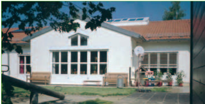
Kindergarten Arche Noah