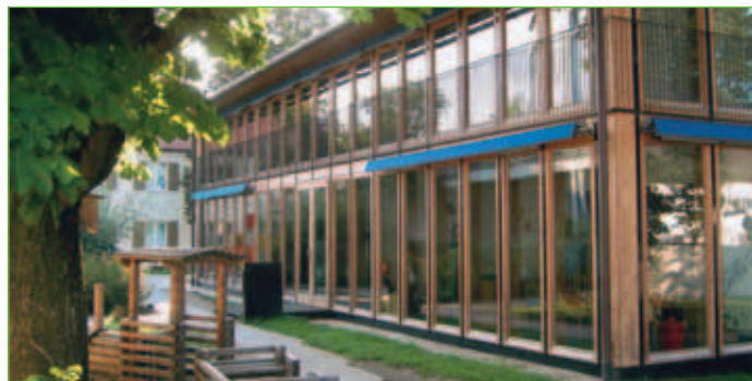
Kindergarten St. Michael