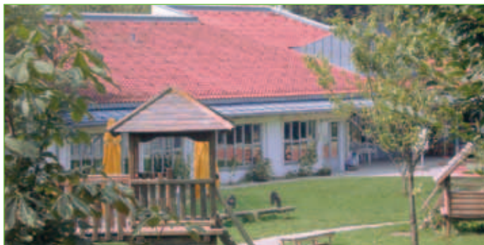
Kindergarten Im Wiesengrund