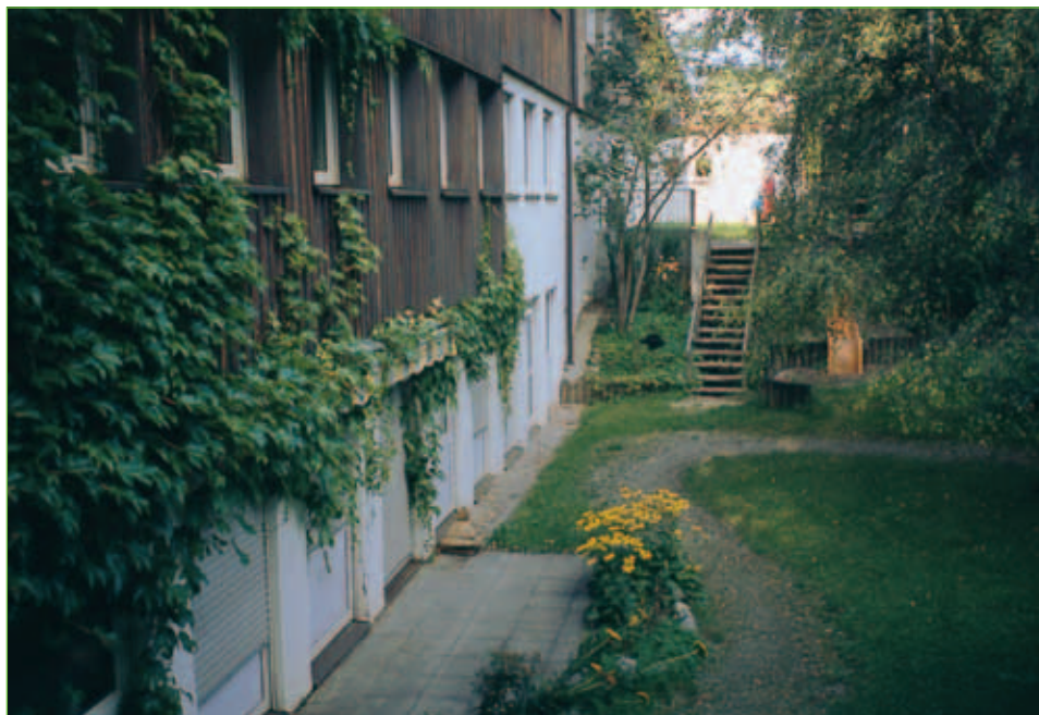
Kindergarten und Kinderhort St. Ulrich

Öffnungszeiten: Mo. – Do. 07.00 – 16.15 Uhr Fr. 07.00 – 14.15 Uhr