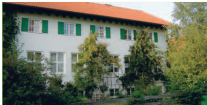
Kindergarten der Freien Waldorfschule