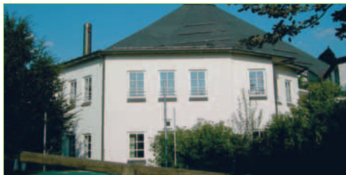
Kindergarten St. Hedwig

Name: Kindergarten St. Hedwig Adresse: Drosselweg 1a 87439 Kempten (Allgäu) Telefon: 0831/5126820 Fax: 0831/5126819 E-Mail: kiga.st.hedwig.kempten@ bistum-augsburg.de Internet: www.st-hedwig-kempten.de Träger/in: Kath. Stadtpfarrkirchenstiftung St. Hedwig Öffnungszeiten: Mo. – Do. 07.00 – 16.30 Uhr Fr. 07.00 – 14.00 Uhr