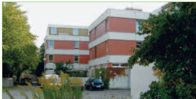
Kinder- und Jugendhort Gerhardinger Haus