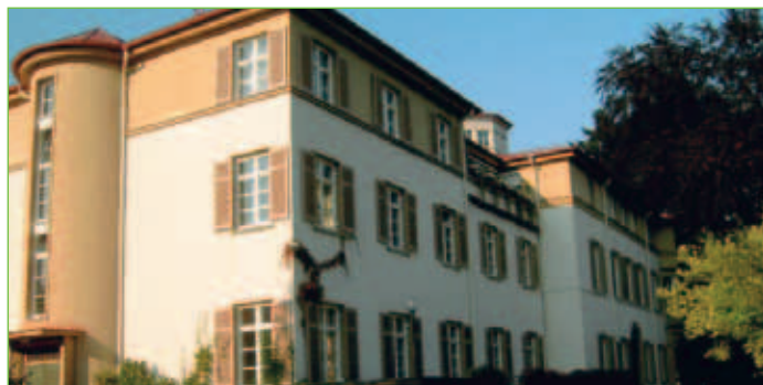
Kindertagesstätte Haus für Kinder und Eltern

Name: Kindertagesstätte Haus für Kinder und Eltern (Krippe, Kindergarten und Hort) Adresse: Lindauer Straße 20 87439 Kempten (Allgäu) Telefon: 0831/10332 Fax: 0831/5405919 über Diakonie Kempten E-Mail: hke@diakonie-kempten.de Internet: www.diakonie-kempten.de Träger/in: Diakonisches Werk/Johannisverein Kempten e.V. Öffnungszeiten: Mo. – Do. 07.00 – 17.00 Uhr Fr. 07.00 – 16.30 Uhr