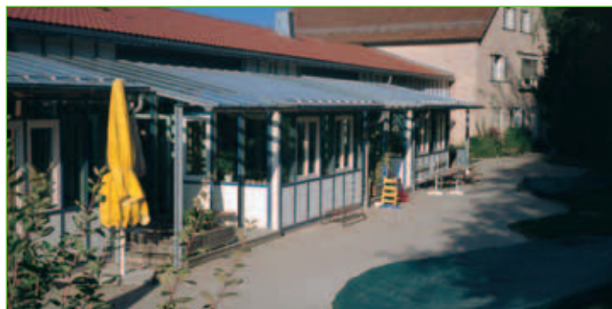
Kindergarten St. Anton