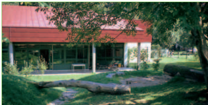
Kindergarten St. Hildegard