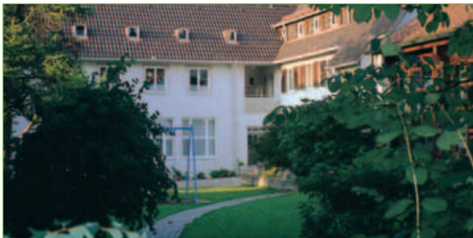
Kinderhort St. Elisabeth