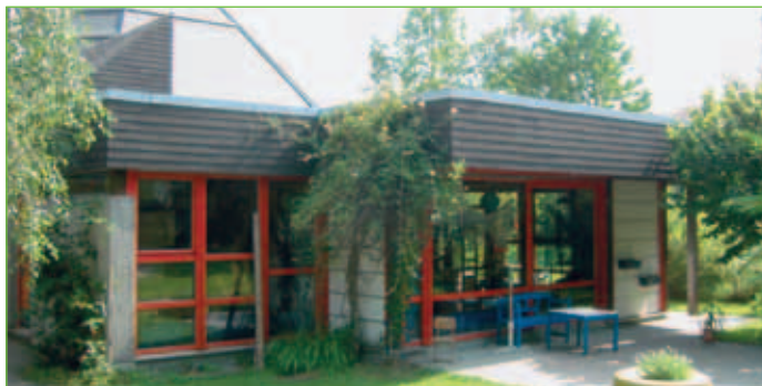
Kindergarten St. Franziskus