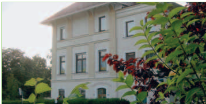
Kindergarten St. Anna