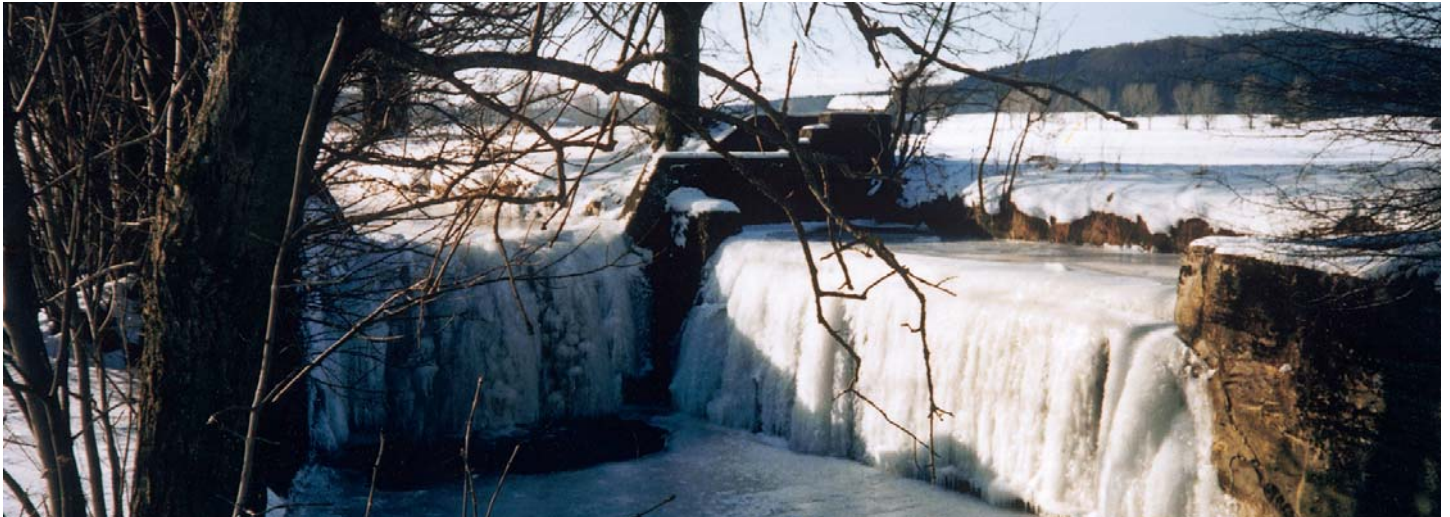
Winterstimmung an der Mindel

Heute erfüllt der Markt alle Voraussetzungen für ein lebendiges, gut strukturiertes Kleinzentrum, in dem alle wichtigen und notwendigen Einrichtungen vorhanden sind.