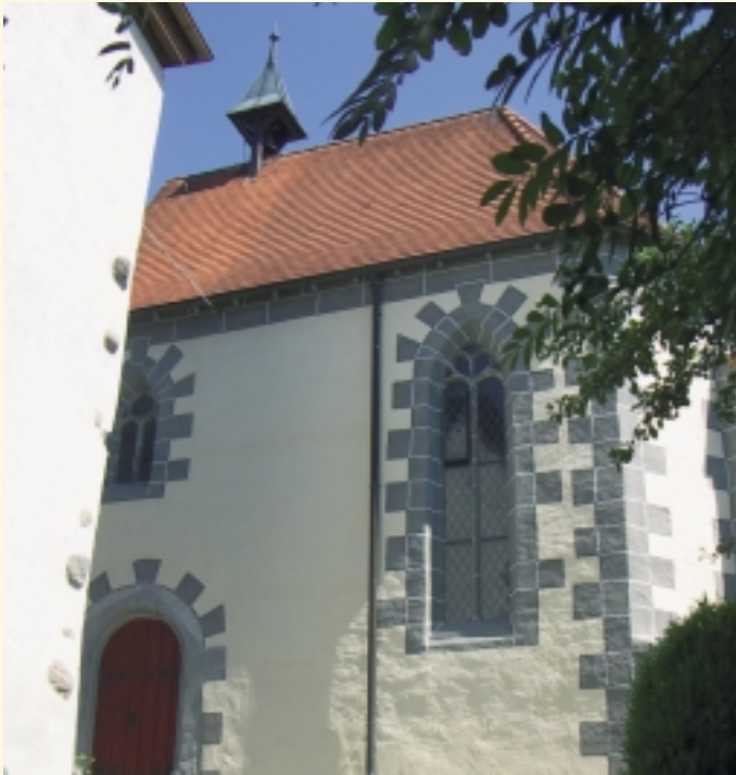
Schlosskapelle St. Agatha in Efrizweiler

Geschichtspfad und Bodenseepfad werden in den neuen Ortsrundweg Kluftern integriert sein. Die Ortschaft Kluftern soll mit diesem Weg in der Form einer „großen Acht“ um eine besondere Attraktion reicher werden. Die vielfältigen Funktionen dieses Ortsrundweges werden seinen besonderen Reiz ausmachen.