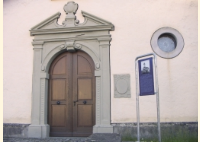
Portal der Pfarrkirche St. Gangolf

Zu den gekennzeichneten Objekten gehören: die Katholische Kirche St. Gangolf , das Schloss Efrizweiler (10. Jahrhundert) - heute geführt als Hotelbetrieb – mit spätgotischer Kapelle St. Agatha , der Bahnhof Klufftern (1901 hielt dort der erste Zug), das Bauerhaus Schmid in Lipbach (ein linzgautypisches Einhaus von 1907 mit Wohntrakt) und die Kapelle St. Laurentius in Lipbach.