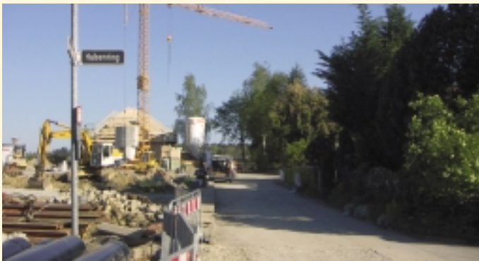
Baugebiet „Auf dem Huben II“

Aktuell entsteht ein weiteres Baugebiet für Einzel- und Doppelhäuser. Auch in den kommenden Jahren soll die bauliche Entwicklung fortgesetzt werden.