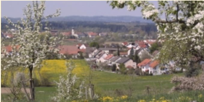
Wohngebiet mit Umgebung

Das Bild der Ortschaft wird geprägt durch Neuansiedlungen.