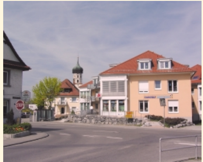
Ortsmitte mit Apotheke und Pfarrkirche

Im Mühlöschle 2 88677 Markdorf Tel. 0 75 44/95 59-0