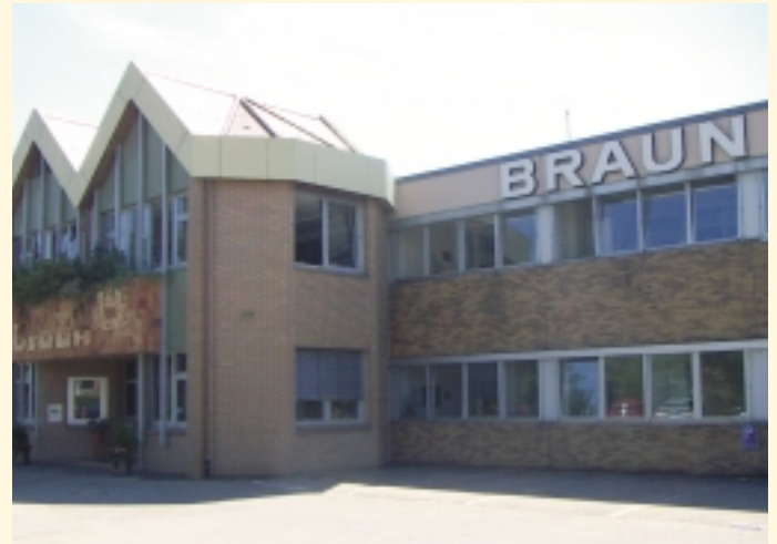
Firma Ziegelmundstückbau Braun GmbH

Am Bahnhof Kluftern wurde ein Gewerbegebiet geschaffen. Die verfügbare Gesamtgewerbefläche beträgt ca. 7.700 m 2 . Haben Sie Interesse sich mit Ihrem Unternehmen dort anzusiedeln? Wenden Sie sich doch einfach an die Ortsverwaltung Kluftern. Sie steht Ihnen für nähere Auskünfte gerne zur Verfügung.