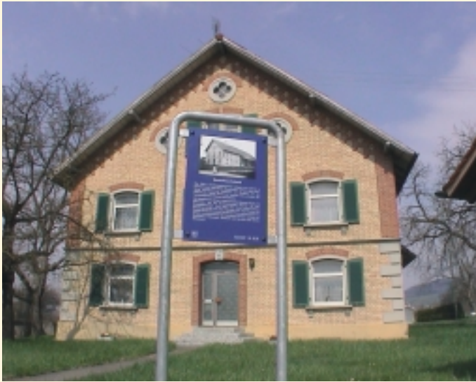
Bauernhaus Schmid mit Geschichtspfad-Tafel

Die Ortschaft Klufftern wurde in das städtische Konzept der einheitlichen Kennzeichnung geschichtlich relevanter Bauwerke einbezogen. Deshalb sind historisch interessante Gebäude seit dem 5. April 2005 mit blauen „Geschichtspfad-Tafeln“ beschildert.