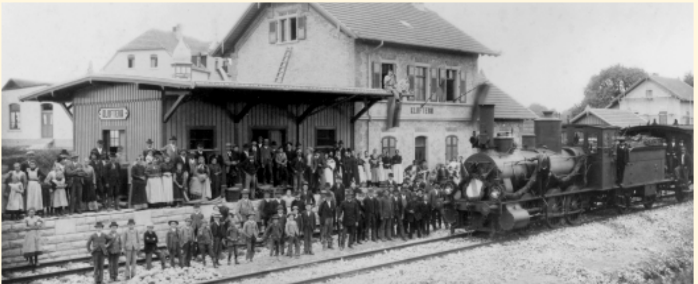
Bahnhof Kluftern – Erster Zug 1901