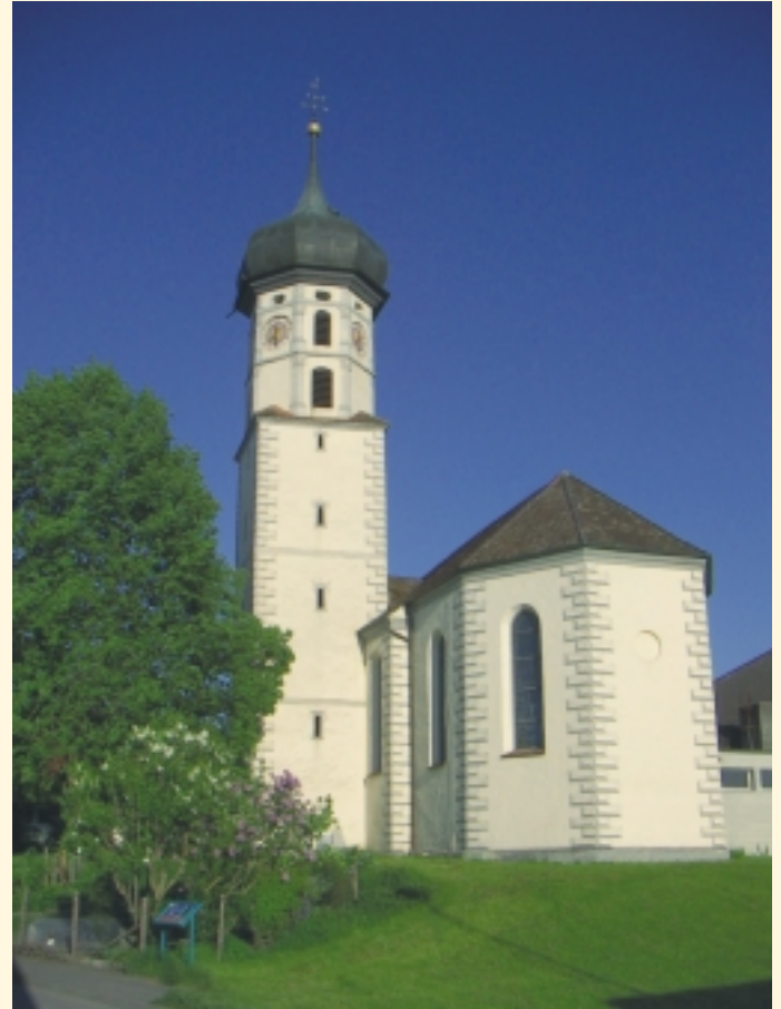
Pfarrkirche St. Gangolf