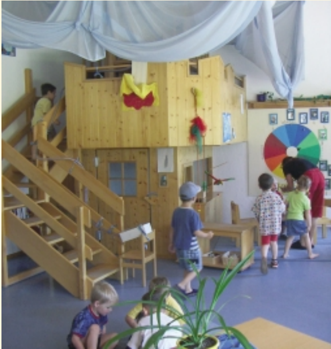
Kindergärten in Kluftern und Efrizweiler

Zwei Kindergärten und eine Grundschule sowie die Nähe zu den weiterführenden Bildungseinrichtungen der Stadt Friedrichshafen und des Bodenseekreises in Markdorf runden die Ortschaft als attraktiven Wohnort besonders auch für junge Familien ab. Diverse Spielplätze, eine Skateanlage und ein betreuter Jugendtreff stehen im Ort ebenfalls zur Verfügung.