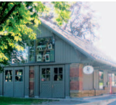
AllerArt Kunst und Werk