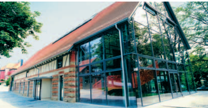
Sennhof am Schloss