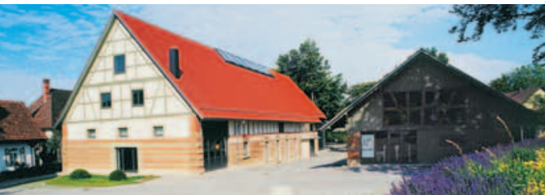
Sennhof am Schloss