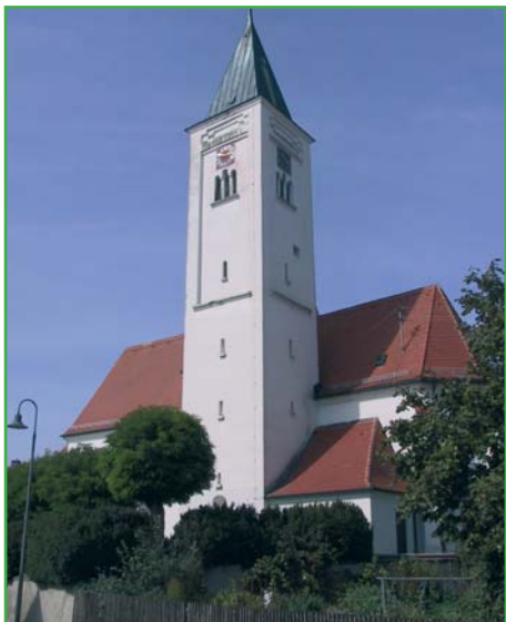
Kirche Maria Immaculata, Oberwaldbach