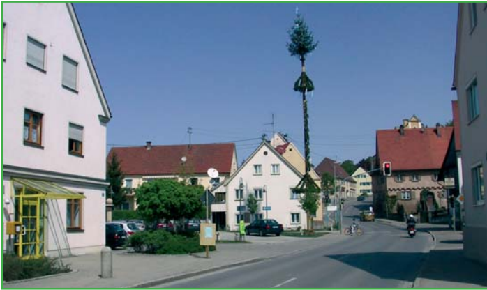
Hauptstraße in Burtenbach