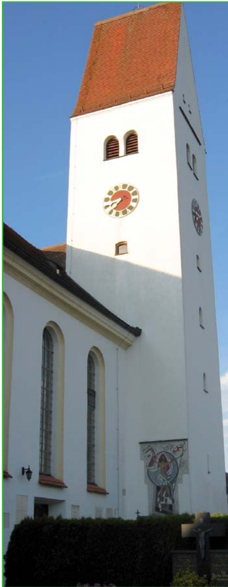
St. Georg-Kirche Kemnat