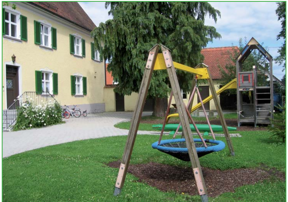
Kindergarten „St. Georg“ Kemnat