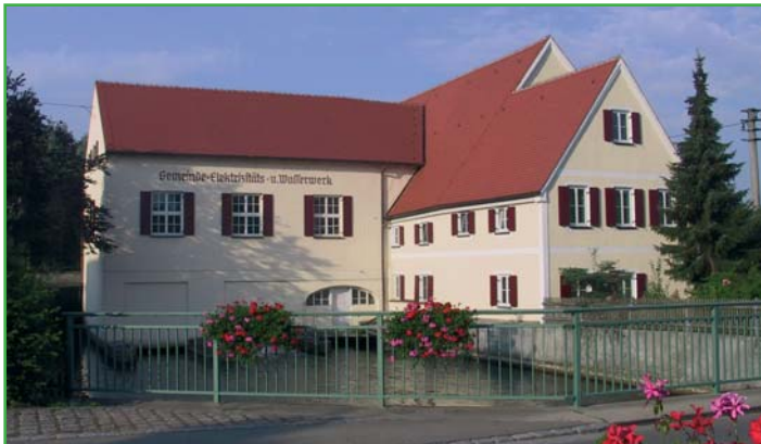
Gemeinde Elektrizitäts- und Wasserwerk, Burtenbach