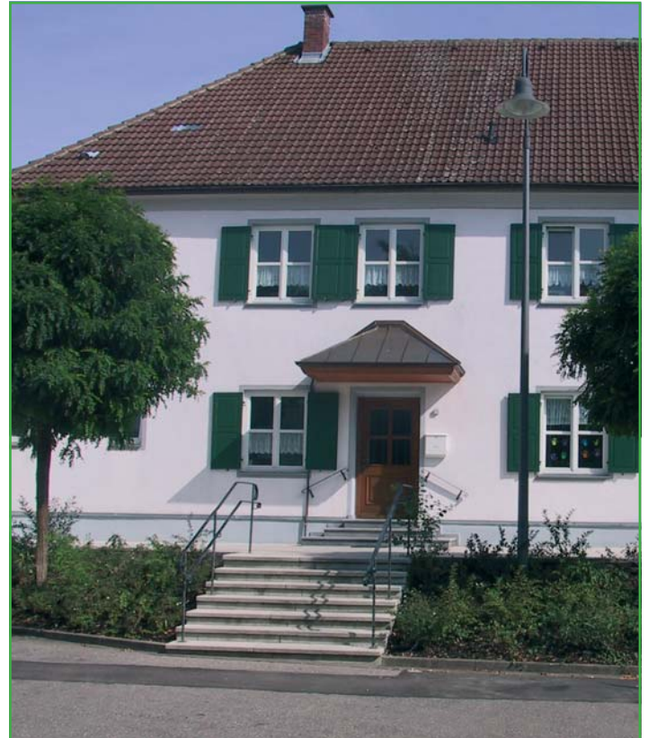
Vereinsheim und Kindergarten St. Anna, Oberwaldbach