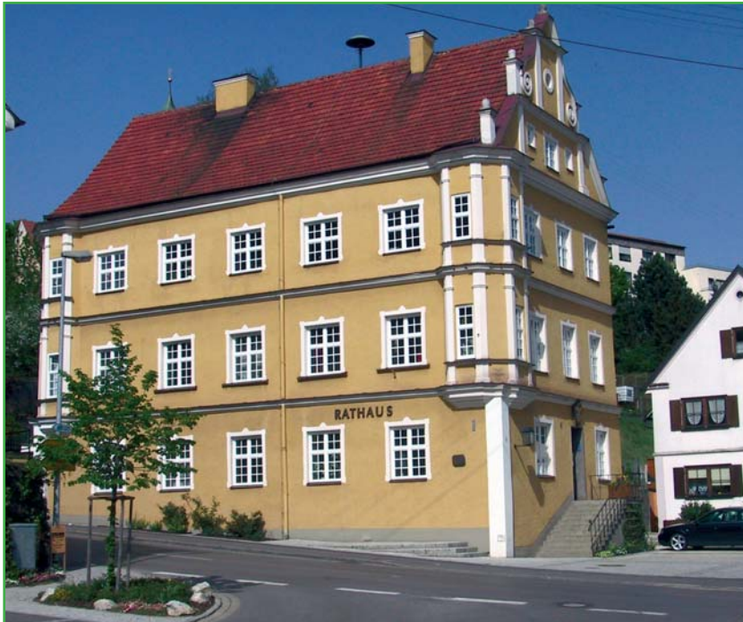
Rathaus in Burtenbach