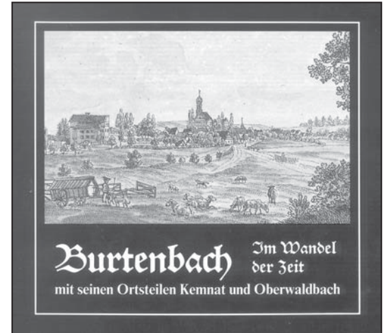
Burtenbach im Wandel der Zeit mit seinen Ortsteilen Kennat und Oberwaldbach 15.–€