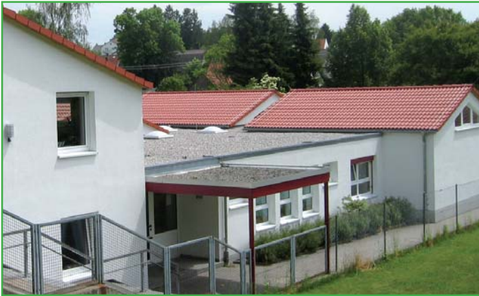
Kindergarten „Guter Hirte“ Burtenbach