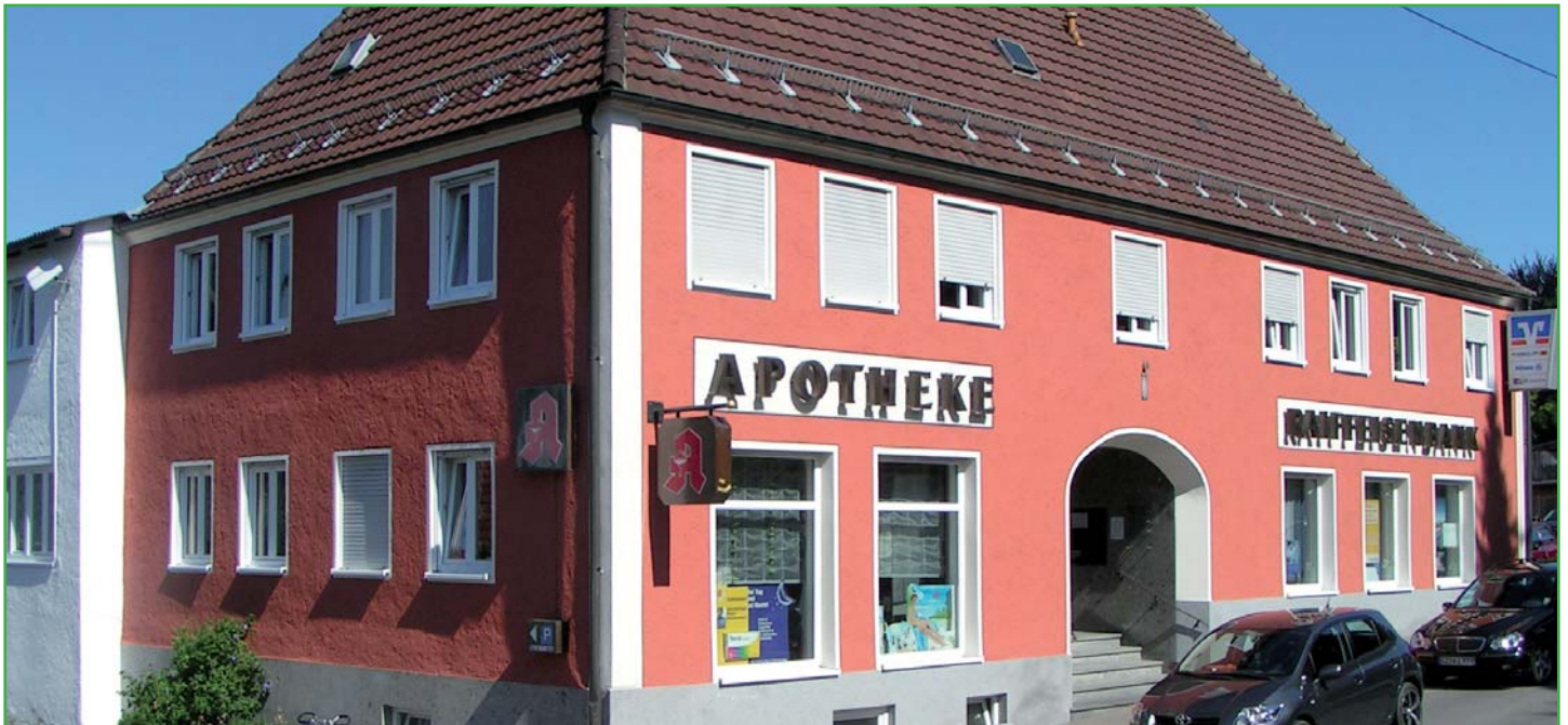
Apotheke, Zahnarzt und Raiffeisenbank