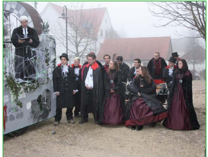
Segnung des Faschingswagens