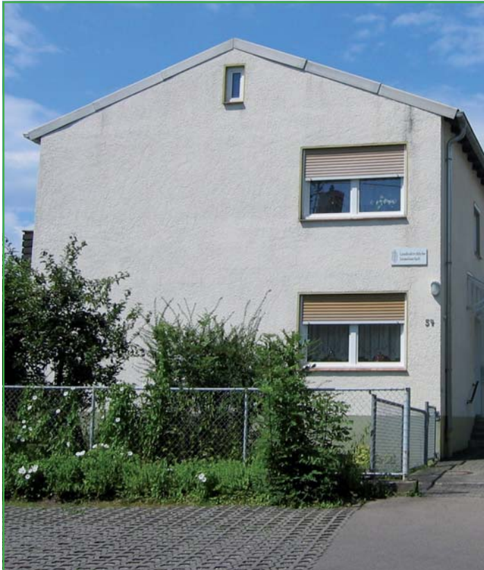
Landeskirchliche Gemeinschaft Burtenbach