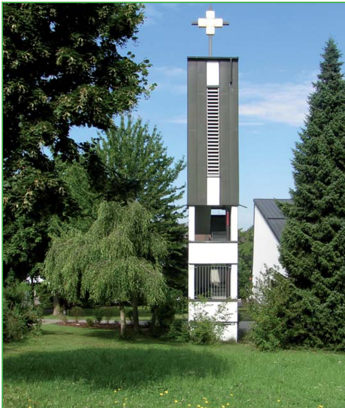
St. Franziskus-Kirche Burtenbach