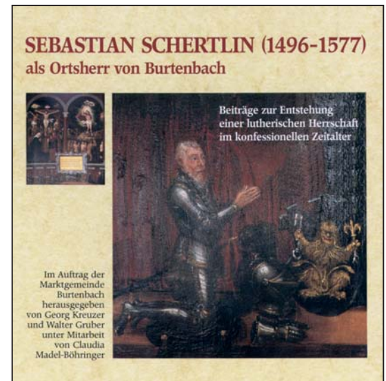
Sebastian Schertlin (1496-1577) als Ortsherr von Burtenbach 9.–€