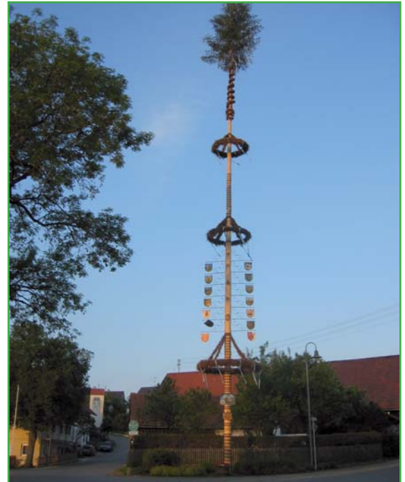
Maibaum in Oberwaldbach