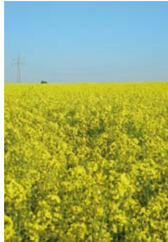
Rapsfeld bei Heuchlingen