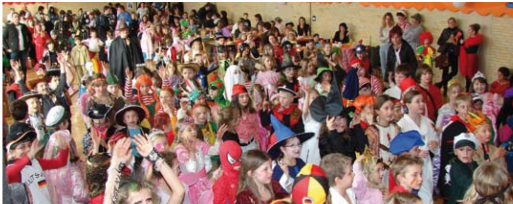
Gerstetten – Kinderfasching