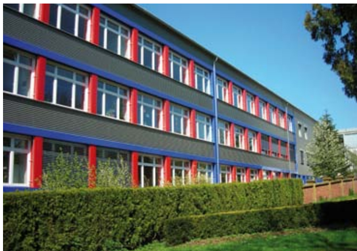
Gerstetten - Grund-, Haupt- und Förderschule sowie ab Herbst 2010 Werkrealschule