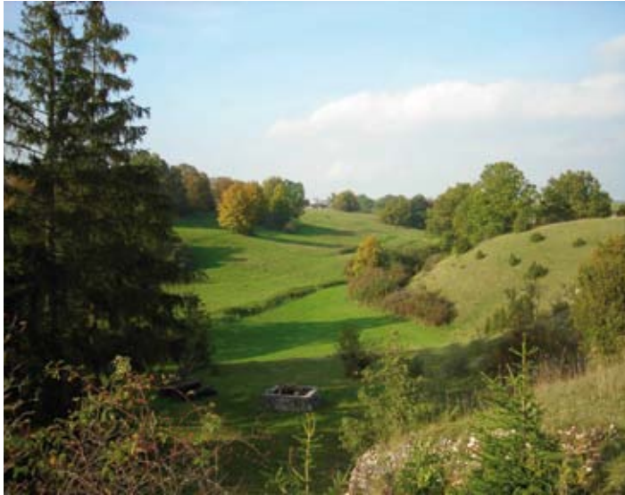
Heuchlingen – Grillstelle Hartberg