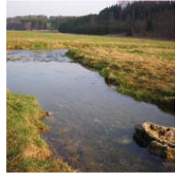
Heldenfingen – Hungerbrunnen