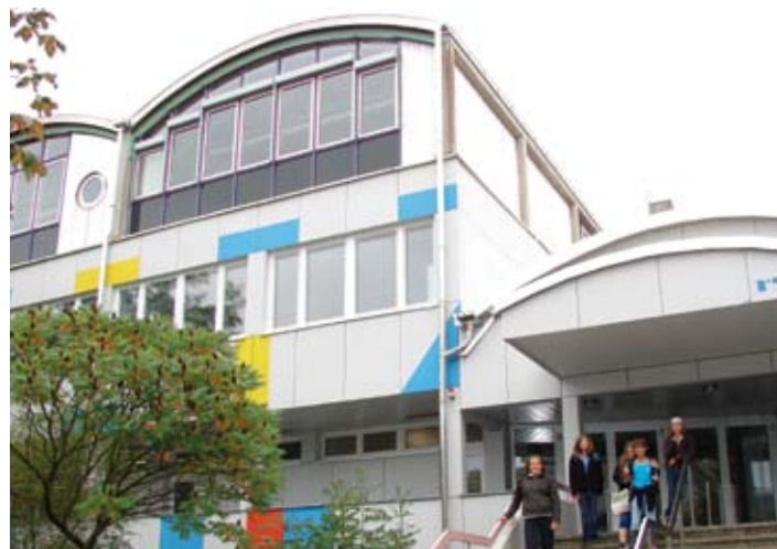
Gerstetten - Realschule