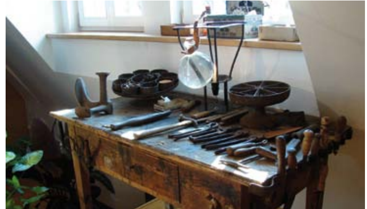
Gussenstadt - Schusterwerkstatt im Ursulastift

Lass Deinen Körper spüren, was er Dir wert ist!