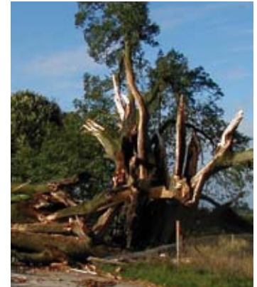
Dettingen – Anhauser Linde nach Sturm

Vom 35 m hohen Gerstetter Wasserturm bietet sich dem Besucher bei klarem Wetter ein herrlicher Rundblick über die Albhochfläche bis hin zu dem in rund 150 km entfernten Alpenkamm.