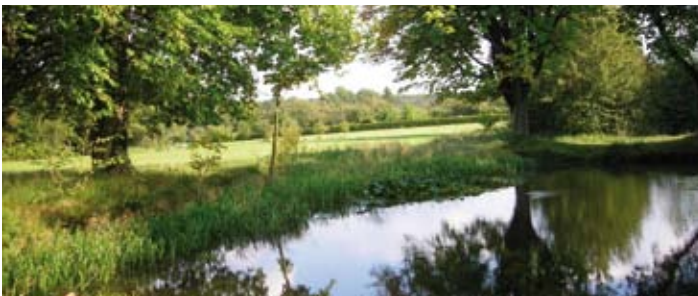
Gerstetten – Eglensee

„Gerstetten hat's“ könnte auch das Motto sein, wenn es um die örtlichen Bildungseinrichtungen geht: Grund-