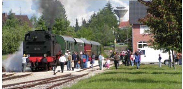
Dampfzugfahrt