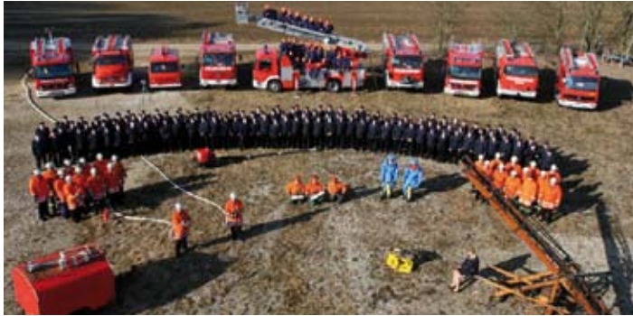
Die Feuerwehrabteilungen von Gerstetten