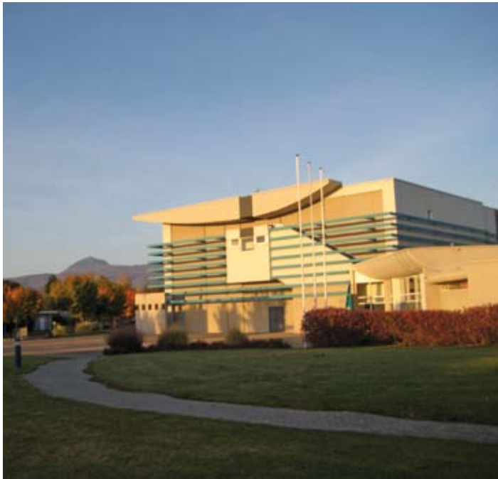
Cébazat – Sémaphore