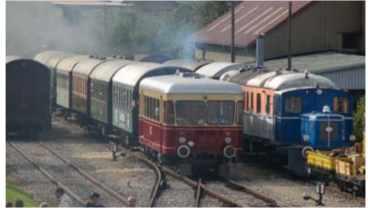
Gerstetten – Eisenbahn

680 – 624 – 596 - 577 - 564 sind solche Zahlen. Zahlen, die so manchem Einheimischen bekannt sein dürften. 680 m über dem Meeresspiegel ist der Teilort Gussenstadt gelegen, 624 m