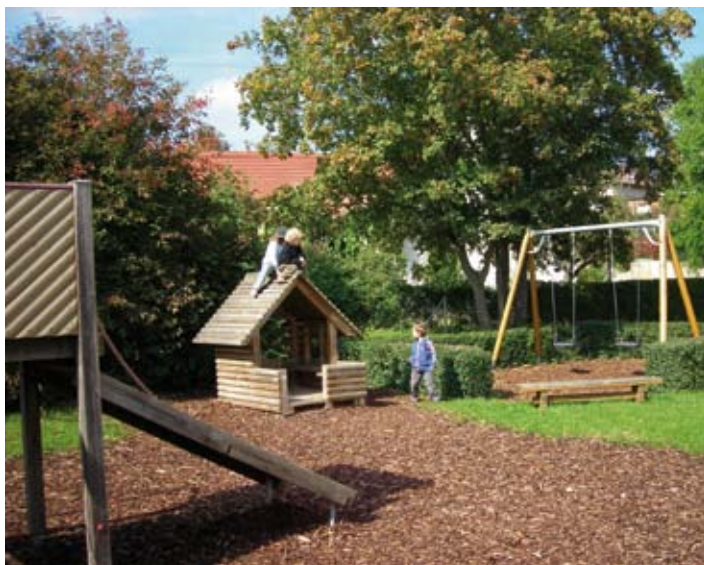
Heldenfingen – Kindergarten

Unter dem Link www.bw-kita.de kommen Sie direkt auf ein Internetportal, über welches Sie sich über sämtliche Kindergärten der Gemeinde und des Landkreises Heidenheim informieren können.