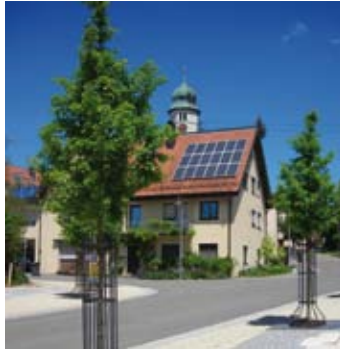
Dettingen – Dorfmitte