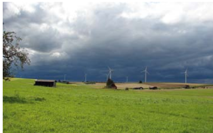
Windräder bei Gussenstadt

Gussenstadt und Sontbergen werden versorgt durch Alb-Werk GmbH & Co. KG Eybstraße 98-100, 73312 Geislingen Tel. 07331 209-0