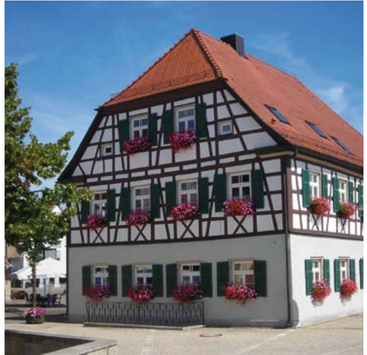
Altes Rathaus/Sitz der Musikschule

Rathaus Gerstetten Wilhelmstraße 31 89547 Gerstetten Tel.: 07323 84-0 Fax: 07323 84-18 E-Mail: rathaus@gerstetten.de Internet: www.gerstetten.de