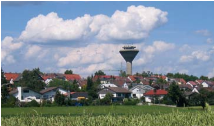
Gerstetten – Wasserturm

Viele Wanderer kommen zum Falkenstein wegen des beeindruckenden Blicks hinunter ins Eselsburger Tal – von der einst „geschleiften“ Burg sehen sie aber nichts mehr. Während des Dreißigjährigen Krieges, nach der Schlacht bei Nördlingen 1634, wurde die Hauptburg zerstört. Nur noch wenige Mauerreste erinnern an die stolze Burg auf schmalem Felsgrad. Von 1918 bis 1985 gehörte Falkenstein dem Land Württemberg – heute befindet sie sich im Privateigentum.