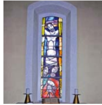
Sontbergen – Kirchenfenster von Sieger Köder