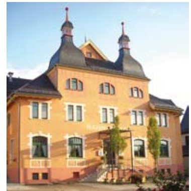
Gerstetten – Bahnhotel mit Sitz der Volks-Hochschule und Geschäftsstelle des VfL

schulen in allen Ortsteilen, Haupt-, Förder- und Realschule im Hauptort, eine ab Herbst 2010 geplante Werkrealschule, Nachmittagsbetreuung, Kleinkindbetreuung, Musikschule und Volkshochschule machen deutlich: Gerstetten legt auf ein generationenübergreifendes Bildungsangebot allerhöchsten Wert.