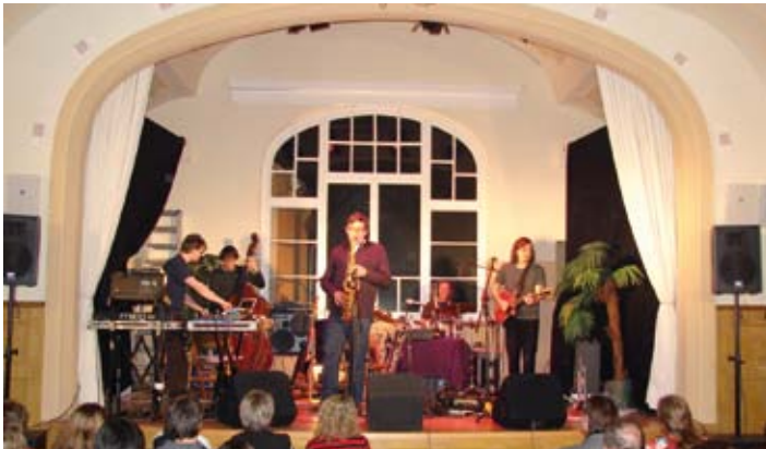
Gerstetten - Kultur im Stucksaal des Bahnhotels