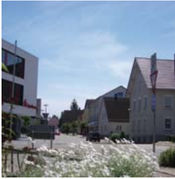
Gerstetten – Böhmenstraße