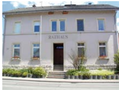
oben links: Rathaus Gussenstadt