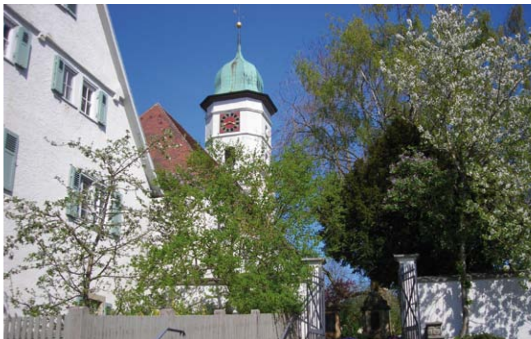
Gerstetten – Michaelskirche im Frühjahr

Räume der evang. Kirchengemeinde Heuchlingen in der Gemeindehalle Flügelstraße 9/1