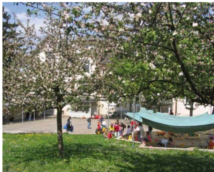
Gerstetten – Kindergarten