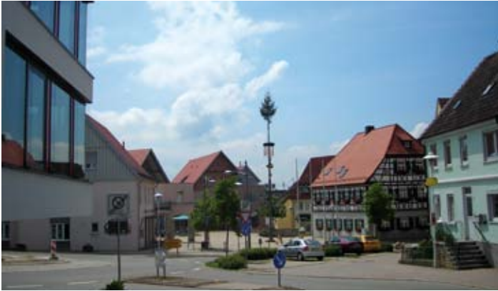
Gerstetten – Marktplatz

Gerstetten, das sind Wasserturm und Michaelskirche, Wälder und Trockentäler, Silberdisteln, Schafherden und Schlehenhecken; das sind Kliff, Kickethau und Falkenstein, Hungerbrunnen und Eglensee; der würzige Duft der Wacholderheiden, das Pfeifen des Dampfzügles oder das Rauschen der Wettertannen. Gerstetten, das sind vor allem aber auch die Menschen, die hier leben, die sich hier wohl- und mit ihrem Ort verbunden fühlen.