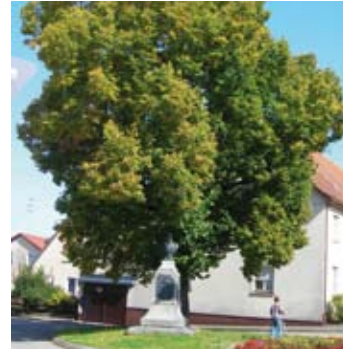
Gussenstadt – Kaiser Wilhelm Denkmal