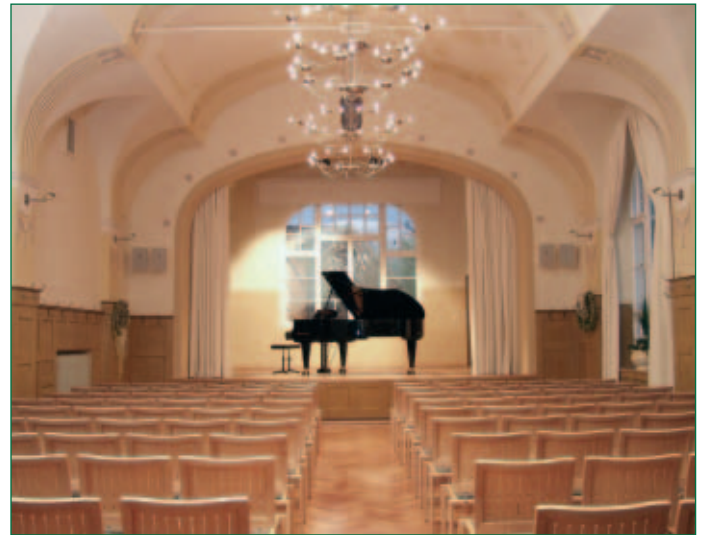
Stucksaal im Bahnhotel

Im neu renovierten Jugendstilsaal des Bahnhotels, das sich im Eigentum der Gemeinde befindet, werden in regelmässigen Abständen Konzerte und Kleinkunstveranstaltungen abgehalten. Zwischenzeitlich hat der vor Jahren angeschaffte Bösendorfer Flügel seinen festen Platz auf der Bühne des Stucksaals, und renommierte Künstler nutzen die Gelegenheit, dort zu konzertieren.