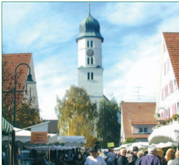
Kirchweihmarkt in Dettingen