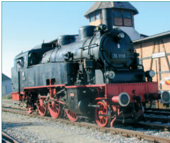
Mit der Lokalbahn auf die Gerstetter Alb