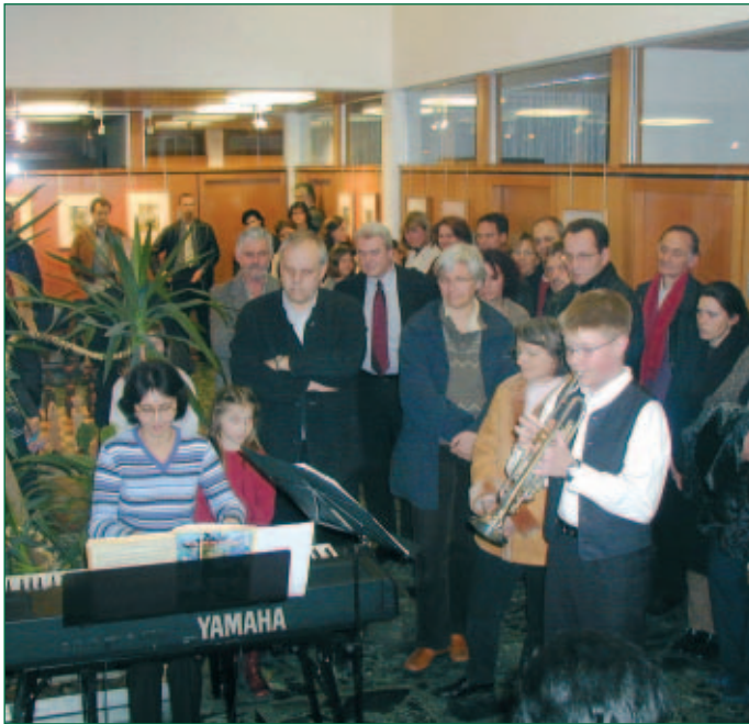
Ausstellungseröffnung im Rathaus

Mehrmals jährlich finden im Rathaus Ausstellungen von Malern, Fotografen oder Hobbykünstlern statt.