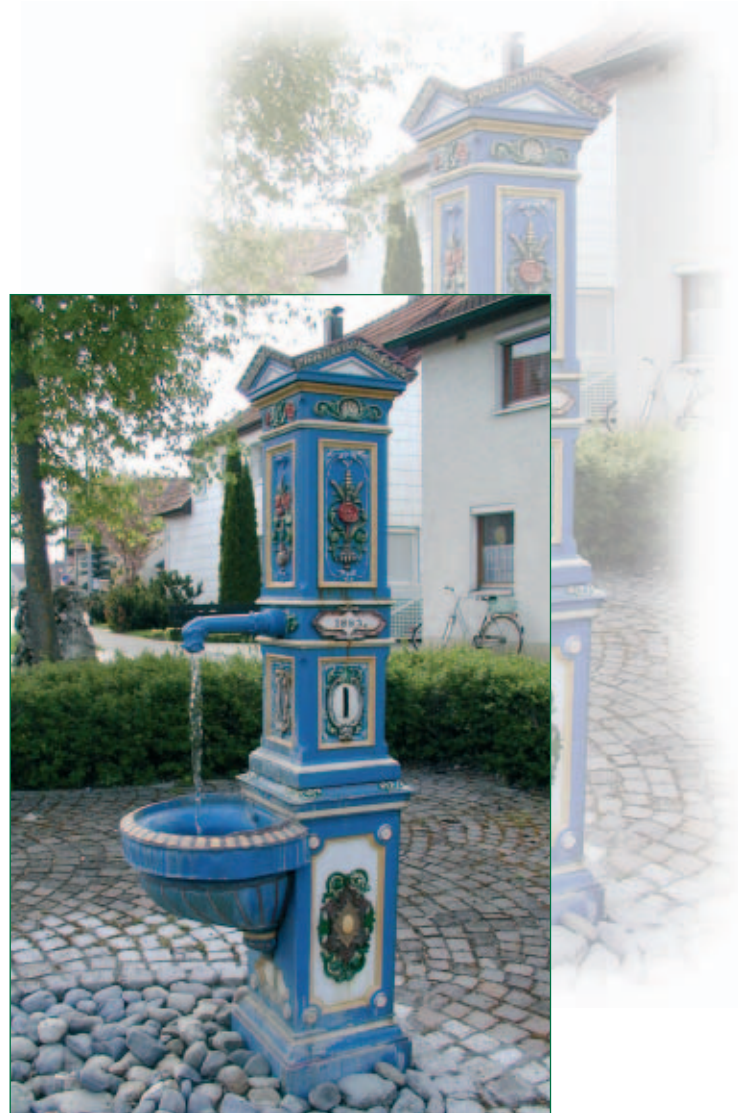
Lindles-Brunnen in Heuchlingen

Sauerplätze 1 89547 Heuchlingen Telefon 0 73 24 - 89 95 Telefax 0 73 24 - 98 21 59