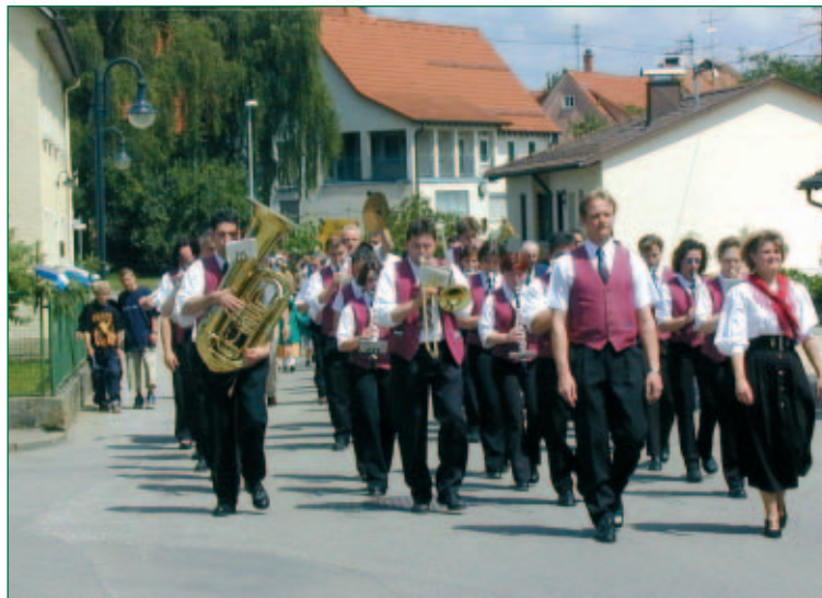
Festzug in Heldenfingen