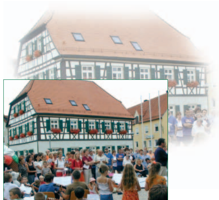
Altes Rathaus / Musikschule