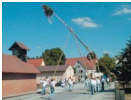
Kirchweih in Volkersgau