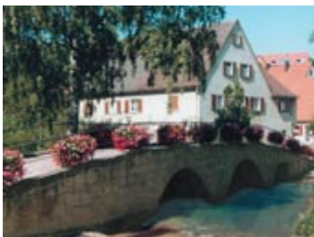
Aurachbrücke in Barthelmesaurach