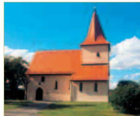
St. Georg Kirche im Ortsteil Poppendorf

Nach einer Abhandlung von Dr. Hermann Födisch „Aus der Vorgeschichte des Forchheimer Umlandes“, die im von Herrn Kaupert herausgegebenen Buch „Forchheimer Heimat“ veröffentlicht ist, war schon in der Urnenfelderzeit (etwa 1200 bis 800 vor Christi) hier eine dichte Besiedlung vorhanden. Davon zeugen die aus dieser Zeit stammenden kunstvollen Bronzen und auch verzierte Keramik und vor allem die Hügelgräber, die außer bei vielen anderen Orten des Kreises auch bei Oesdorf gefunden wurden.