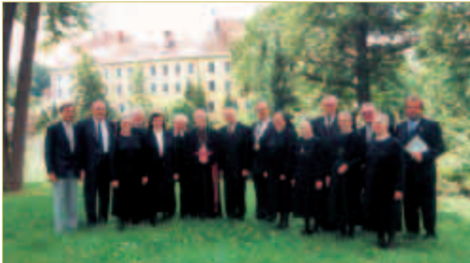
Hohe Geistlichkeit beim 100-jährigen Kirchenjubiläum St. Michael 1997