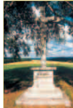
Materl am Weinberg