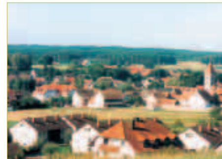
Blick vom Ortskern

Kirche konnten bei Freilegung der Grundmauern unter denselben an 2 Stellen größere Blocksteinquader eingesehen werden.