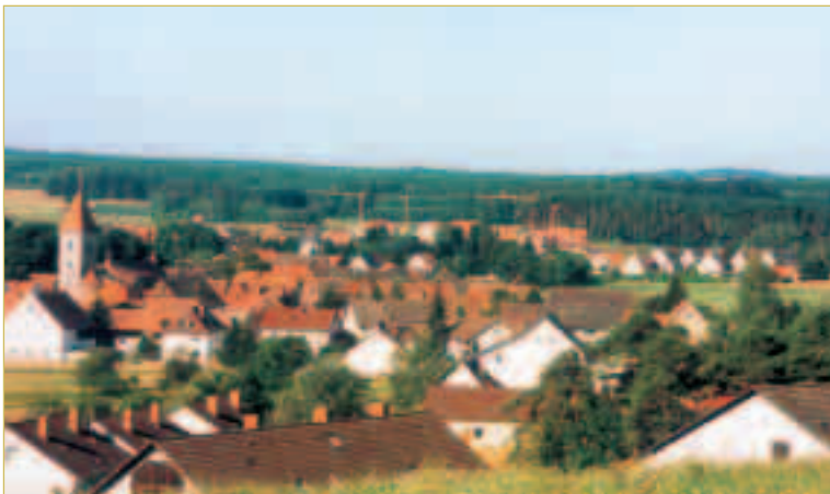
Heroldsbach Ortskern – Blick vom Weinberg