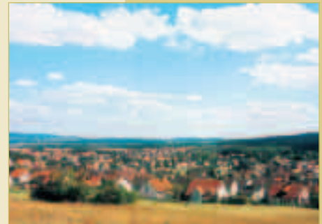
Blick von der Altenburg auf den Ortsteil Thurn