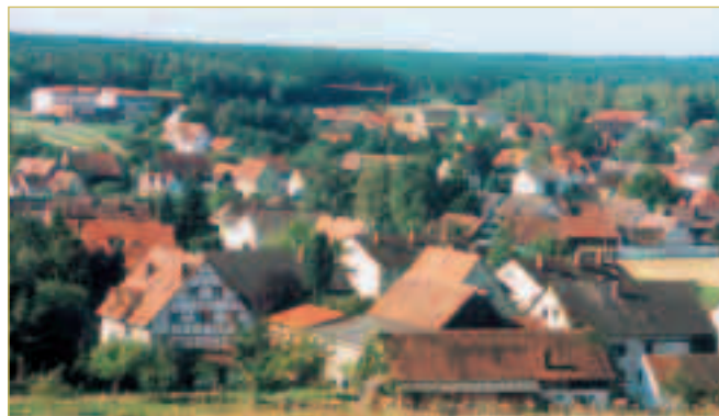
Ortskern – Blick vom Weinberg