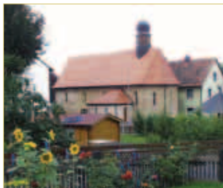
St. Veit Kirche im Ortsteil Oesdorf

Zur wirtschaftlichen Sicherung des Königshofes sind weitere ländliche Siedlungen in der Umgebung gegründet worden, zu denen sicherlich auch das heutige Oesdorf gehören dürfte. Symptomatisch für derartige Siedlungen war ihre Bezeichnung, weil sie in der Regel immer nach dem Namen des Gründers benannt wurden (Dorf des Odi oder Oti).