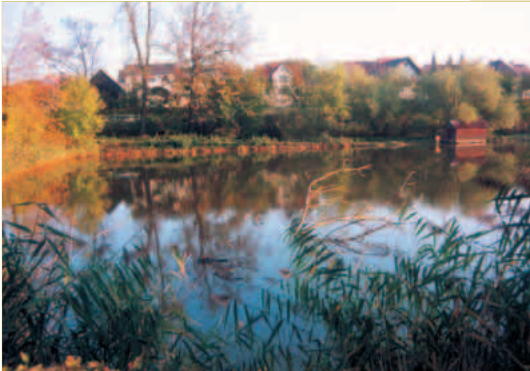
Der Weier „Winterring“ (Karpfenweiher) mit Fischhäuschen

Angeschlossen am Naherholungsbereich Erlangen. Besuch von Sehenswürdigkeiten in der Fränkischen Schweiz, wie Höhlen, Schlösser, Burgen, Ruinen und Museen, per Auto oder durch öffentliche Busverbindungen.