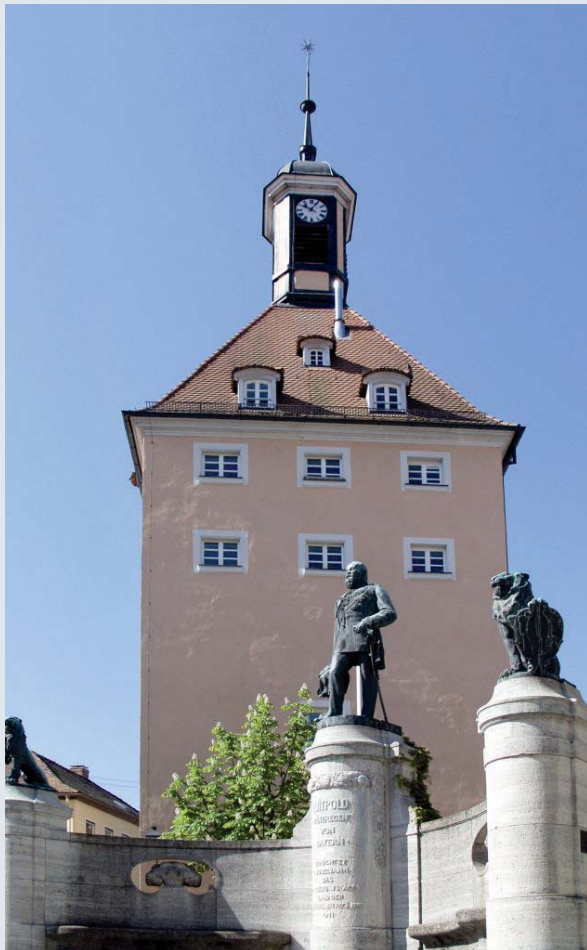
Katharinenturm mit Luitpold-Denkmal