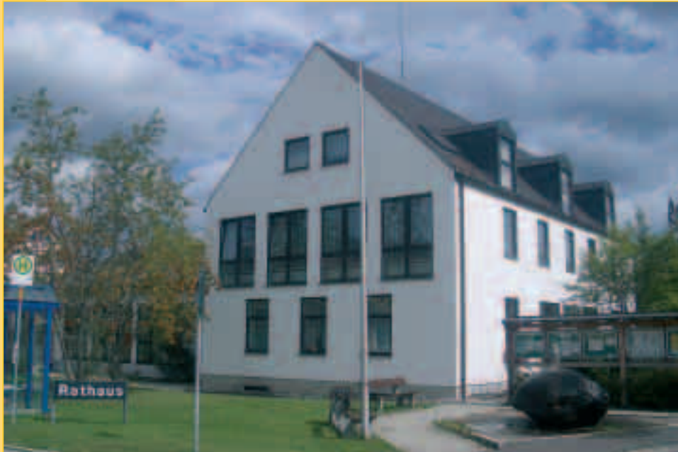
Rathaus Neukirchen – Sitz der Verwaltungsgemeinschaft

Landkreis Amberg-Sulzbach, Regierungsbezirk Oberpfalz, Bayern