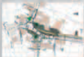
Ausbau Knotenpunkt BT 30/ BT 32 in Weidenburg