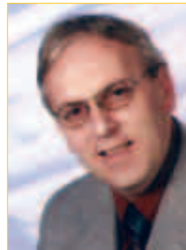
Winfried Franz 1. Bürgermeister Gemeinde Neukirchen b. Sulzbach-Rosenberg