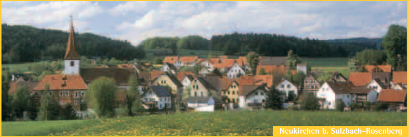
Neukirchen b. Sulzbach-Rosenberg