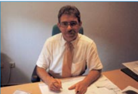
Bücherl 1. Bürgermeister