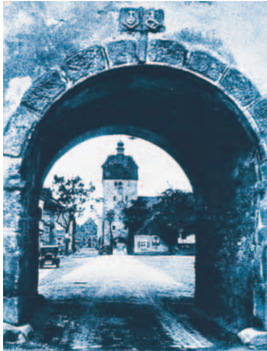
Vogelturm vom Hafnertor

Die Stadtbefestigung geht zurück ins Jahr 1332. Damals erhielten die Bürger Vilsecks vom Bischof von Bamberg den Auftrag, den Ort mit einer Mau-