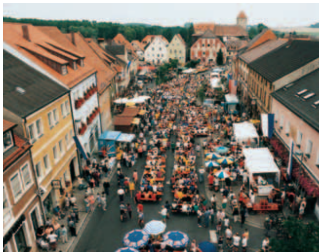
Brunnenfest auf dem Marktplatz

Pfarrbücherei Vilseck (geöffnet: sonntags von 9.30 - 11.15 sowie mittwochs von 15.30 - 17.30 Uhr) Klostergasse 9 225 Pfarrbücherei Sorghof (geöffnet: sonntags nach dem Gottesdienst, dienstags und samstags jeweils von 16.00 - 16.30 Uhr) Sorghof, Kürmreuther Straße 22