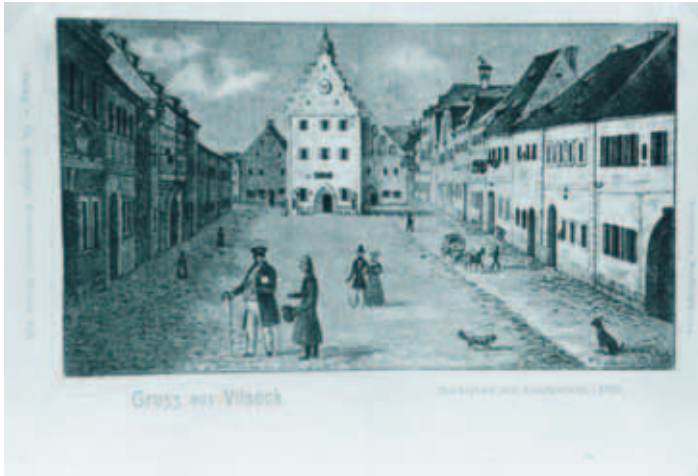
Historische Postkarte um 1850

Baugruppen der Altstadt werden mit viel Einfühlungsvermögen erhalten und gepflegt, damit das aus alter Zeit hergebrachte, anheimelnde Ortsbild nicht ausdruckslos und heimatfremd wird. Vilseck möchte seinen Charakter als typische oberpfälzische Kleinstadt bewahren.