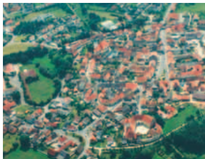
Vilseck aus der Luft