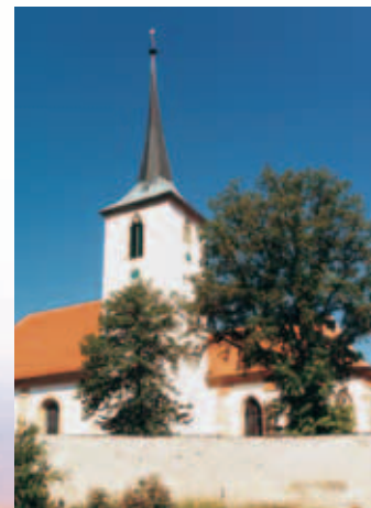
Pfarrkirche St. Ägidius