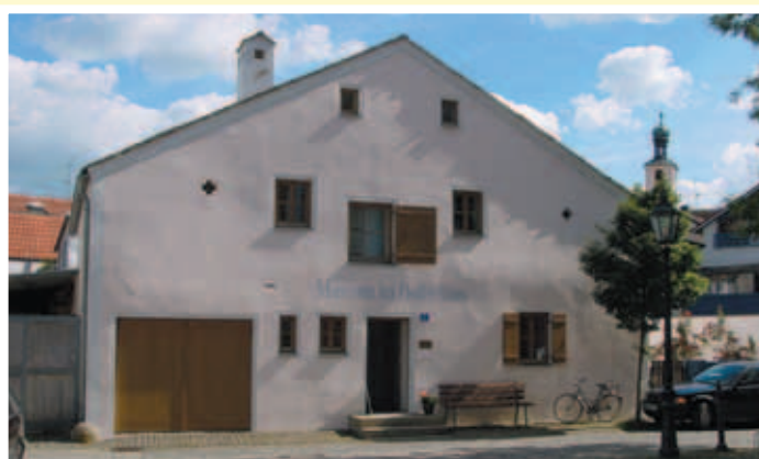
Museum im Hollerhaus