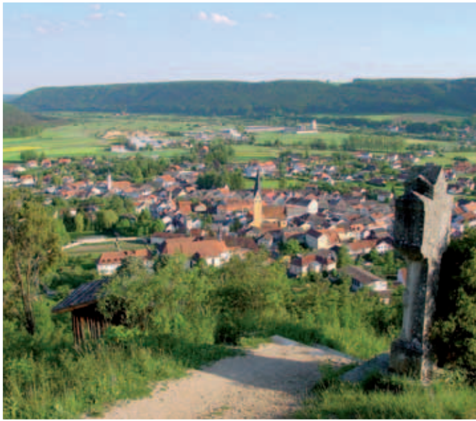
Blick vom Kreuzberg