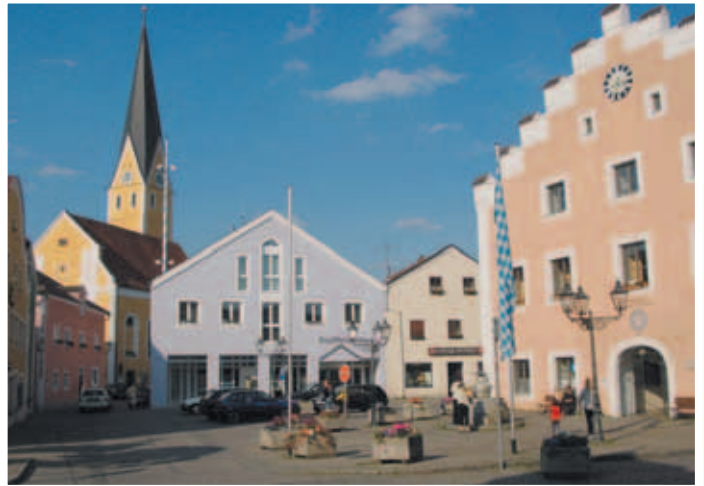
Rathausplatz mit Stadtpfarrkirche