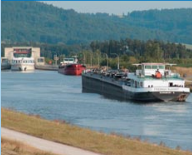
■ Schleuse Bachhausen am Rhein-Main-Donau-Kanal

Am 01.04.1540 verlieh Kaiser Karl V. dem Ort Sulzbürg die Marktgerechtigkeit und am 06.06.1544 das Wappen. Es stellte einen grünen Dreieck auf rotem Grund dar (Sulzbürg liegt auf drei sogenannten "Zeugenbergen"), darüber in einer silbernen Schüssel, Fische in Sülze. Das Wappen ging zusammen mit dem Titel Markt durch die Gebietsreform in den siebziger Jahren unter. Das neue Wappen wurde der Gemeinde 1977 verliehen.