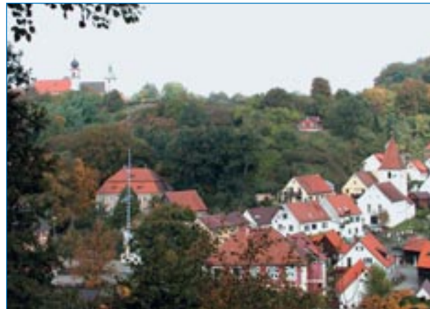
■ Ortsteil Sulzbürg mit den Kirchen am Schlossberg im Hintergrund

Von da an wurde das "Landl" von Pflegern des Kurfürsten Karl Albrecht verwaltet; so wurden dann Katholiken in den ursprünglich rein protestantischen "Landl" ansässig. Das "Landl" blieb konfessionell jedoch geschlossen ein evangelisches Gebiet. Es wird deshalb heute als die Urzeile des evangelischen Dekanats in Bayern bezeichnet. Die Bewohner des "Landls" widersetzten sich allen Versuchen, sie zu rekatholisieren. Nach Berichten aus der damaligen Zeit sollen die Landlbewohner,