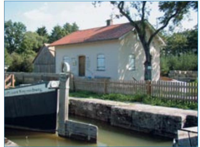
■ Schleusenhaus 25 am Ludwigskanal

Im Übrigen besaßen die Sulzbürger und später auch die Wolfsteiner in Wappersdorf sehr lange Zeit eine Reihe von Höfen und sog. Mannschaften; zur Zeit des Aussterbens der Herren von Wolfstein waren es neun. Über der Ortschaft Wappersdorf befand sich eine kleine Veste, die im Besitz der Herren von Wepretsdorf (Wappersdorf) war. Der Maler-Pfarrer Christian Simon Kaepfel von Sulzbürg hat um 1830 von den Resten dieser Anlage eine Zeichnung angefertigt. Er nannte das skizzenhafte Bild "Schweppermannsweige". Es ist jedoch geschichtlich