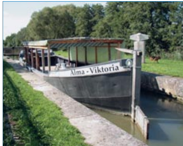
■ Treidelschiff Alma Viktoria

Der Ort selber liegt 13 km nordwestlich von Vicenza. Durch das Gemeindegebiet fließen zwei Gewässer, nämlich der Torrente Giarà Orolo und der Torrente Timonchio. Diese Gemeinde besteht aus vier Ortschaften, nämlich Isola Vicentina, Castelnovo, Ignago und Torreselle. Bei der letzten Volkszählung zählte die Gemeinde, welche eine Fläche von ca. 27 km 2 einnimmt, über 7.000 Einwohnerinnen und Einwohner.