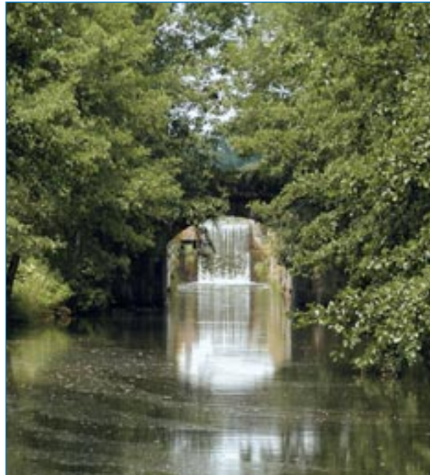
■ Idylle am Ludwigskanal

Der 1992 feierlich eingeweihte Main-Donau-Kanal brachte der Region erneut einen wirtschaftlichen Aufschwung. Im Jahr 2000 wurde das 1100-jährige Jubiläum Mühlhausens mit einem großen Bürgerfest gefeiert.