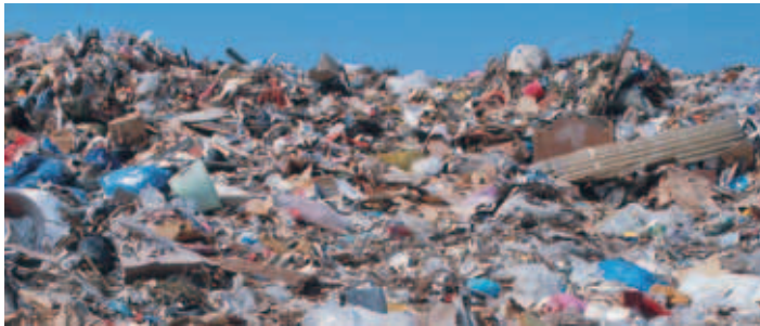
Die Müllbeseitigung und -Entsorgung – eine wichtige Aufgabe jeder Gemeinde