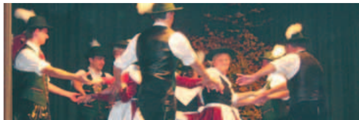
Trachtenverein „d' Waldnaabtaler“