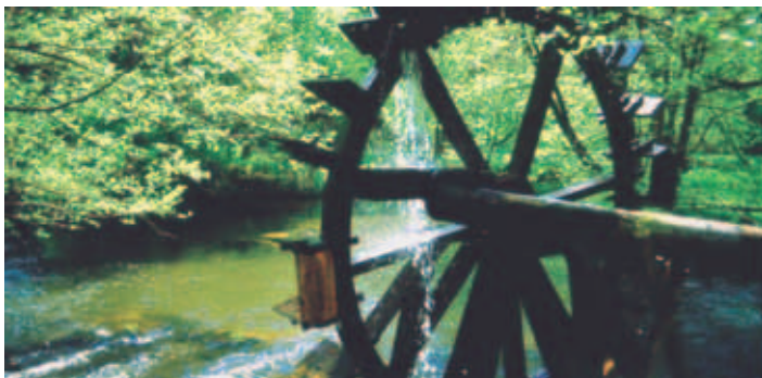
Wasserrad an der Blockhütte