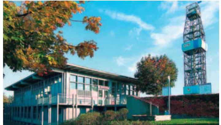
Das tiefste Bohrloch der Welt

Hervorzuheben ist das idyllische, wildromantische Naturschutzgebiet Waldnaabtal und die Burg Neuhaus (Waldnaabtmuseum) mit ihrem 23 Meter hohen sogenannten Butterfasturm. Windischeschenbach hat auf dem Gebiet der Geowissenschaften eine Besonderheit aufzuweisen und zwar die Kontinentale Tiefbohrung der Bundesrepublik Deutschland (KTB). Die Erdkruste wurde hier von 1987 bis 1994 an einer Nahtstelle erbohrt, an der vor 300 Millionen Jahren die auf dem Erdmantel triftenden Kontinente Ur-Afrika und Ur-Europa aneinanderstießen. Die Bohrung, mit dem weltweit größten Landbohrturm von 83 m Höhe, hat eine Endtiefe von 9101 m erreicht und ist somit das tiefste Bohrloch der Welt. Im Geozentrum an der Bohrstelle kann man sich über die Ergebnisse dieser wissenschaftlich einmaligen Tiefenbohrung informieren.