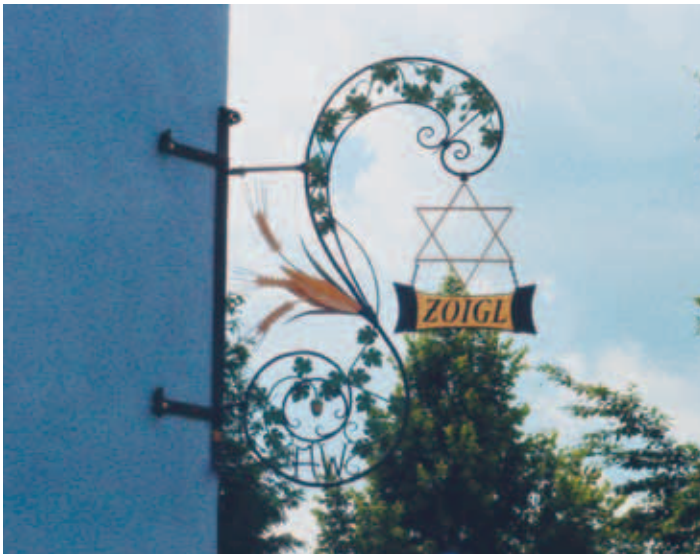
Kommunbrauhäuser stellen das Zoiglbier her

Die Zoiglstuben waren ursprünglich Wirtshäuser auf Zeit. Ein paar Mal im Jahr wurde das Wohnzimmer ausgeräumt, einige Tische wurden aufgestellt, fertig. War ein Zoigl gut, dann ging das wie ein Lauffeuer herum. Noch heute wird beim Roud'n die Küche der Familie bei Besucheransturm zur zusätzlichen Zoiglstube.