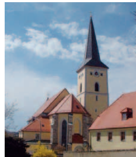
Stadtpfarrkirche St. Emmeram