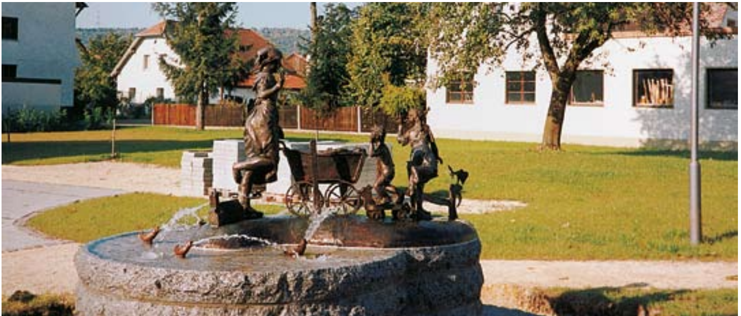
Figurengruppe auf dem Dorfbrunnen

Hier treffen Altertum der Erde (Granitaufläufer des Bayerischen Waldes), das Mittelalter (Jura – Lias – Keuper) sowie die Neuzeit der Erde (Schwemmland der Donau) sichtbar aufeinander.