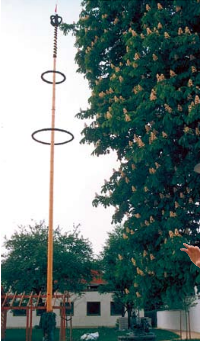
Maibaum – Traditionspflege auf dem Dorfplatz