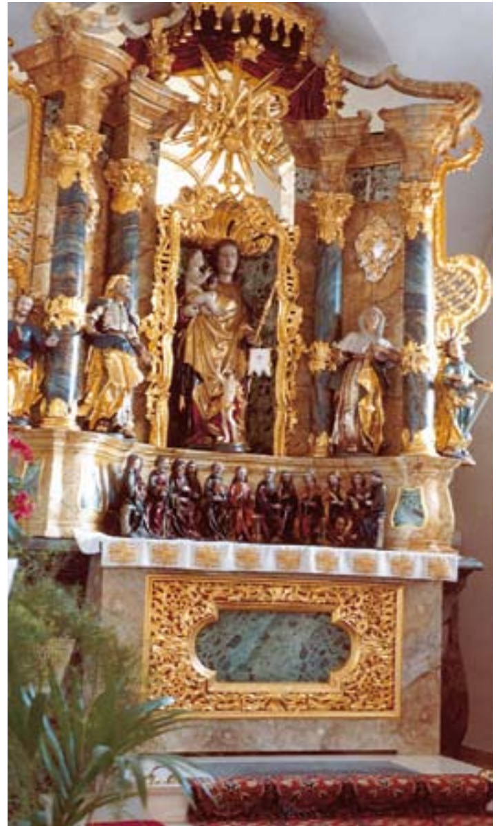
Altar der Tegerzheimer Pfarrkirche