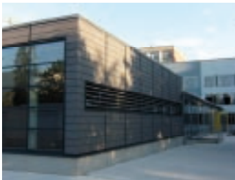
Planung, Bauleitung, Objektüberwachung