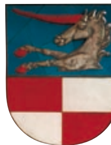
Wappen der ehemaligen Gemeinde Regendorf