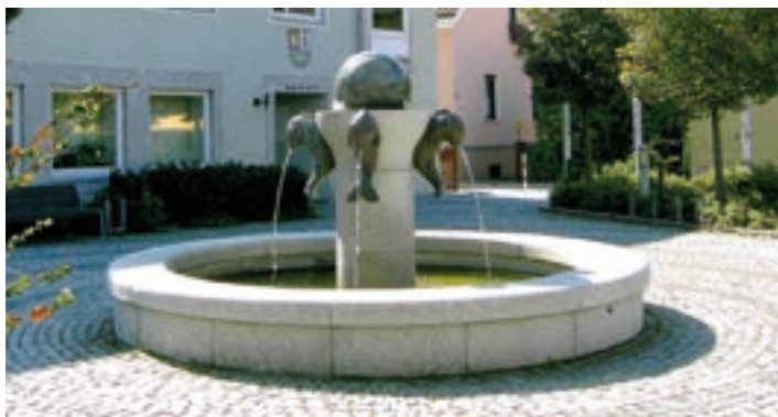
Rathaus mit Brunnen