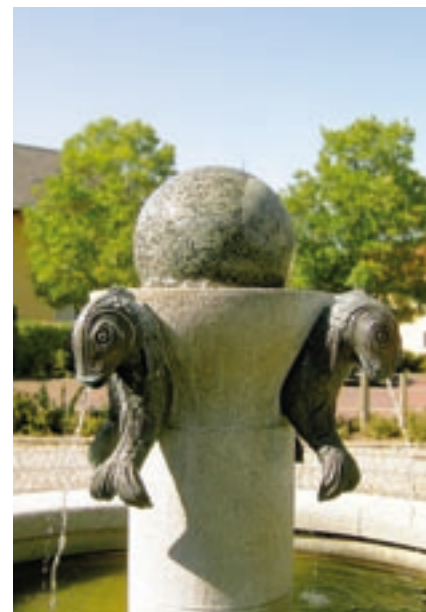
Brunnen am Rathausplatz