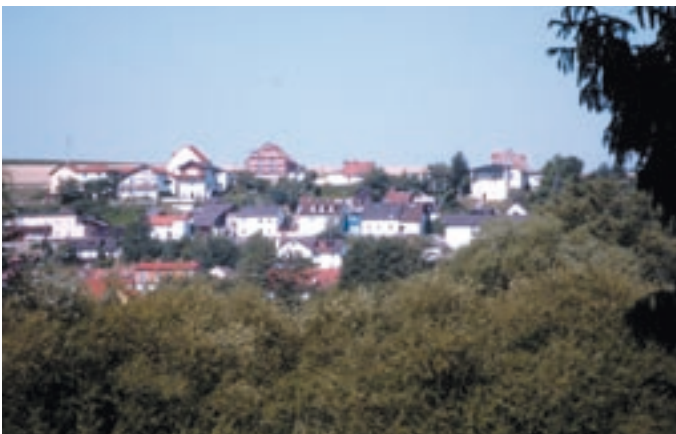
Blick auf Regendorf