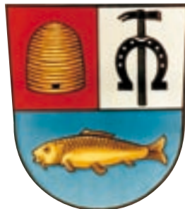
Wappen der Gemeinde Zeitlarn