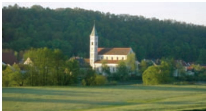
Blick auf Zeitlarn