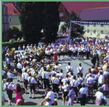
Karpfhamer Feststraße

Vor 1100 Jahren wird Karpfham zum ersten Mal erwähnt. 903 wird es von König Ludwig dem Kind dem entstehenden Passauer Domkapitel geschenkt. Der Ort ist wahrscheinlich ursprünglich Fiskalgrund der jeweils bayerischen Herrscher aus dem Erbe des untergegangenen Römischen Reiches. Ein Mann Namens Corbe (=Rabe) aus der romanischen Urbevölkerung hat wohl im 7./8. Jahrhundert seinem „Heim“ den Namen Corbheim gegeben. Das wohl herausragendste Ereignis in der Historie Karpfhams geht 1162 über die Bühne.