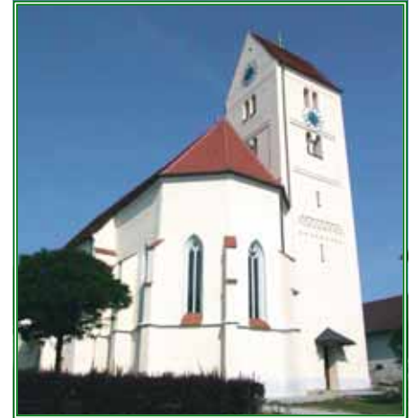
Kirche in Reutern

Gegen Ende des 12. Jhdts. findet man das Hochstift Passau in Reutern begütert. Auch die Mönche von Vornbach hatten Grundbesitz im Dorf selbst und in der Umgebung von Reutern. Allein diese Angaben beweisen, dass Reutern ein uralter Kulturort ist. Wenn schon im Jahre 1076 Weinberge verschenkt werden, so ist erwiesen, dass deren Anlegung schon in weiter zurückliegender Zeit erfolgt sein musste. Dass das Gebiet um Reutern schon in vorgeschichtlicher Zeit von Menschen besiedelt war, beweisen zahlreiche steinzeitliche Funde.