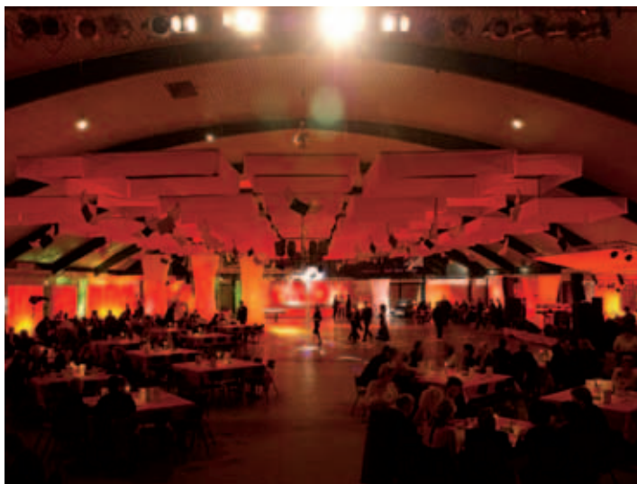
Niederbayernhalle: flexibel durch tolle Ideen und guten Service

eine der wichtigsten kulturellen und gesellschaftlichen Begegnungsstätten Ruhstorf. Die Veranstaltungshalle ist von ausreichenden Parkplätzen und Freiflächen umgeben, die auch die Aufstellung mehrerer Festzelte oder größerer Hallen erlauben. Hier finden auch Open air-Veranstaltungen mit bis zu 10.000 Besuchern statt. Die Niederbayernhalle hat eine Gesamtfläche von 1500 qm, davon umfasst allein die Bühne 170 qm. Die Halle kann – ohne Bestuhlung – 3000 Personen aufnehmen. Tische und Bestuhlung sind für 1500 Gäste vorhanden. Die Bewirtung inklusive einer professionell eingerichteten Großküche ist vertraglich langfristig vergeben. Die Wünsche der Veranstalter können individuell berücksichtigt werden. Behindertengerechte Toilette. Die Vermietung der Halle erfolgt über das Management bei der Gemeinde, Geschäftsleitung Andreas Jakob, Tel. 08531/9312-11.