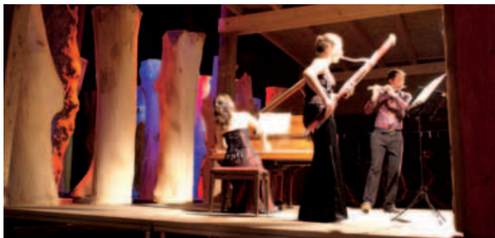
Konzerte an außergewöhnlichen Veranstaltungsorten: das Ruhstorfer Kulturprogramm