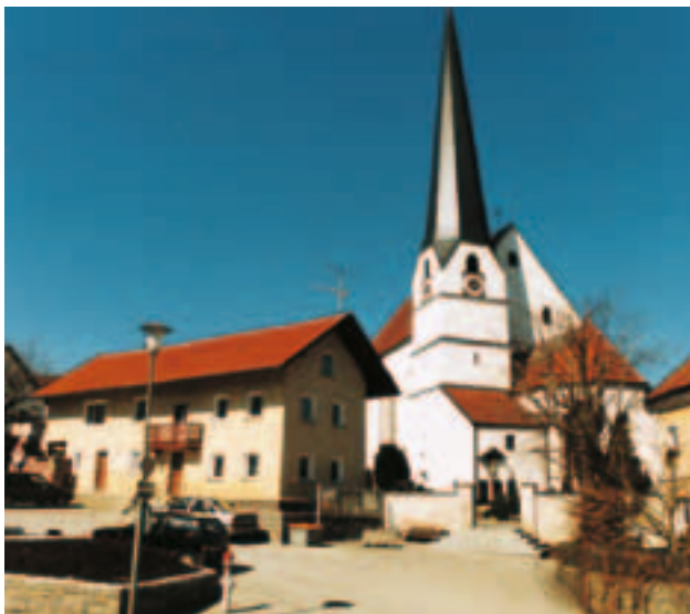
Neukirchen a. Inn

... mit seinen fast 4.500 Einwohnern, seinen Gewerbetreibenden, freiberuflich Tätigen, Gastronomiebetrieben, Landwirten und vielen ehrenamtlich arbeitenden Vereinen und Organisationen,