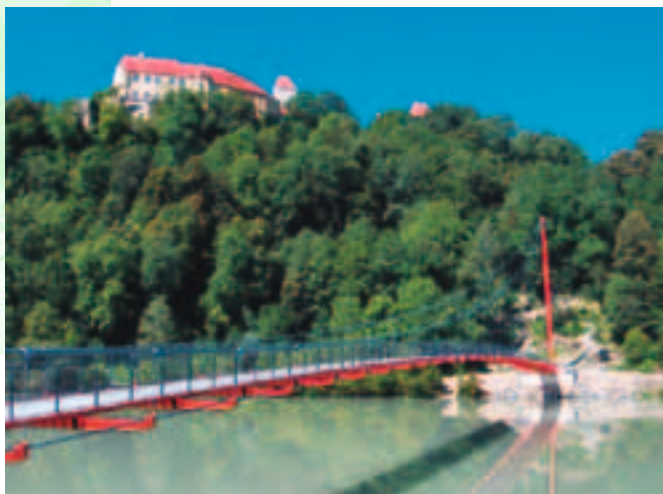
Wir bauen Brücken ...