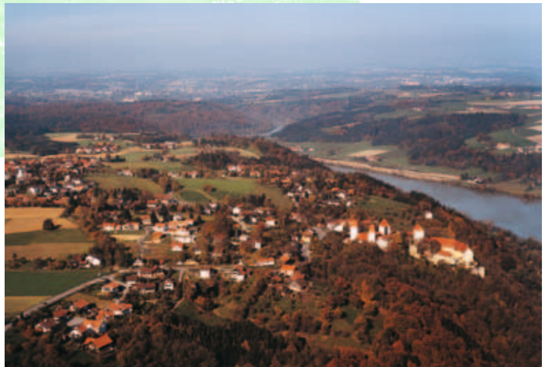
Neuburg a. Inn