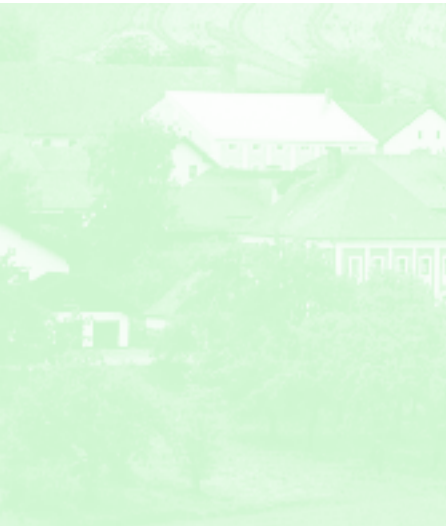
Neukirchen a. Inn