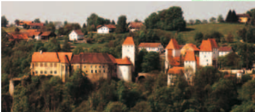
Schloss Neuburg a. Inn