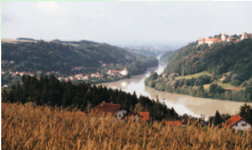
Schloss Neuburg mit Ortschaft Wernstein am Inn/Oberösterreich

kommunale Partnerschaft mit der Gemeinde Wernstein am Inn OÖ (gehörte historisch zur Grafschaft Neuburg a. Inn). Bau des „Mariensteiges“ über den Inn.