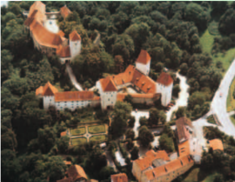
Schloss Neuburg Luftansicht