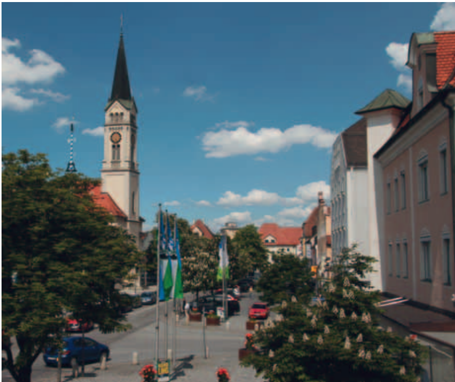
Ludwigplatz mit Stadtpfarrkirche