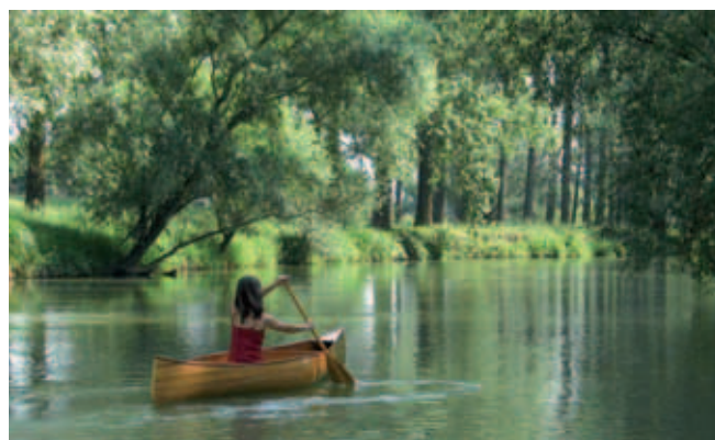
Freizeit „Untere Isar“