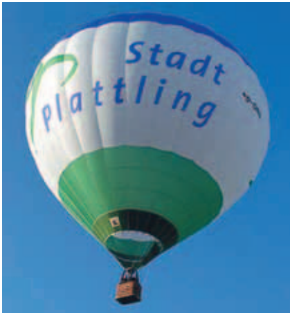
Viel Raum und Luft für meine Ideen und Träume.