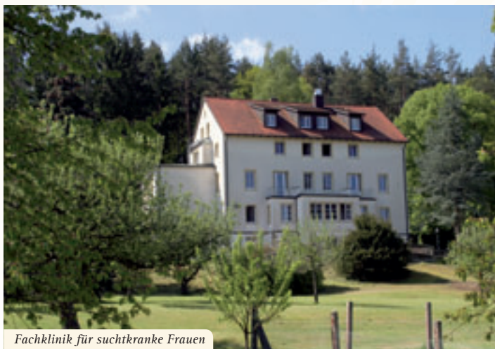
Fachklinik für suchtkranke Frauen