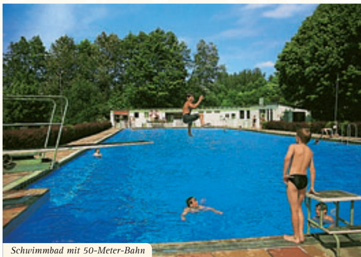
Schwimmbad mit 50-Meter-Bahn