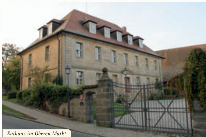
Rathaus im Oberen Markt