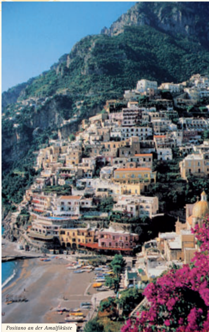
Positano an der Amalfiküste