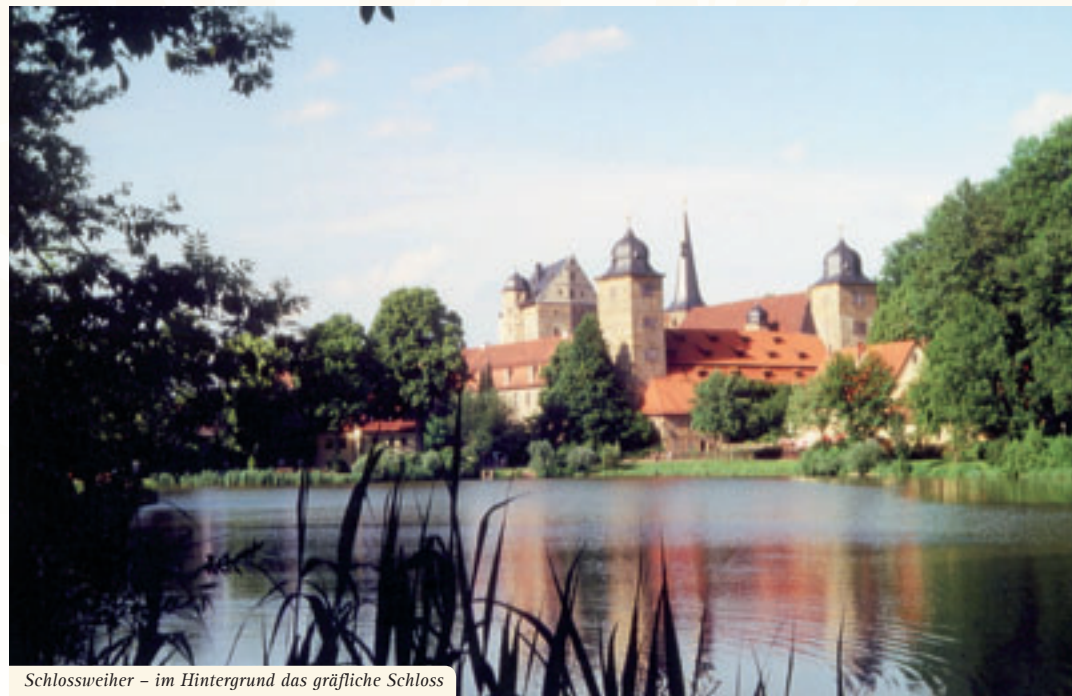
Schlossweiher – im Hintergrund das gräfliche Schloss

nau und Hutschdorf sowie auf den Bolzplätzen in nahezu allen Ortsteilen, Golfen auf dem 18-Loch-Platz des Golf-Clubs Oberfranken, Kegeln auf den zwei vollautomatischen Bahnen im Café-Restaurant Schormühle, Radfahren und Skaten auf den stillgelegten Eisenbahntrassen nach Bayreuth und Kulmbach, Reiten bei der Familie Kretter im Ortsteil Berndorf, Schießen auf der modernen Schießanlage der Kgl. Priv. Schüt-