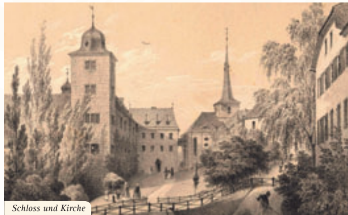
Schloss und Kirche