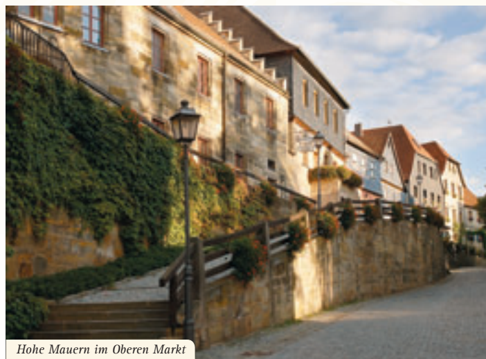
Hohe Mauern im Oberen Markt