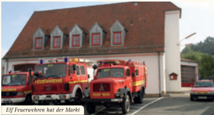
Elf Feuerwehren hat der Markt