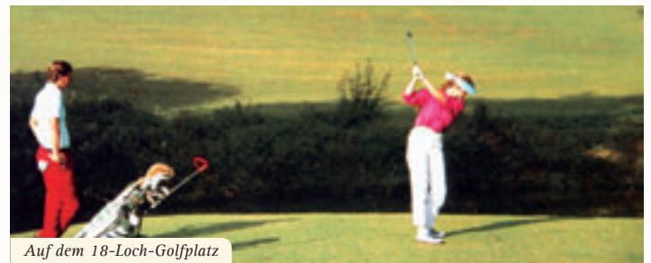
Auf dem 18-Loch-Golfplatz