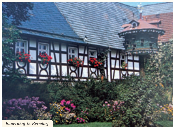
Bauernhof in Berndorf