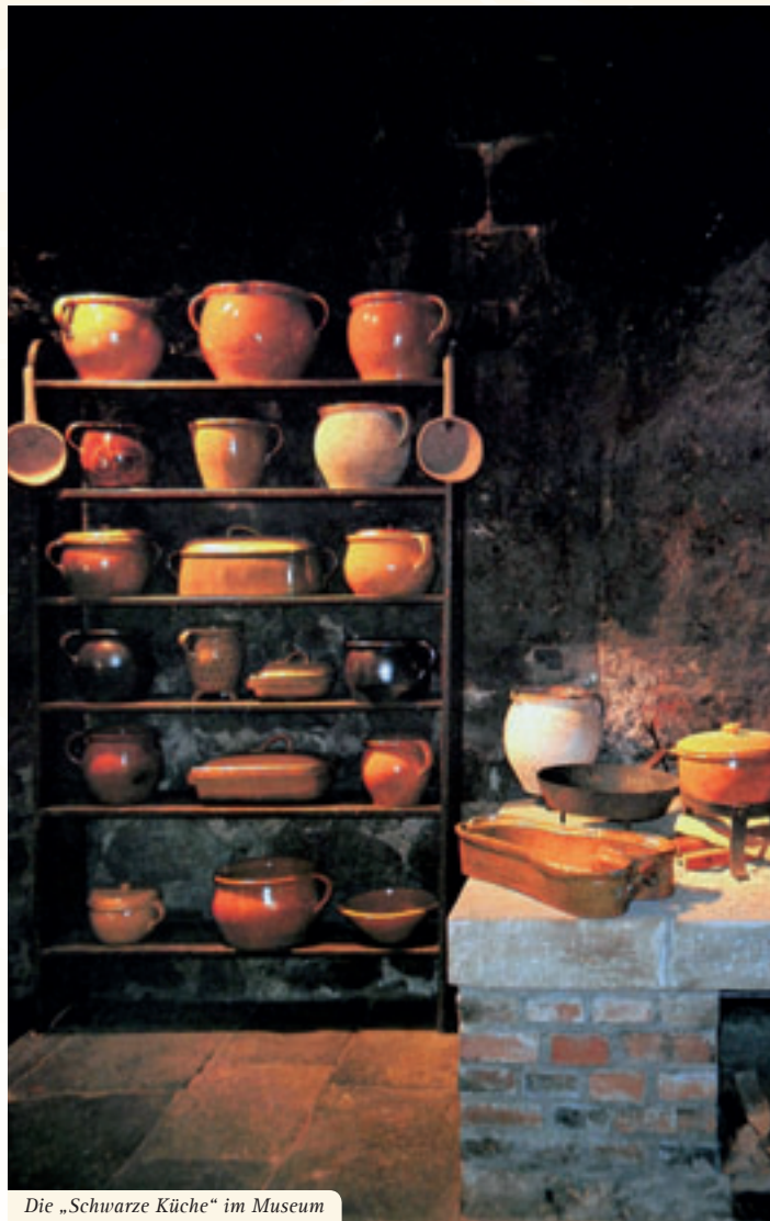
Die „Schwarze Küche“ im Museum

Im Dezember 1982 mit dem 1. Bauabschnitt eröffnet, gibt der Dokumentationsbereich, der in seiner Vollständigkeit beispielhaft ist, mit Schautafeln und Urkunden, alten Fotografien und ergänzenden Texten einen Überblick.