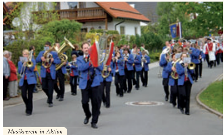
Musikverein in Aktion