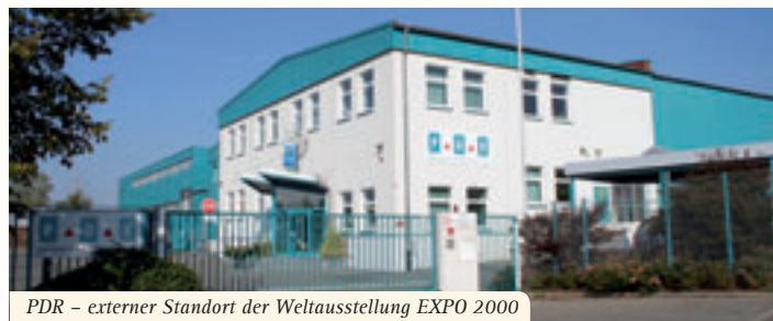
PDR – externer Standort der Weltausstellung EXPO 2000