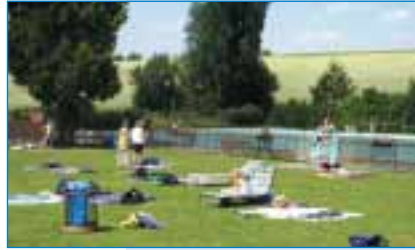
Schraudenbach – Freibad