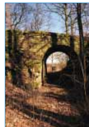
Egenhausen – Steinbruch Hier wurde noch bis in die 60er Jahre Sandstein abgebaut.