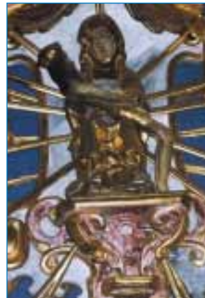
Eckartshausen – Gnadenbild der Schmerzhaften Muttergottes in der Wallfahrtskirche Mariä Heimsuchung

• viele Bildstöcke (Marterln) in allen Gemeindeteilen