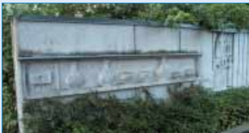
ERleben – Geschichtsfries an der Schulmauer

Wir haben uns bemüht, die in dieser Broschüre enthaltenen Informationen vollständig und richtig darzustellen. Selbstverständlich ist es trotzdem möglich, dass die eine oder andere wichtige Adresse oder der eine oder andere wichtige Hinweis unzutreffend ist, fehlt oder eine Ergänzung notwendig erscheint. Bitte teilen Sie dies der Gemeindeverwaltung, Telefon 22 61 mit. Ihr Hinweis bzw. Ihre Anregung kann dann bei einer evtl. Neuauflage dieser Broschüre berücksichtigt werden.