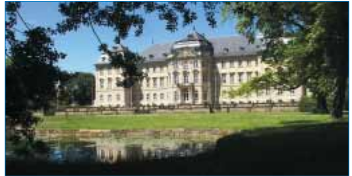
Schloss Werneck – 1732 beauftragte Fürstbischof Friedrich Karl von Schönborn Balthasar Neumann mit dem Schlossbau.

Für die Freizeit stehen ein Hallenbad, ein Freibad sowie moderne Sportanlagen zur Verfügung. Grund- und Hauptschule, Außenstelle der Musikschule und der VHS Schweinfurt, Krankenpflegeschule, 10 Kindergärten, 23 Spielplätze, zahlreiche Ärzte, Forstdienststelle, Rechtsanwalt und Notariat sind in der beliebten Wohngemeinde ebenso zu finden wie Hotels, eine Vielzahl von Gaststätten und Cafe's sowie Vereinsheime. In und um Werneck sorgen 177 Vereine dafür, daß für jeden etwas auf kulturellem bzw. sportlichem Sektor geboten wird.