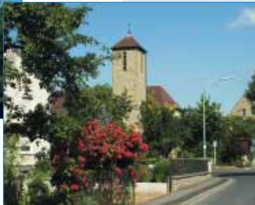
Stettbach – Kirche St. Leonhard