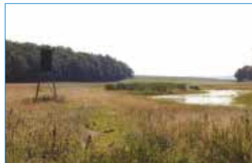
Rundelshausen – Feuchtbiotop Eschenbach