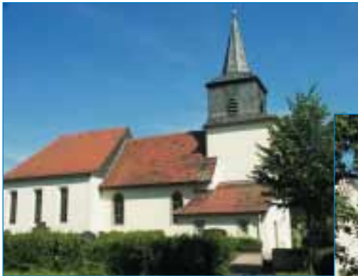
Mühlhausen – Kirche St. Martin