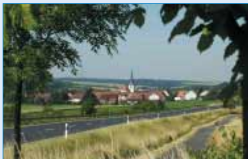
Zeuzleben – Dorfansicht