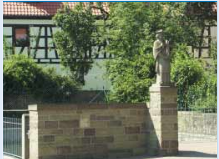
Vasbühl – Dorfweiher mit Nepomukstatue

Egenhausen (historisches Datum 890), Rundelshausen (1234), Schleerieth (1150), Schraudenbach (1272), Stettbach (1302) und Vasbühl (1317).