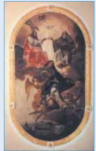
Ettleben – Deckengemälde „Mariä Krönung“ im Altarraum der Kirche St. Michael