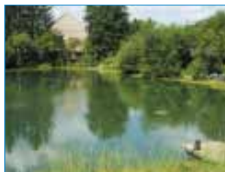
Schnackenwerth – Dorfsee

Die Kerngebäude des Heimes sind 1970 fertiggestellt worden. In den Jahren 1990 mit 1994 erfolgte eine umfassende Sanierung, Modernisierung und Erweiterung.