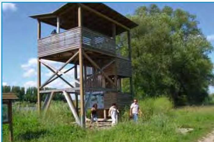
Aussichtsplattform Vogelschutzgebiet Heidenfeld

in diesen Gebieten der Gemeinde zugewiesenen Baugrundstücke wurden zügig an Bauwerber verkauft und sind mittlerweile mit Eigenheimen bebaut.