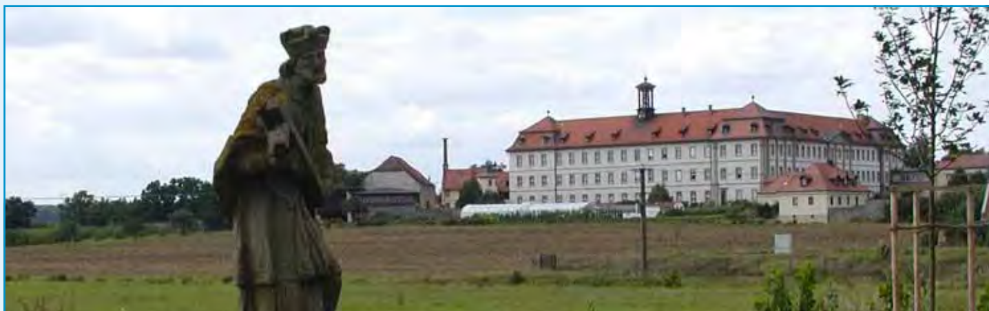
Kloster in Heidenfeld mit Nepomuk-Statue