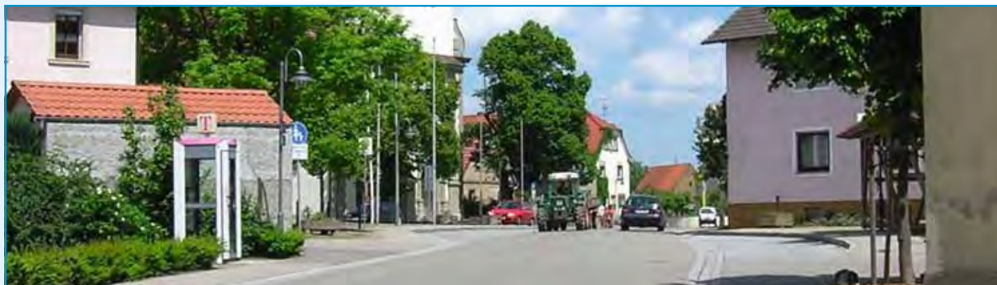
Kardinal-Faulhaber + Liborius-Wagner-Platz in Heidenfeld