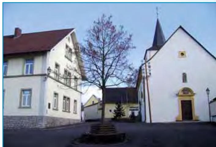
Bürgerhaus und Kirche Hirschfeld

Um der Nachfrage nach Baugrundstücken gerecht zu werden, wurden 2003 für den Gemeindeteil Heidenfeld das Baugebiet „An der Heide I. Abschnitt“ und für Röthlein das Baugebiet „Am Elmuß II. Abschnitt“ ausgewiesen und erschlossen. Die