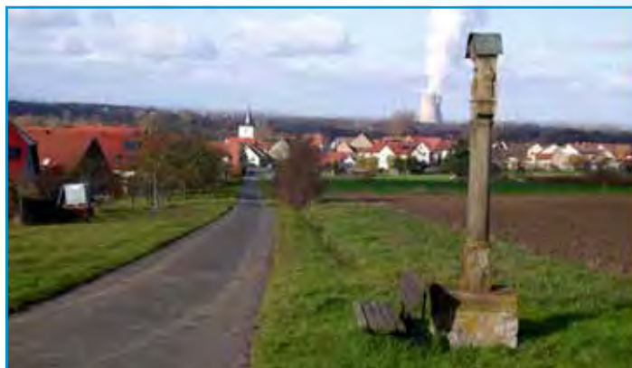
Blick auf Hirschfeld