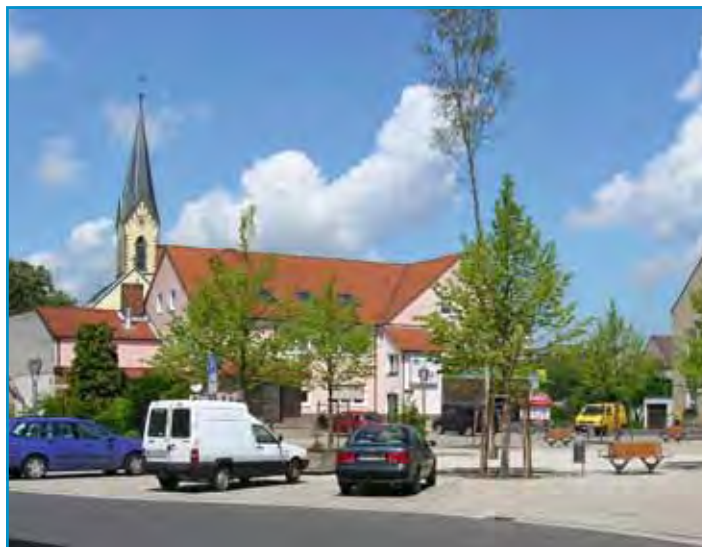
Platz unter den Linden in Röthlein