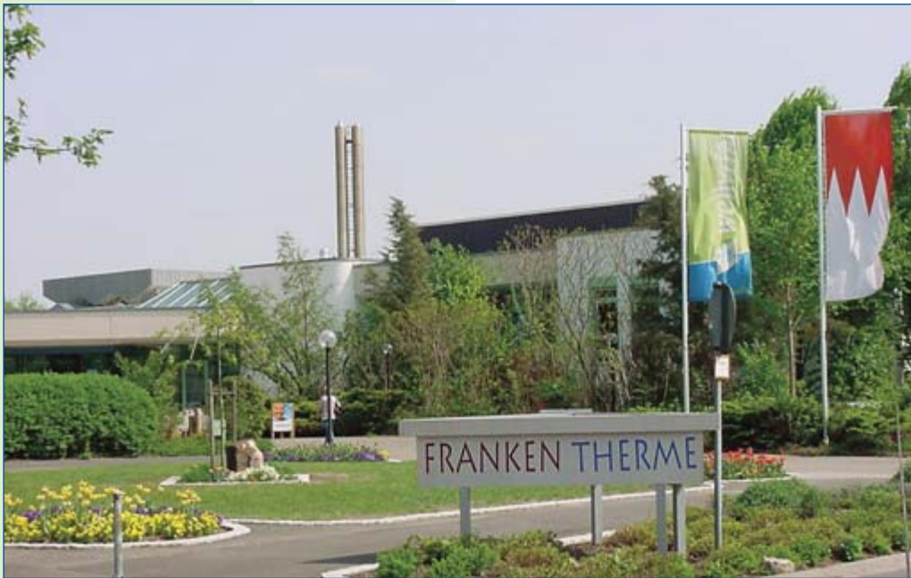
Gesundheits- und Erlebnisbad „Frankenthaler“

Beim Spaziergang durch den großzügig angelegten Kurpark kann man so richtig die Seele baumeln lassen.