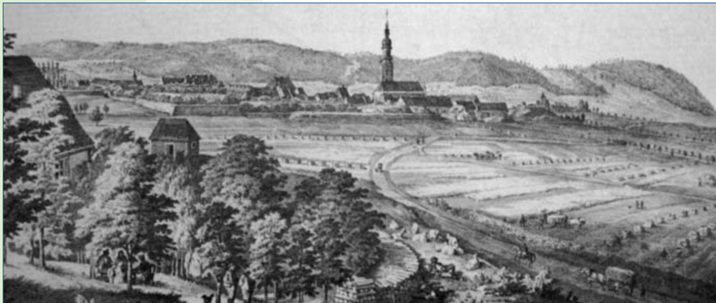
Bad Königshofen i. Grabfeld von Norden – Lithografie von Valentin Hummel um 1850

Im 8. Jahrhundert kamen dann auch schon Glaubensboten in das Land zwischen der Rhön, den Haßbergen und dem Thüringer Wald. Im Jahre 739 beauftragte der Papst den Missionar Bonifatius, auch die Grabfeldbewohner zu lehren. Damals muss in Königshofen schon eine Kirche gestanden haben, denn bereits im Jahre 741 übergab der König mit einer Reihe von Kirchen auch die bisherige königseigene Kirche „St. Peter“ von Chuningishaoba in pago Graffeldi dem Bischof von Würzburg. Königshofen war neben Untereßfeld und Wülfershausen eine der Urfparreien an der oberen Fränkischen Saale.