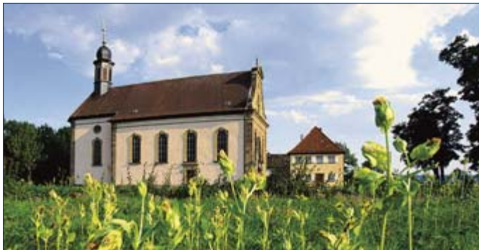
Wallfahrtskirche in Ipthausen

in hennebergischen Urkunden als Gemeindeteile Gabolshusin und Hagin bezeichnet, wird erstmals urkundlich im Jahre 1234 erwähnt. Im 14. Jahrhundert wurde das heute noch erhaltene Torhaus als Bestand-