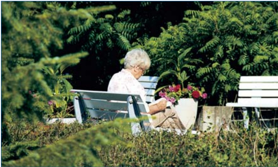
Erholung im Kurpark