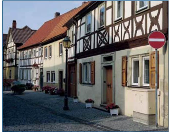
Fachwerkstraße in Bad Königshofen i. Grabfeld

Mittelpunkt der Stadt bildet der große gemütliche Marktplatz mit seinen drei Brunnen und dem mittelalterlichen Kornstein. Der Vierröhrenbrunnen trug bis 1631 das Standbild des Fürstbischofs Julius Echter, das die Schweden bei ihrem Einzug stürzten. Über dem Michaelsbrunnen mit seiner schmiedeeisernen Bekrönung ist die Figur des Erzengels mit der Seelenwaage angebracht. Dieser Brunnen ist aus einer Wasserzisterne hervorgegangen, die bei der Bekämpfung der großen Feuersbrünste in Königshofen eine bedeutende Rolle spielte. Im Jahre 1912 stiftete Reichsfreiherr von Deuster auf Schloß Sternberg den Luitpoldbrunnen, der als Symbol des Grabfeldes die Statue einer fleißigen Schritterin trägt. In den Sommermonaten ist der Brunnen ein beliebter Treffpunkt der Schüler.