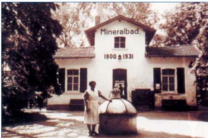
Das erste Mineralbad

Heute werden in Bad Königshofen i. Grabfeld Erkrankungen des Magens, des Darms, der Leber und der Galle sowie Stoffwechselstörungen behandelt. Desweiteren werden Erkrankungen des Stütz- und Bewegungsapparates und rheumatische Erkrankungen therapiert.