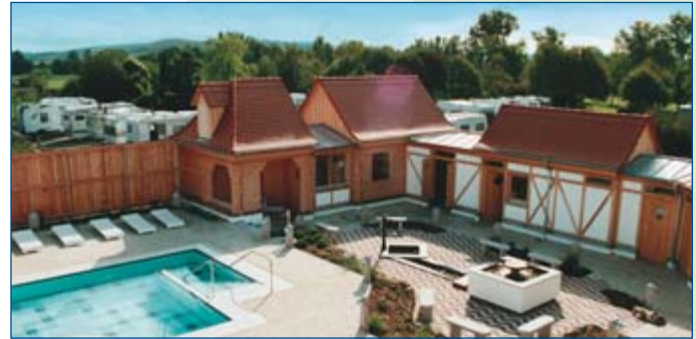
Gesundheits- und Erlebnisbad „Frankentherme“