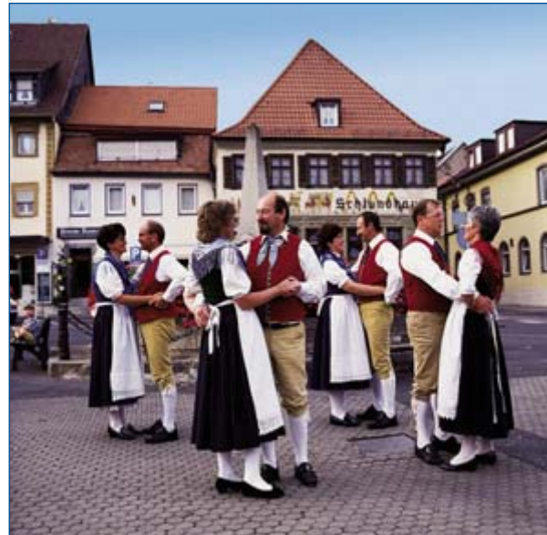
Trachten- und Volkstanzgruppe „Harmonia“

Das Gesundheitswesen ist durch die Niederlassung von praktischen Ärzten, verschiedenen Fachärzten und durch das Kreiskrankenhaus gesichert. Einkaufszentren, Banken, Postdienststelle, Notariat, ein intaktes Vereinsleben und alle wichtigen Behördeneinrichtungen befinden sich – was sich ein Bürger von einer guten Gemeinde wünscht – am Ort.