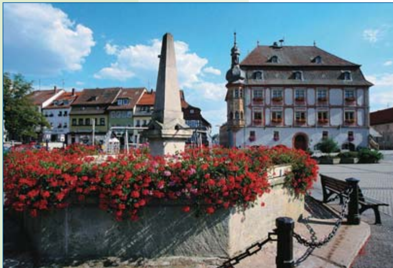
Rathaus – im Vordergrund Vierröhrenbrunnen