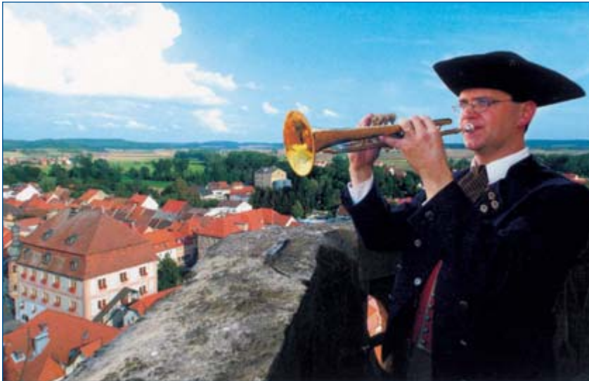
Türmer in Bad Königshofen i. Grabfeld