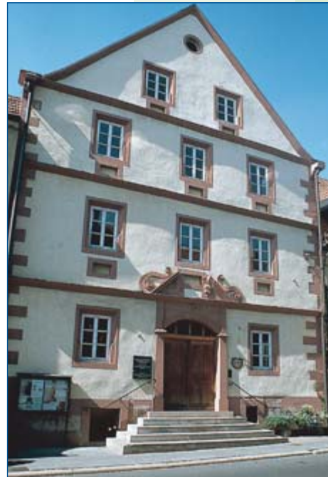
Schranne aus dem Jahre 1693

Durch die Bereitstellung einer modernen Kurmittelabteilung, den Bau einer Trink- und Wandelhalle und nicht zuletzt durch die Erweiterung