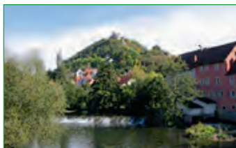
Trimberg mit Trimburg

Sehenswert in Trimberg ist die katholische Kirche St. Elisabeth aus dem 18. Jahrhundert, deren Hochaltar kunsthistorisch bedeutungsvoll ist. In der deutschen Literatur des Mittelalters tritt Trimberg mit zwei Persönlichkeiten auf. Hugo von Trimberg verfasste das umfangreiche Lehrgedicht „Der Renner“, und Süßkind von Trimberg war Minnesänger. Weitere Informationen hierzu erhalten Sie auf unserer Homepage www.elfershausen.de unter der Rubrik „Allgemeines/Geschichte“.