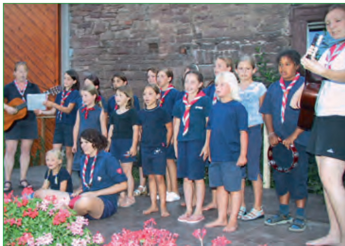
Saale-Musicum im Schlosshof Elfershausen

Die Pfarrgemeinde Machtilshausen organisiert jedes Jahr eine Fußwallfahrt nach Münnerstadt. Kirchliche Organisationen bieten unseren Senioren unterhaltsame Nachmittage.