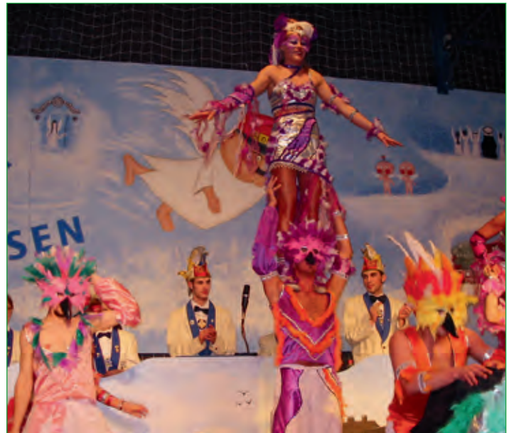
Karnevalverein Blau-Weiß Elfershausen