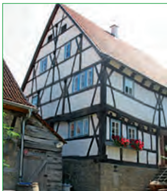
Schreinersch-Haus in Machtilshausen 2008

Als sehenswertes Baudenkmal zählt das im Jahr 1488 in spätgotischem Fachwerk erbaute „Schreinersch-Haus“ in Machtilshausen , welches durch den Verein für Gartenbau, Brauchtums- und Heimatpflege Machtilshausen wieder instandgesetzt wurde. Es ist eines der ältesten Bauernhäuser in Bayern. Sein Alter von über 500 Jahren, seine Bauausführung und sein stolzes Erscheinungsbild reihen es in eine kleine Gruppe der wichtigsten Bauerzeugnisse des Bürgertums in ganz Franken ein. Wie in einem