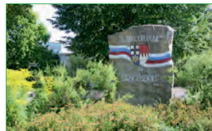
Begrüßungsstein an der Schule in Langendorf