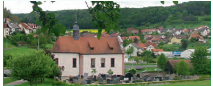
Machttilshausen mit Kreuzkapelle