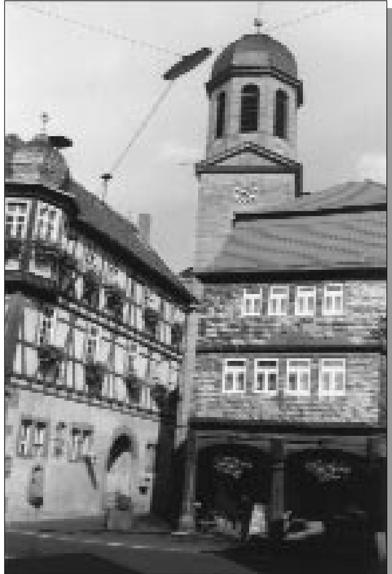
Altes Rathaus mit Pranger und Historisches Haus, erbaut auf Holzsäulen