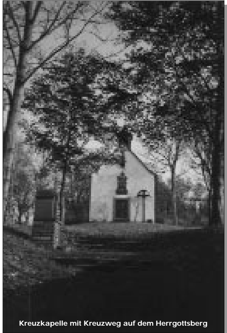
Kreuzkapelle mit Kreuzweg auf dem Herrgottsberg