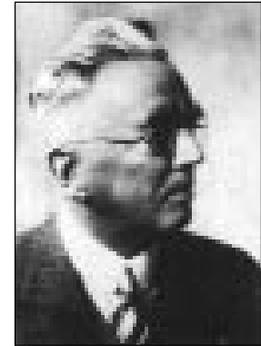
Walter Bloem geb. 20. Juni 1868 in Elberfeld, gest. 19. August 1951 in Lübeck

Da die Ehe des Grafen kinderlos blieb, gelangte Rieneck 1673 in den Besitz der Grafen von Nostitz. Die Burg wechselte im Laufe der Jahre mehrmals den Besitzer. So lebte auch eine Zeit der Schriftsteller und Dichter Walter Bloem in seinem „weltentrückten Felsenest“, wie er die Burg zu nennen pflegte.