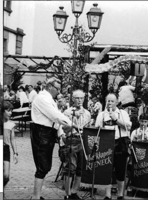
Kirchweih im August