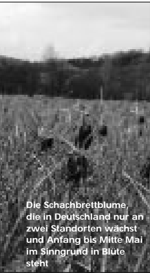
Die Schachbrettblume, die in Deutschland nur an zwei Standorten wächst und Anfang bis Mitte Mai im Sinngrund in Blüte steht