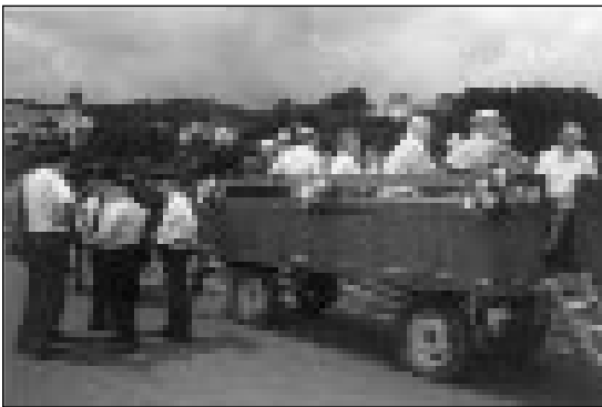
Jubiläumsfestzug des Verschönerungsvereines