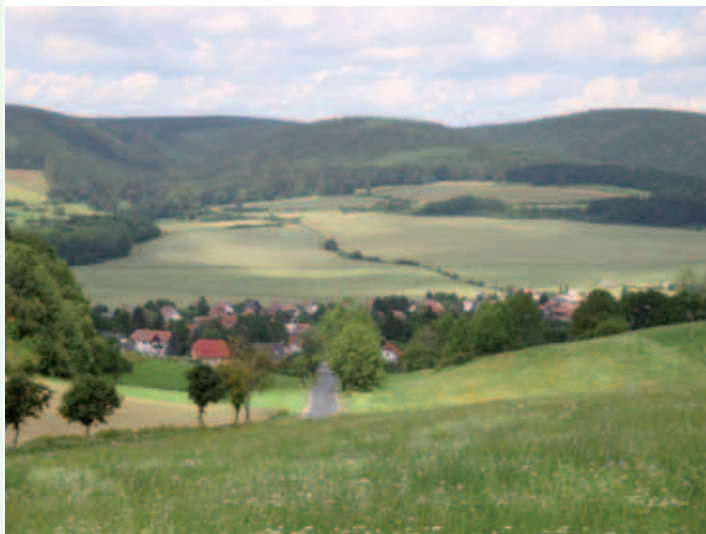
Blick auf Sachsenbrunn