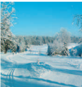
Friedrichshöhe im Winter

Unser Ortsteil Friedrichshöhe , auf einer Rodungsinsel um 1724 entstanden, lädt durch seine Lage, direkt am Rennsteig, besonders zum Wandern und Verweilen ein und ist das Richtige für alle, die Natur hautnah erleben wollen. Durch seine Schneesicherheit ist Friedrichshöhe auch im Winter ein gefragter Urlaubsort. Dem Skifahrer stehen viele Kilometer gespurter Loipen zur Verfü-