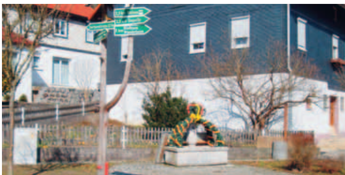
Dorfbrunnen in Tossenthal

Tossenthal bestand ursprünglich aus zwei Gütern, deren Ländereien verstreut an einem Höhenrücken zwischen den Orten Sachsenbrunn, Bachfeld, Weitesfeld und Stelzen lagen. Weitesfeld wurde erstmals 1378 urkundlich erwähnt.