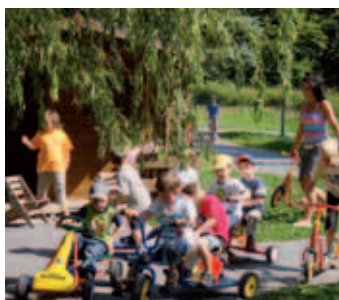
Rollerbahn auf dem Spielplatz der Kita