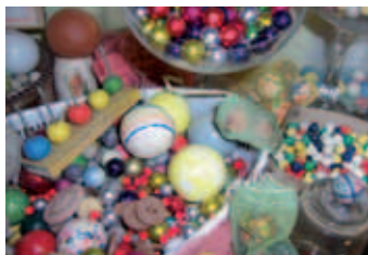
Murmeln und Perlen