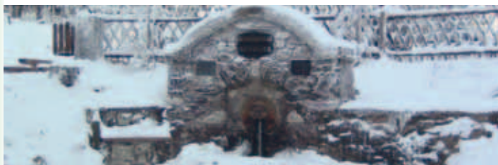
Werraquelle im Winter