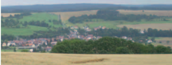
Blick vom Burgberg auf Sachsenbrunn