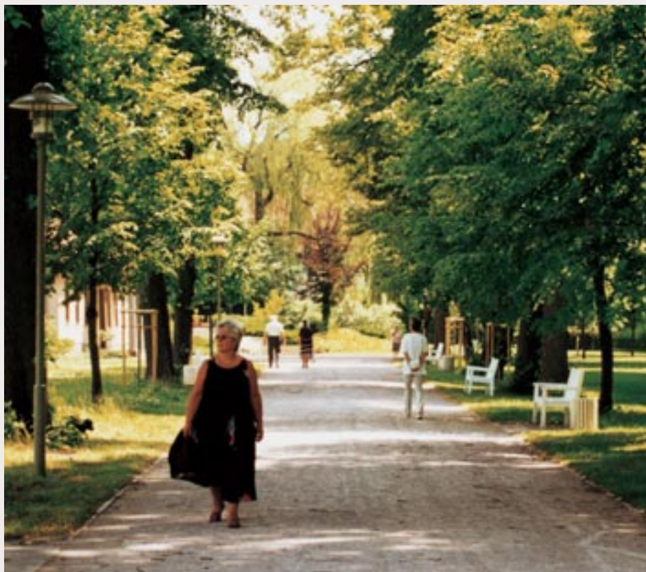
Goetheallee im Kurpark

1997. Ein weiterer Standort von ca. 15 ha Größe ist das Wohngebiet „Am Hundehügel“. Dort wurden in den vergangenen Jahren 160 Grundstücke verkauft. In den einzelnen Bauabschnitten stehen ca. 20 Grundstücke noch zur Verfügung.