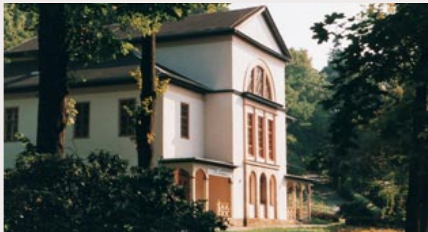
Coudray-Haus – „Haus des Gastes“

1994 und 1997 wurden zwei neue Rehabilitationskliniken - die MEDIAN Kliniken I und II - direkt am Kurpark Bad Berka eröffnet.