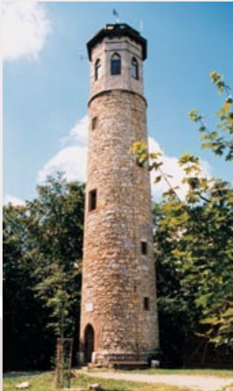
Paulinenturm Bad Berka