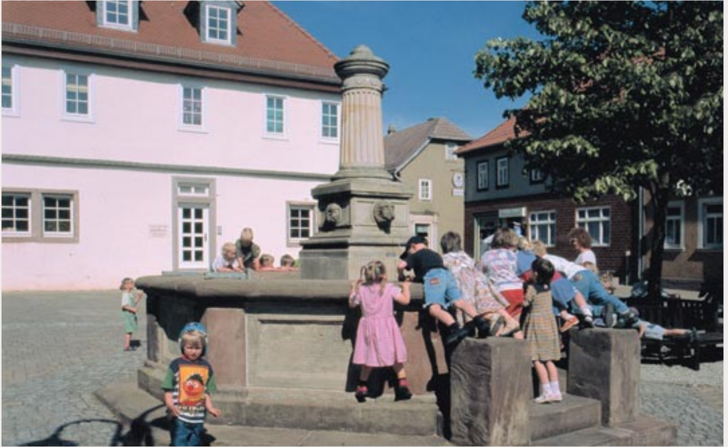
Spielende Kinder am Marktbrunnen Bad Berka