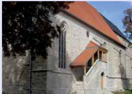
Kirche St. Peter und Paul