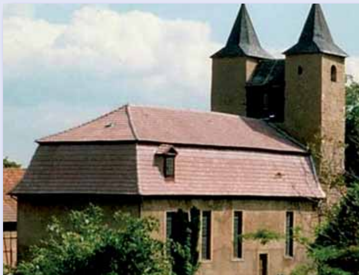
St. Kilian Ottenhausen