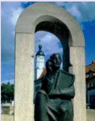
Das Denkmal von Minnesänger Walther von der Vogelweide

Voraussetzung für das Werden Weißensees zur Stadt war die Verleihung eines Marktrechts. Die Nennung eines Marktmeisters für das Jahr 1198 belegt das Walten eines solchen Beamten auf dem Weißenseer Markt. Von diesem Marktmeister hat sich auch das wohl älteste Siegel einer ludowingischen Stadt in Thüringen erhalten. Im romantischen Festsaal des Rathauses erfreuen sich seit über 400 Jahren Trauungen großer Beliebtheit.