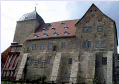
Die Burg Weißensee, Runneburg genannt, ist eines der Wahrzeichen der Stadt.

Das erste deutsche städtische Reinheitsgebot für Bier wurde 1434 im thüringischen Weißensee festgeschrieben. Im „Stat Buch“ von 1434 entdeckte man eine „Statuta thaberna“, die Gesetze über das Benehmen in Wirtshäusern und das Brauen von Bier zusammenfasst. Darin heißt es übertragen: „Zu dem