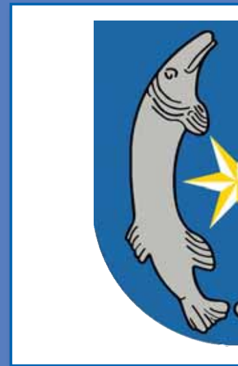
Wappen Stadt Weißensee