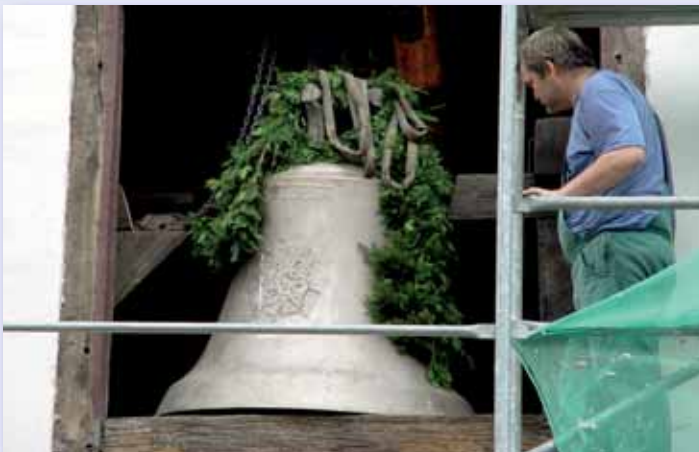
Einbau der Glocke

Die Evangelische Kirchengemeinde Weißensee beschloß im Dezember 1998 den Einbau eines Gemeinderaumes und Sanitärbereiches unter der Empore auf der Westseite der Kirche.