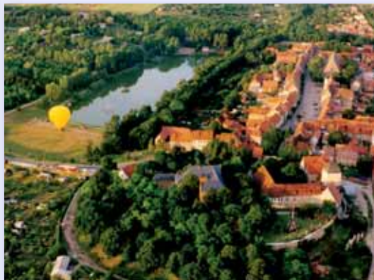
Blick auf die Altstadt von Weißensee und auf den Gondelteich