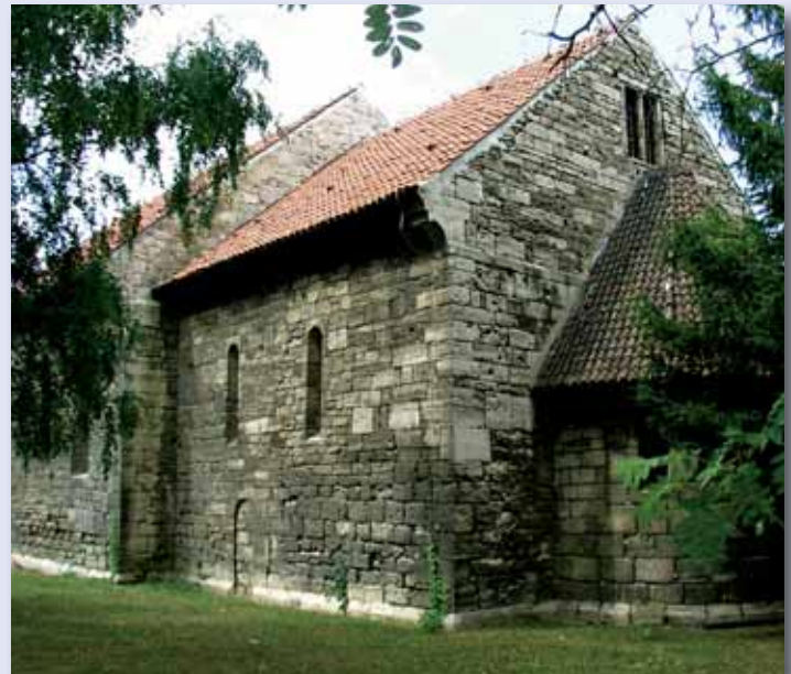
St. Nicolai-Kirche in Weißensee