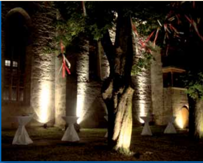
Kirche St. Peter und Paul, angestrahlt zu den Festspielen