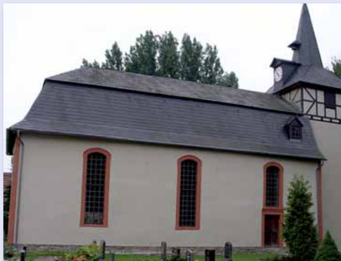
St. Salvator Scherndorf

Die heutige Kirche gründet sich auf dem Mauerwerk des ehemaligen Klosters und besteht in der Hauptsache aus drei Baugliedern unterschiedlicher Epochen. Als ältestes Glied ist der romanische Doppelturm anzusehen, welcher mit gekoppelten Rundbogenfenstern versehen war und in das 12. Jh. gehört.