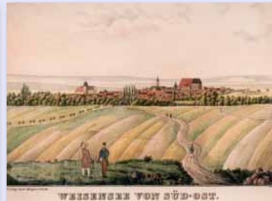
Lithografie von Weißensee aus der Mitte des 19. Jahrhunderts