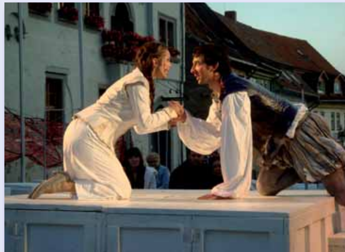
Szenei: Romeo und Julia 2009

Dritter Advent – Traditioneller Weihnachtsmarkt Ort: Marktplatz