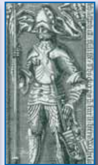
Herzog Wilhelm III