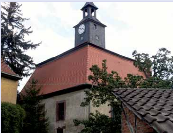
St. Salvator Waltersdorf