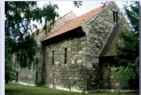
Die Kirche St. Nicolai