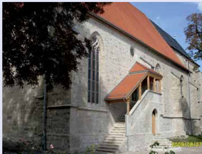
St. Peter und Paul