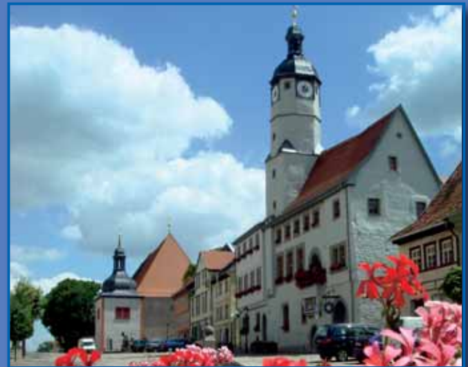
Rathaus in Weißensee