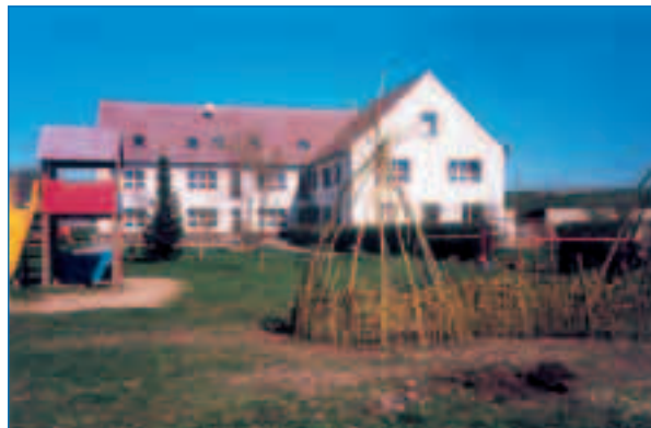
Kindereinrichtung in Wipperdorf