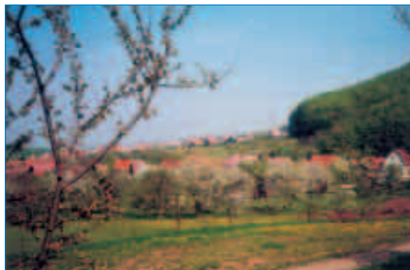
Blick auf Friedrichslohra