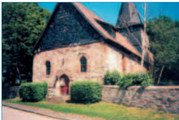
Die Kirch St. Mariae virginis in Ruxleben