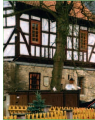
Das alte Gerichtshaus