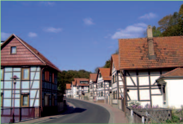
Fachwerkhäuser säumen die Straßen von Nazza