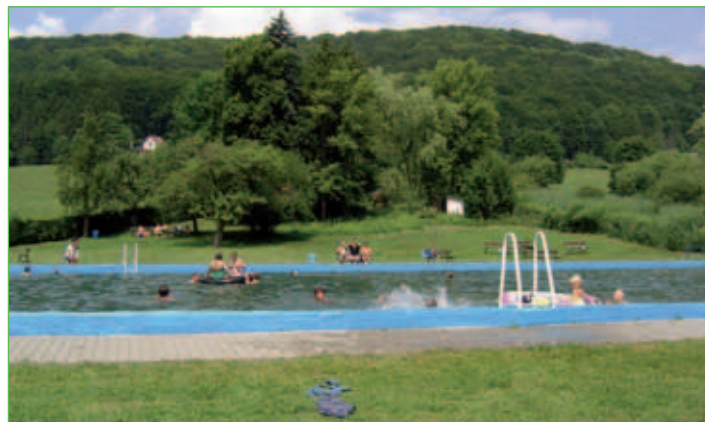
Waldbad Ritzenhausen bei Hallungen