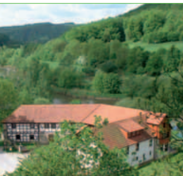
Landgasthof Probstei Zella bei Frankenroda