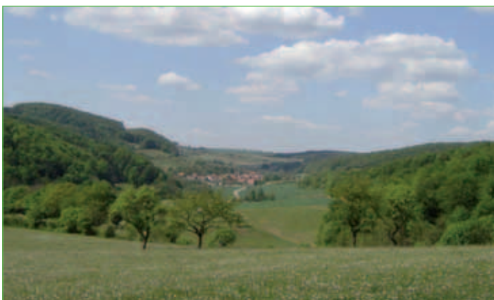
Blick auf Hallungen

Aus dieser Zeit sind an der östlichen Innenwand eingemauerte stark verwitterte Grabsteine (um 1620) sowie der Taufstein aus dem 16. Jahrhundert erhalten.