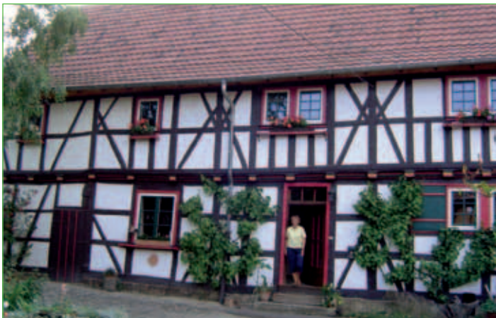
Fachwerkhaus in Berka v.d.H.