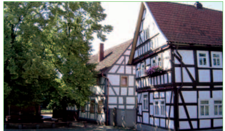
Fachwerkhäuser am Anger