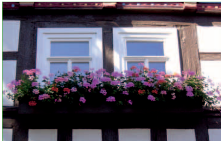
Blumen schmücken die Fachwerkhäuser