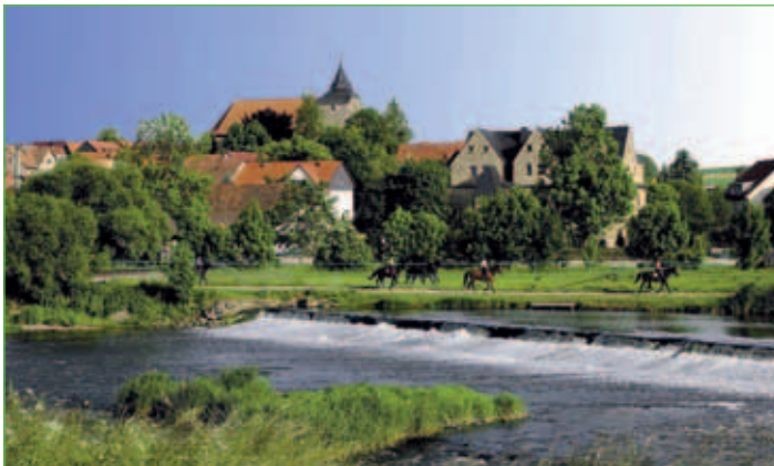
Blick über die Werra auf Mihla

Das Graue Schloss, einstige Wasserburg der Herren von Mihla aus dem 12. Jahrhundert, wurde seit 1536 unter der Ritterfamilie