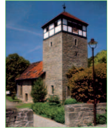
Die St. Katharinenkirche