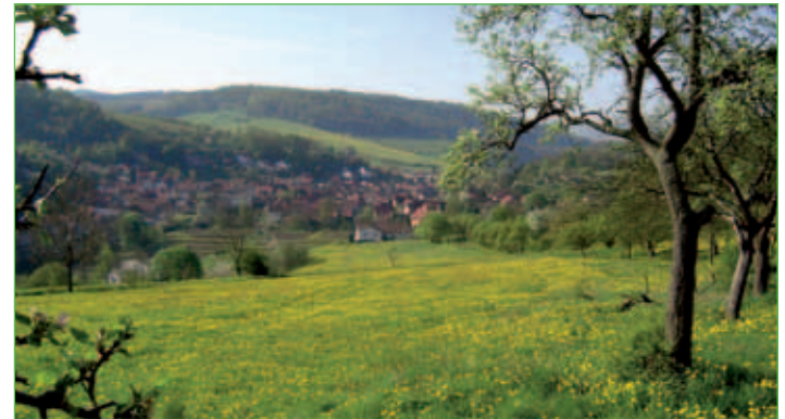
Nazza im Frühling

Die reizvolle Landschaft um Nazza lässt sich auf den gut ausgebauten Wanderwegen erleben. Für Radwanderer gibt es den Haineck-Radweg, der an der Grundmühle/Abzweig Ebenshausen beginnt und vorbei am Hallunger Waldbad nach Heyerode führt. Der Haineck-Radweg stellt eine Verbindung vom Werratal-Radweg zum Unstrut-Radweg dar.