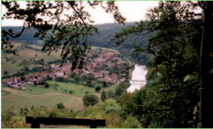
Blick auf Frankenroda