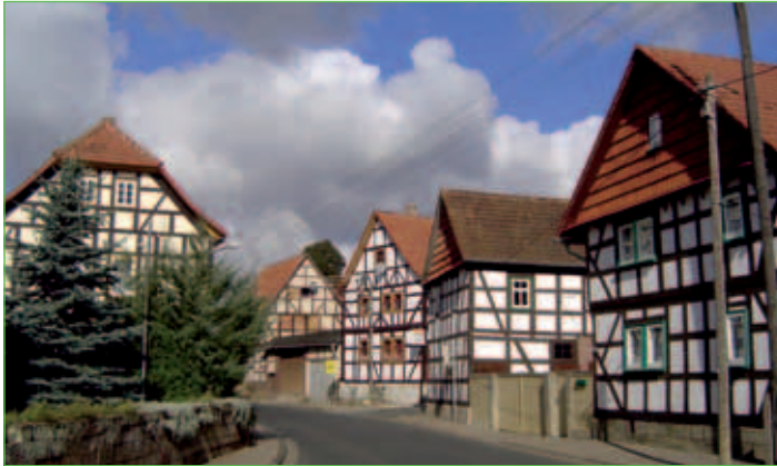
Fachwerkhäuser zieren den Dorfkern von Lauterbach