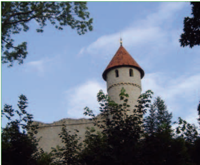
Burgruine Haineck oberhalb von Nazza

Tel.: 036924/38018 Fax: 036924/38015 Internet: www.vg-mihla.de E-Mail: tourismus-info@vg-mihla.de