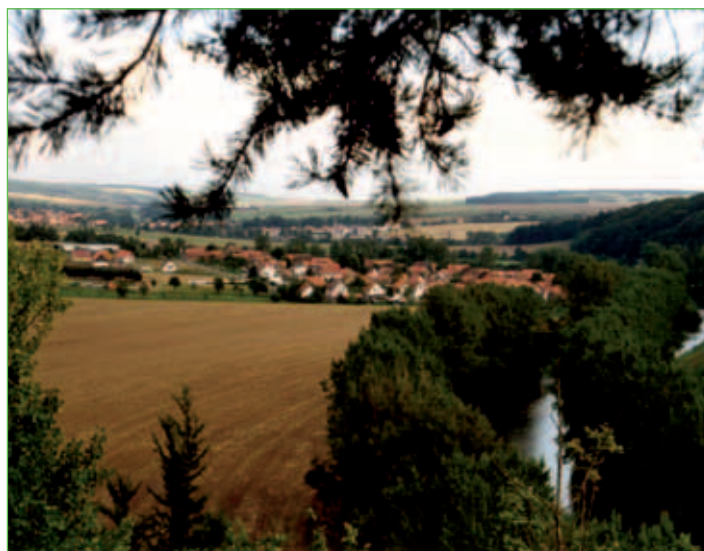
Blick auf Ebenshausen

Der Ebenshäuser Steg verband über 100 Jahre lang die beiden Gemeinden Ebenshausen und Mihla. Er wurde 1997 durch eine Hängebrücke ersetzt, welche eine wichtige Verbindung auf dem Werratal-Radweg darstellt, der direkt durch Ebenshausen führt. Ein neues Wohngebiet gehört heute ebenso zum Ort wie eine Bootsanlegestelle.