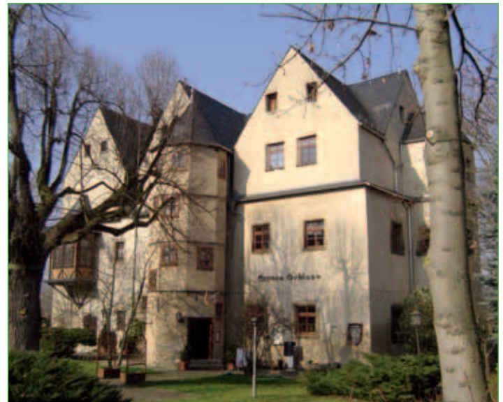
Graues Schloss in Mihla