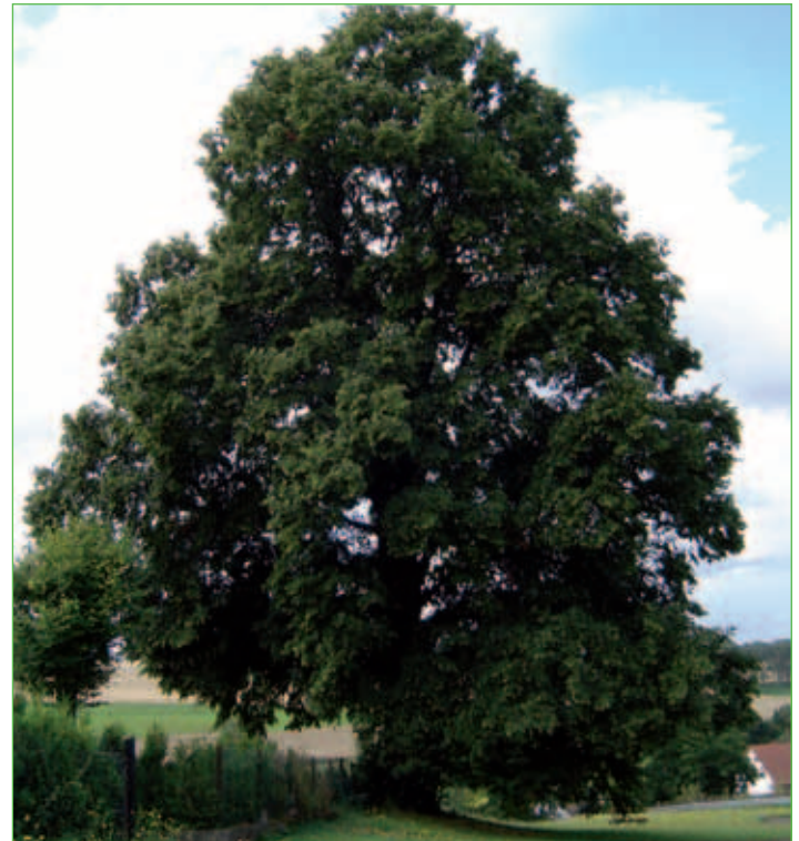
300 Jahre alte Linde in Lauterbach