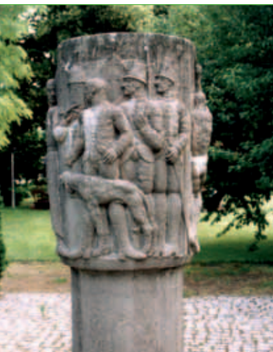
Gedenkstele – Mihla