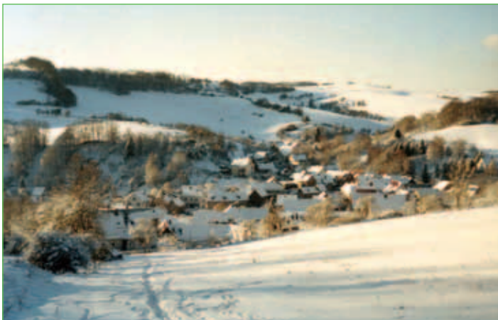
Gemeinde Nazza im Winter