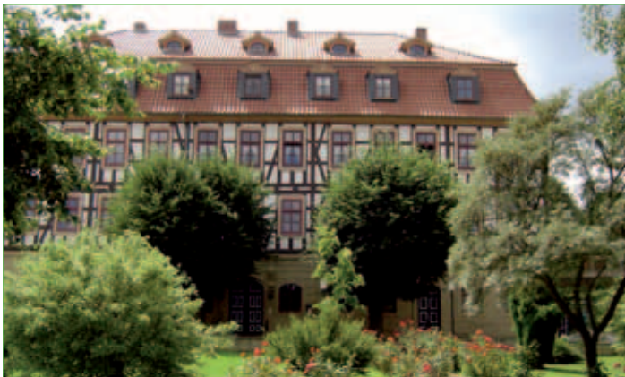
Schloss in Bischofroda

Die Straßen und Gassen sind mit Natursteinpflaster ausgelegt und schlängeln sich malerisch durch den Ort. Bischofroda kann mit Recht von sich behaupten, eines der schönsten Dörfer im Umkreis zu sein, was auch die Preise im Wettbewerb „Unser Dorf soll schöner werden“ belegen. 1992 wurde das Dorf Kreis- und Landessieger und 1993 belegte es den 3. Platz im Bundeswettbewerb. In Bischofroda gibt es zwei Wohngebiete, eine Kindertagesstätte, einen Kinderspielplatz, zwei Gaststätten, eine gut ausgebaute Sportanlage und einen Jugendclub.