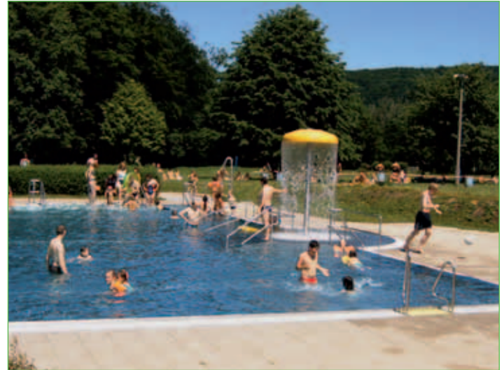
Dr. Ernst Wiedemann Bad in Mihla

Eisenach 13 km Mühlhausen 22 km Eschwege 34 km Erfurt 75 km