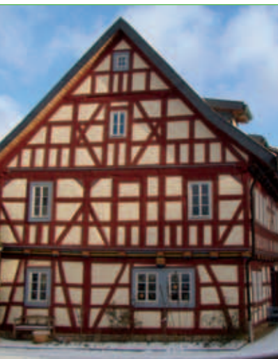
Giebelseite des Hölzerkopfhauses in Mihla