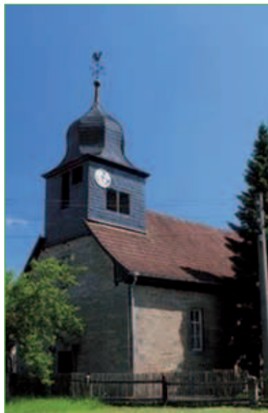
Kirche in Ebenshausen