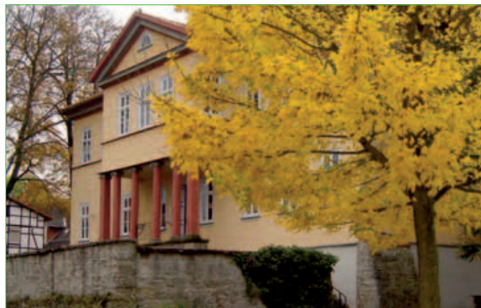
Das Schloss in Berka v.d.Hainich – Sitz der Verwaltungsgemeinschaft