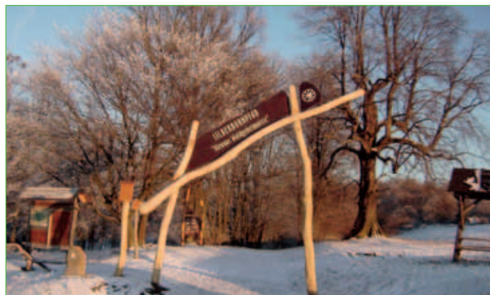
Wanderparkplatz Mallinde bei Berka v.d.H.

Berka v.d.H. verfügt über eine Grundschule, eine Sporthalle, einen Sportplatz, zwei Gaststätten, einen Jugendclub und eine Kindertagesstätte.