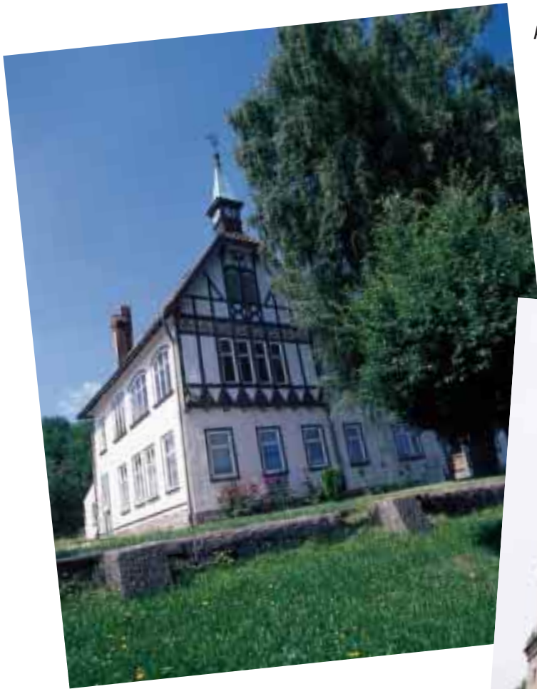
Alte Schule Nauendorf