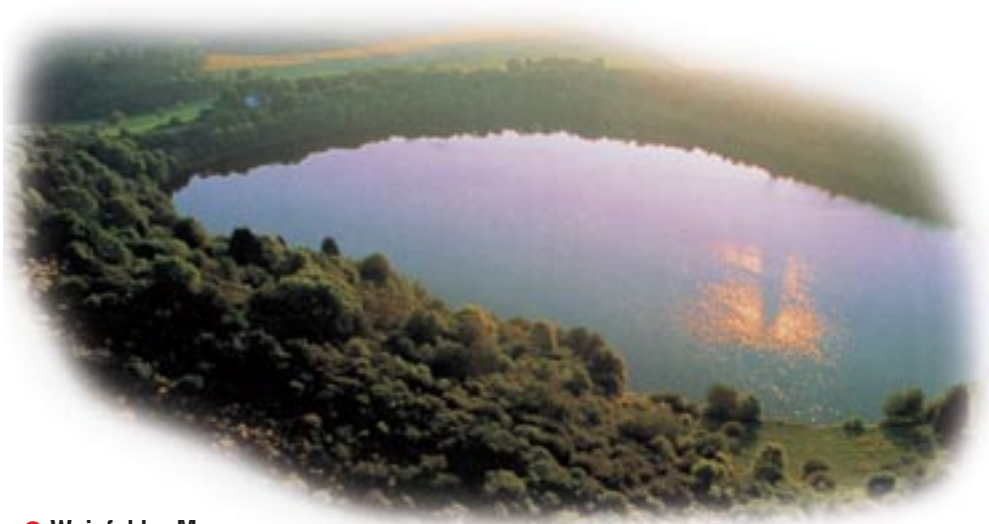
● Weinfelder Maar

Für weitere Informationen steht Ihnen die Tourist-Information und das Kur- und Verkehrsamt Daun , Leopoldstr. 5, 54550 Daun/Vulkaneifel , Tel.: 0 65 92/95 13-0, Fax: 0 65 92/95 13-20 gerne zur Verfügung.