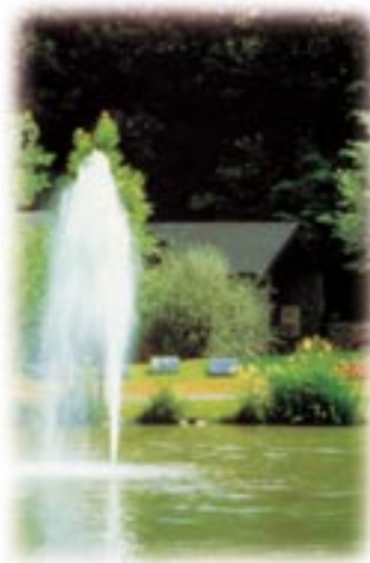
● Kurpark in Daun