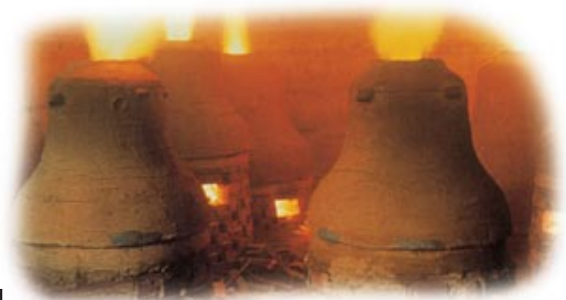
● Glockenguss in Brockscheid