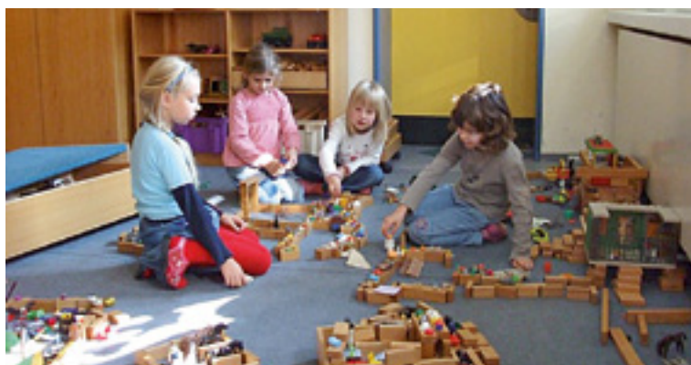
Hort an der Grundschule