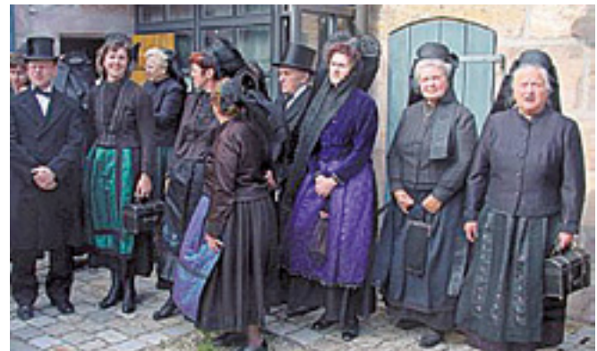
Festakt 1050 Jahre Roßtal