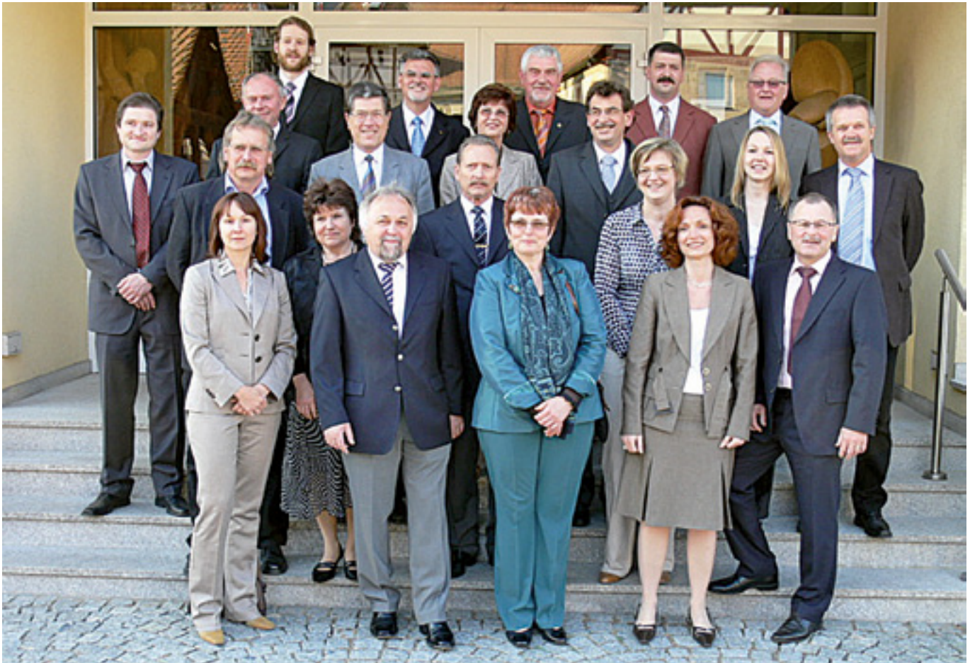
Mitglieder des Marktgemeinderates