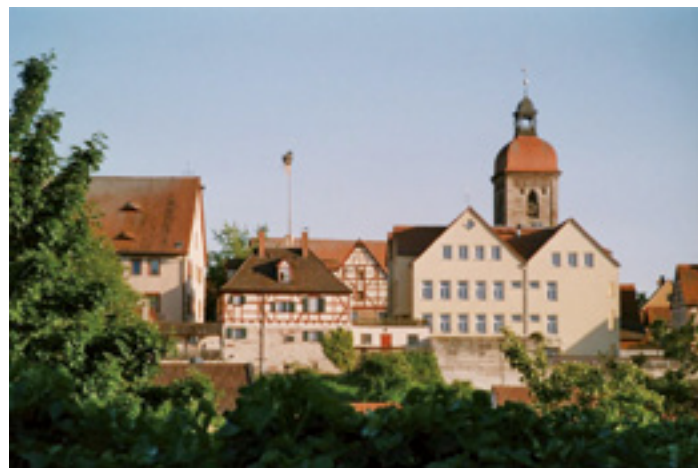
Schloss und Rathaus Roßtal