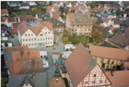
Fränkischer Marktplatz mit Roßtaler Schloss