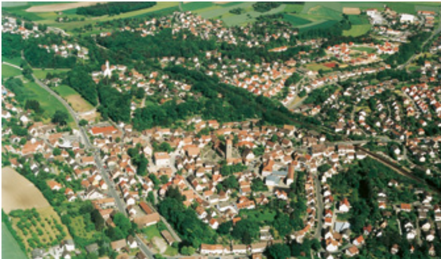
Luftbild von Roßtal

Roßtal liegt unmittelbar an der Strecke Nürnberg–Ansbach–Crailsheim, innerhalb des Gemeindegebietes befinden sich an der Strecke die Bahnhöfe und Haltepunkte Roßtal-Bahnhof , Roßtal-Wegbrücke und Raitersaich . Der Bahnhof Roßtal liegt am östlichen Rand, während der Haltepunkt Roßtal-Wegbrücke im Zentrum des Hauptortes Roßtal liegt. Die Strecke wird von der Regionallinie R7 (Nürnberg-Hauptbahnhof–Ansbach–Schnelldorf) im Stundentakt bedient. Bis voraussichtlich 2010 soll der Schienenverkehr zwischen Nürnberg und Ansbach auf S-Bahn-Betrieb durch die neue Linie S5 umgestellt werden (20-/40-Minuten-Takt).