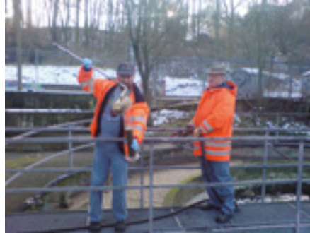
Probenahme Abwasser auf der Kläranlage Rosstal