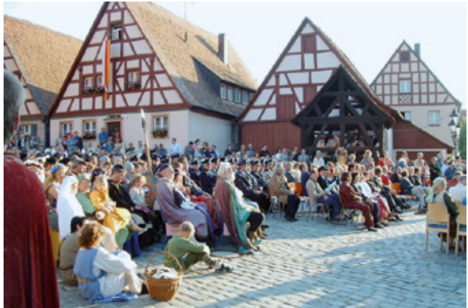
Festakt 1050 Jahre Roßtal