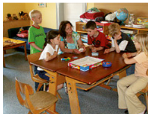
Mittagsbetreuung an der Grundschule