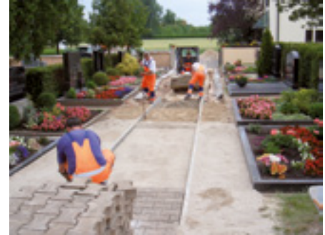
Pflasterarbeiten am Friedhof in Großweismannsdorf