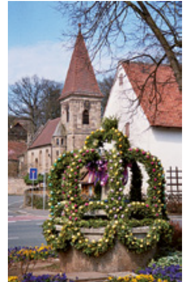
Osterbrunnen in Buchschwabach