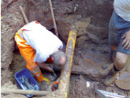
Reparatur eines Wasserrohrbruchs