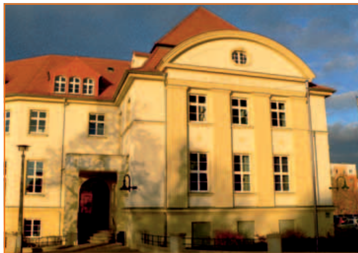
Verwaltungssitz Landkreis Oberspreewald-Lausitz

Die erforderlichen Kosten einer Bestattung werden übernommen, soweit den hierzu Verpflichteten nicht zugemutet werden kann, die Kosten zu tragen.