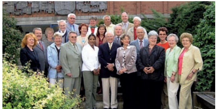
Mitglieder des Seniorenbeirates Zirndorf mit dem 1. und 2. Bürgermeister

Diese Aktivitäten und Möglichkeiten für die Senioren der Stadt Zirndorf werden in einem eigens geschaffenen Senioren-Wegweiser in Wort und Bild dargestellt.