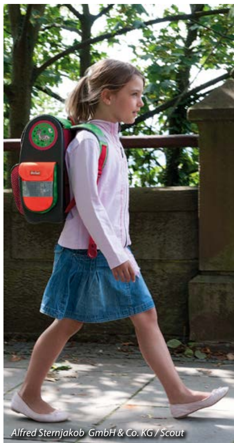
Alfred Sternjakob GmbH & Co. KG / Scout

An den ersten Schultagen sollten Sie Ihr Kind noch zur Schule begleiten. Wenn Sie das Gefühl haben, dass Ihr Kind den Weg gut allein bewältigt, können Sie sich nach anderen Erstklässlern in Ihrer Nachbarschaft umschauchen. Die Kinder können den Schulweg gemeinsam gehen. Auch diese Gruppe sollten Sie noch einmal begleiten und auf problematische Stellen hinweisen. Wenn Sie Ihr Kind über einen längeren Zeitraum begleiten, können auch die Eltern Begleitgemeinschaften bilden.