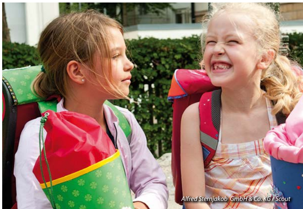
Alfred Sternjakob GmbH & Co. KG / Scout

In freien Arbeitsphasen entscheiden Kinder selbst, welcher Aufgabe sie sich zuwenden, sie teilen sich die Tätigkeit eigenständig ein und werden so zu selbstverantwortlichem Arbeiten angeleitet. Über Arbeitsergebnisse dieser Phasen tauschen sich die Schüler(innen) und die Lehrkraft aus. Zudem kann die Lehrkraft gezielt auf besonderen Förderbedarf eingehen.