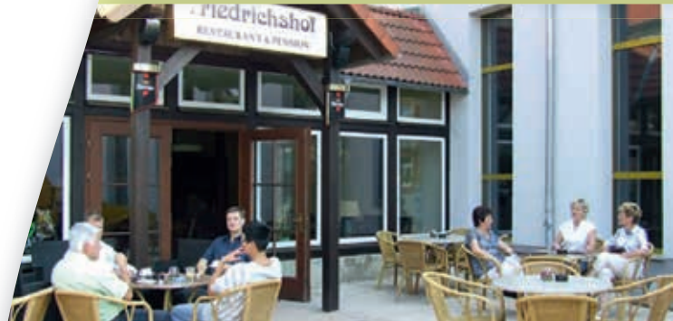
Friedrichshof Bad Klosterlausnitz