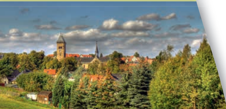
Ortsansicht Bad Klosterlausnitz