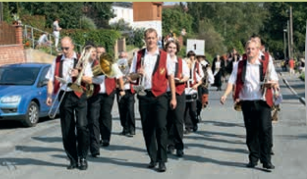
Musikverein Tautenhain e. V.