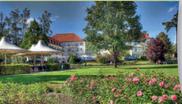
Kurpark Bad Klosterlausnitz