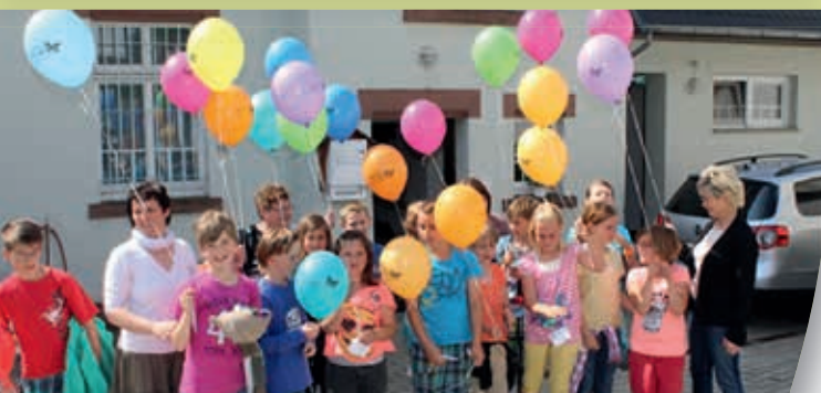
Kinder im Rathaus