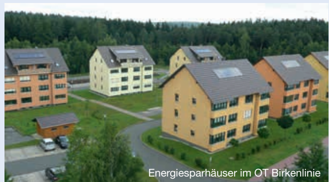
Energiesparhäuser im OT Birkenlinie

Rosa-Luxemburg-Straße 10 • 07646 Stadtroda Tel.: 03 64 28/6 99 64 • Fax: 03 64 28/6 99 70 mail@wbv-stadtroda.de • www.wbv-stadtroda.de