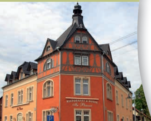
Hotel „In Piazza“ Bad Klosterlausnitz