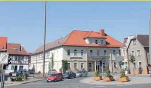
Markt, Bad Klosterlausnitz