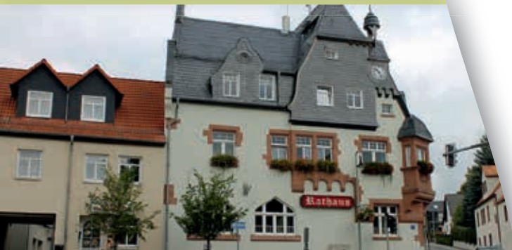
Rathaus Bad Klosterlausnitz