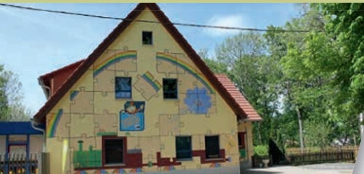
Kindertagesstätte „Rappelkiste“ Schlöben