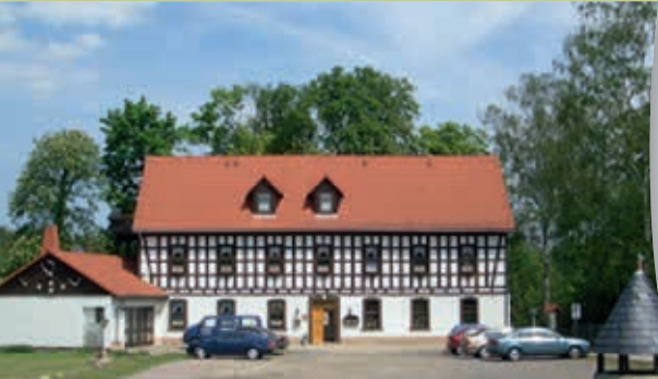
Waldhotel „Zu den drei grauen Ziegenböcken“ Serba