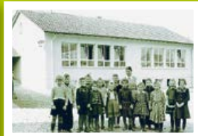
Schule Steinach ca. 1953