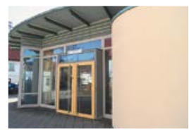
Bürgerhaus – Eingang