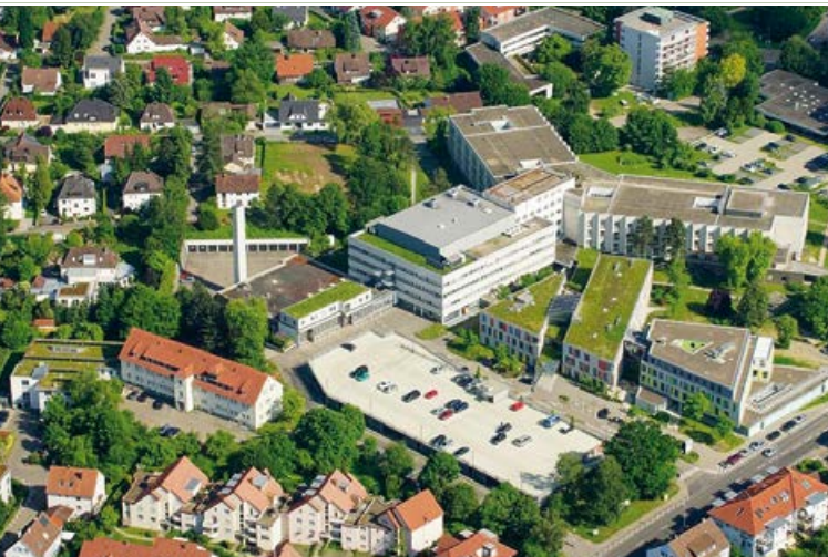
Krankenhaus in Schorndorf

Mit der Eröffnung der Rems-Murr-Klinik am Standort Winnenden im Juli 2014 genießt die Gemeinde Berglen in Bezug auf die Gesundheitsversorgung einen hohen Standortfaktor.