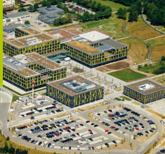
Krankenhaus in Winnenden