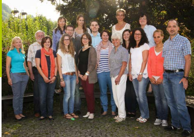
Das Team der Gemeindeverwaltung

Nach Vereinbarung stehen wir Ihnen auch außerhalb dieser Zeiten gerne zur Verfügung.