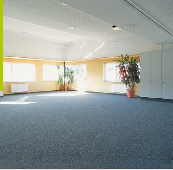
Bürgersaal im Feuerwehrhaus Süd