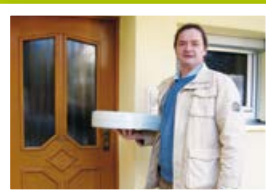
Projekt „Essen auf Rädern“