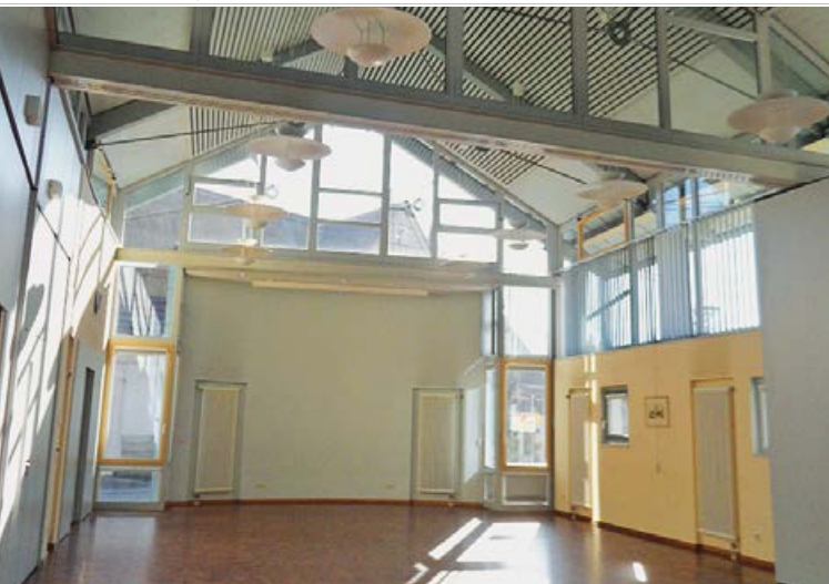
Bürgerhaus – innen