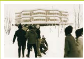
NBS Oppelsbohm im Winter