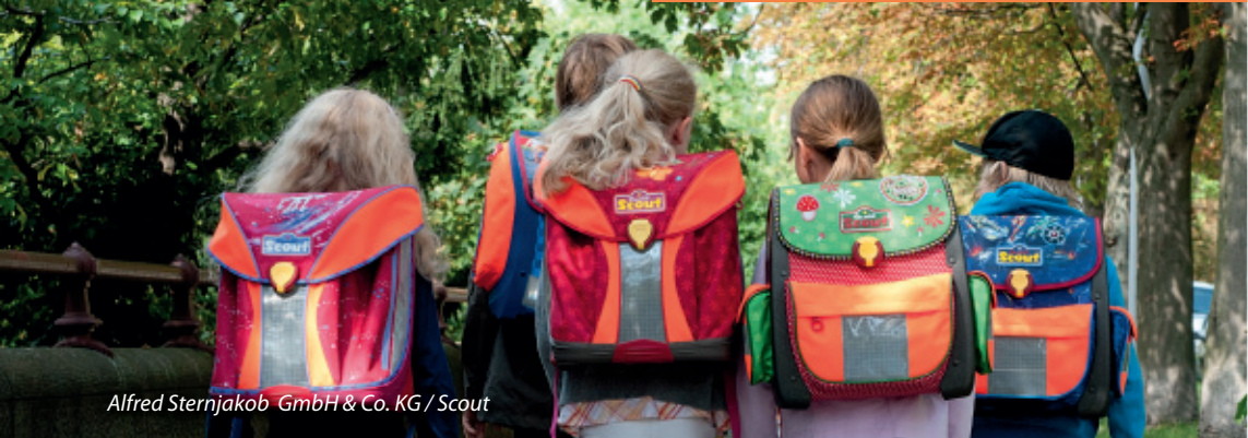
Alfred Sternjakob GmbH &amp; Co. KG / Scout