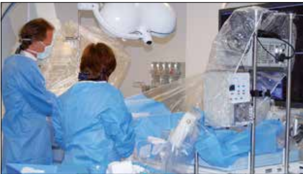
Höchste medizinische Kompetenz, moderne Ausstattung und eine sehr persönliche Betreuung erfahren Patienten in allen LAKUMED-Einrichtungen