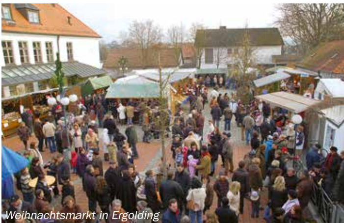
Weihnachtsmarkt in Ergolding