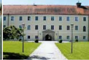
■ Schlossklinik Rottenburg Telefon: 08781. 94 99-0