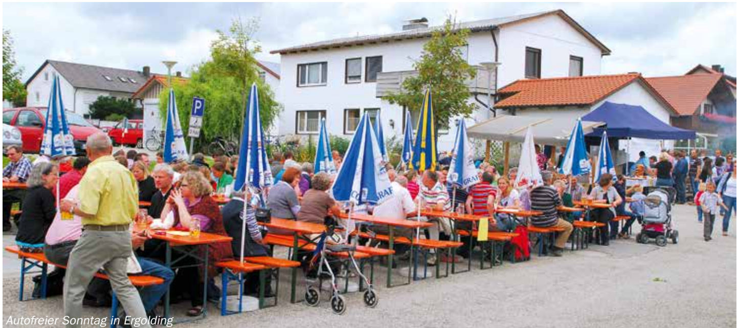
Autofreier Sonntag in Ergolding