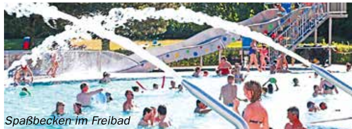
Spaßbecken im Freibad

Für Ihr leibliches Wohl sorgt unser umfassendes Angebot in der Gastronomie der Badewelt, im KULIMAR im Foyer, im Freibadkiosk sowie an der Saunafitbar. Unser freundliches Servicepersonal freut sich, Ihren Aufenthalt im ERGOMAR unvergesslich zu machen! Weitere Informationen über das ERGOMAR (Industriestraße 7) gibt es unter Telefon: 0871 14387-02 und im Internet unter www.ergomar-ergolding.de .