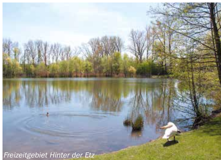
Freizeitgebiet Hinter der Etz