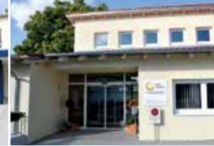
■ Hospiz Vilsbiburg Telefon: 08741. 94 94 9-0