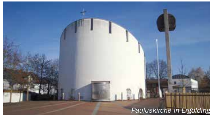
Pauluskirche in Ergolding

Sonntag: 09.30 Uhr in der Kreuzkirche Ergolding Gleichzeitig: Kinderbetreuung, Sonntagsschule, Gemeindeunterricht (Abendmahl am 1. Sonntag) Es sind folgende Angebote vorhanden: Hauskreise, Bibelgespräch (14tägig), Seniorenkreis (15.00 Uhr, 4. Mittwoch im Monat), Jugendgruppe (19.00 Uhr, Freitag), Frauengesprächskreis, Junge Familien