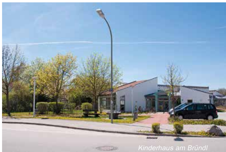
Kinderhaus am Bründl

beim Sonderpädagogischen Förderzentrum Landshut-Land s. Seite 24 beim Kinderhaus St. Johannes s. Seite 27 in der Grund- und Mittelschule Ergolding s. Seite 23