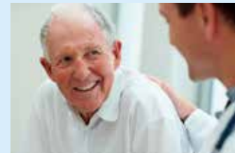
■ Pflege bei LAKUMED: persönlich, kompetent, dem Patienten zugewandt