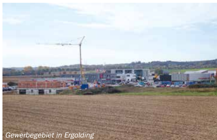
Gewerbegebiet in Ergolding