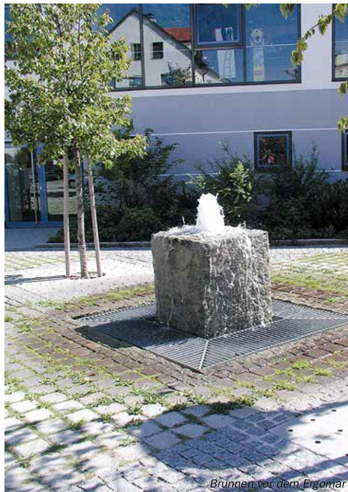
Brunnen vor dem Ergomar

ding zunächst nicht zu einem Marktflecken. Die Gemeinde blieb bis in unser Jahrhundert hinein ein rein landwirtschaftlich ausgerichtetes Dorf. Der Grund liegt im raschen Aufstreben der benachbarten Stadt Landshut, die bald nach ihrer Gründung im Jahre 1204 wirtschaftlicher und gesellschaftlicher Mittelpunkt in der Region wurde.