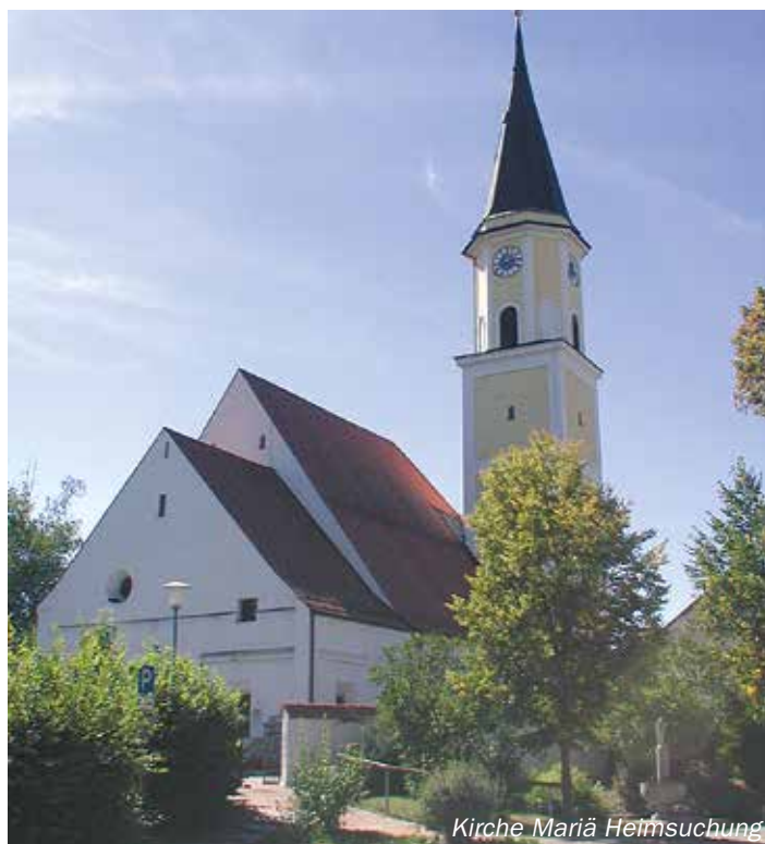
Kirche Mariä Heimsuchung