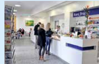
■ Ambiente zum Wohlfühlen, patientengerechte Einrichtung