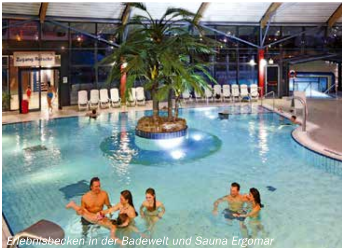
Erlebnisbecken in der Badewelt und Sauna Ergomar

Die traumhafte Sauna des ERGOMAR bietet Ihnen Entspannung pur. Die urige Blockhaussauna und das große Saunahaus im Außenbereich, sowie die finnische Sauna und die Meditationssauna im Innenbereich. Ein Dampfbad und eine Infrarotkabine komplettieren das Angebot. Für Abkühlung sorgen das in einen Felsenteich eingebettete Tauchbecken, die Erlebnisduschen mit Eisbrunnen und die Fußbäder. Ruhe finden Sie nach einem heißen Saunagang in zwei Ruheräumen, mit und ohne Entspannungsmusik, oder im kommunikativen Bereich rund um den offenen Kamin. Wohlig warm entspannen können Sie im sprudelnden Whirlpool oder Frischluft tanken im ca. 1000 qm großen