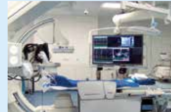
■ modernste technische Ausstattung