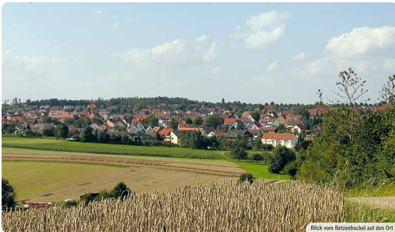
Blick vom Betzenbuckel auf den Ort