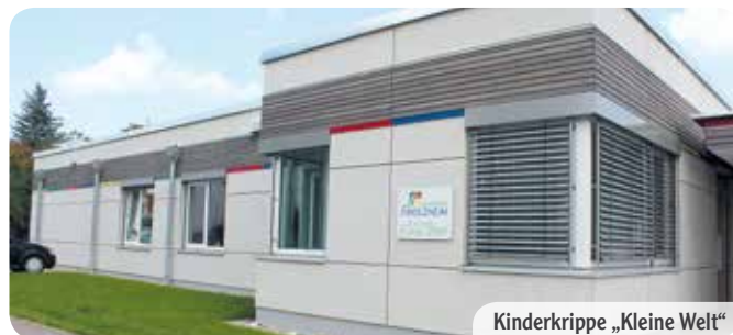
Kinderkrippe „Kleine Welt“

Die Angebote sind außerordentlich vielfältig und decken nahezu jeden Betreuungsbedarf ab.