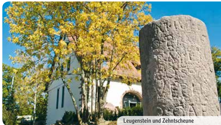
Leugenstein und Zehntscheune

Schwalbenstraße 9 71292 Friolzheim Telefon: 07044 950103