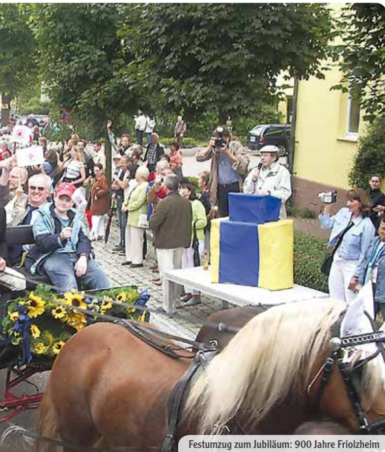
Festumzug zum Jubiläum: 900 Jahre Frielzheim