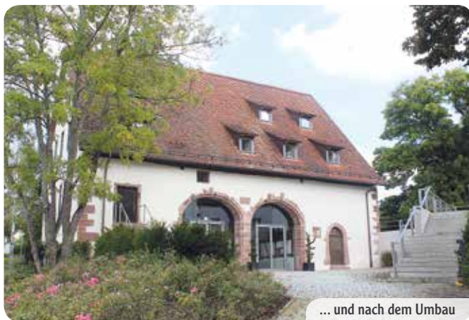
... und nach dem Umbau

So wurde im Jahr 1993 der Trinkwasserbrunnen „Eichbrunnen“ sowie der Wasserhochbehälter am Geissberg in Betrieb genommen.