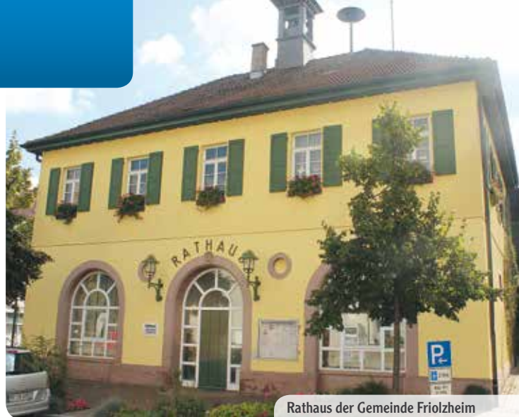
Rathaus der Gemeinde Frielzheim

Mo. + Do.: 08.00 – 12.30 Uhr und 13.30 – 16.30 Uhr Di.: nicht geöffnet Mi.: 08.00 – 12.00 Uhr und 15.00 – 18.00 Uhr Fr.: 08.00 – 12.30 Uhr