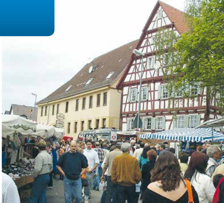
Der jährliche Pfingstmarkt lockt zahlreiche Besucher

Im Vergleich zur Region Stuttgart moderate Grundstückspreise, eine unkomplizierte Abwicklung Ihres Ansiedlungswunsches sowie die seit rund einem Vierteljahrhundert stabile Grund- und Gewerbesteuer machen Friolzheim auch für Ihr Gewerbe attraktiv. Ferngasversorgung und der Anschluss an das Hochgeschwindigkeits-Datennetz der Telekom sind vorhanden.