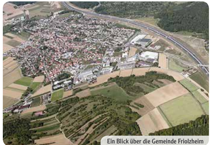
Ein Blick über die Gemeinde Frielzheim

Frielzheim liegt in der Region Nordschwarzwald am östlichen Rand des Enzkreises, und gehört somit auch zur Metropolregion Stuttgart. Inmitten der Landschaft des Heckengäu ist Frielzheim verkehrsgünstig direkt an der Bundesautobahn A8 gelegen (1,5 km zur Ausfahrt Heimsheim). Die Städte Pforzheim in der Region Nordschwarzwald sowie Leonberg in der Region Stuttgart sind mittels PKW über die Autobahn oder durch die guten öffentlichen Nahverkehrsverbindungen schnell erreicht.