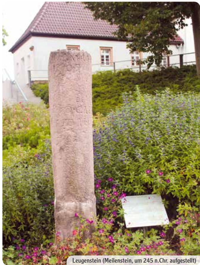
Leugenstein (Meilenstein, um 245 n.Chr. aufgestellt)

trugen zunächst mit zur schnellen Umwandlung vom Bauerndorf zur Arbeiterwohngemeinde bei, die sich bis zum Jahr 1950 auf 936 Einwohner erweiterte.