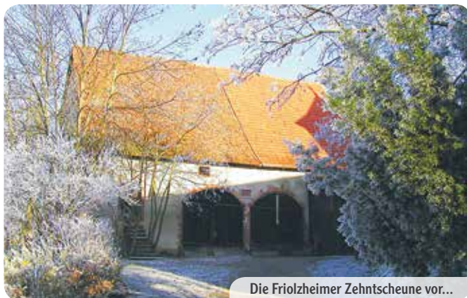
Die Friezheimer Zehntscheune vor...