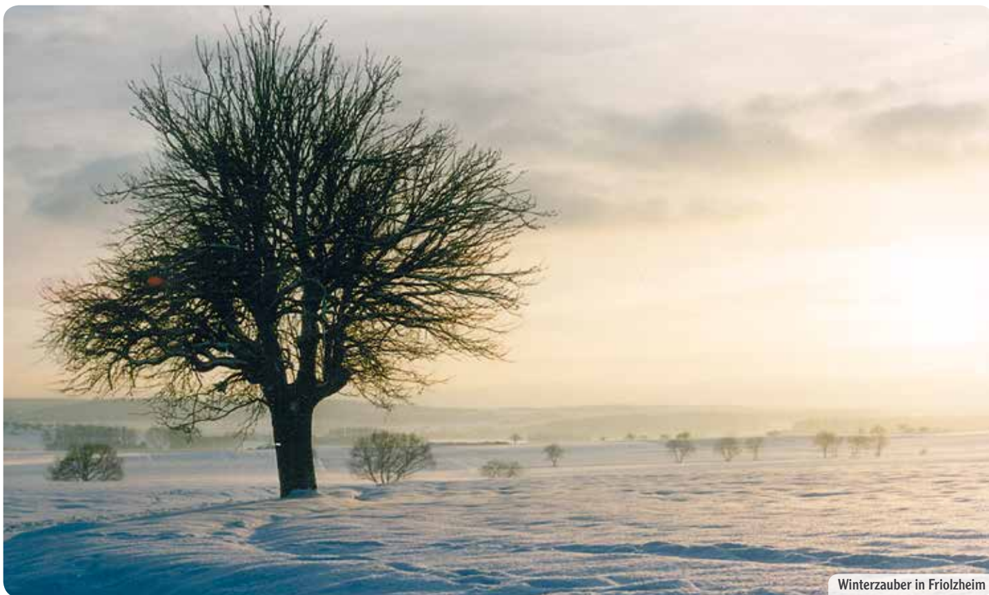
Winterzauber in Frielzheim

Mit Sachverstand und Kompetenz. Mit Herzenswärme, Verständnis und Tatkraft.